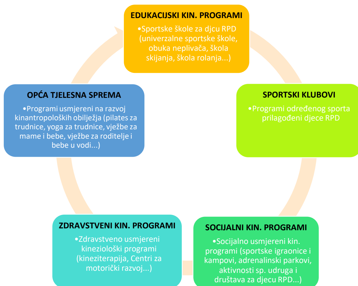
Grafički prikaz 2: Pregled izvaninstitucijskih kinezioloških programa za djecu rane i predškolske dobi

Prema Državnom pedagoškom standardu (2008) izvanvrtičke aktivnosti (programi) su oblik svih aktivnosti koje sportske organizacije planiraju, programiraju i realiziraju s djecom. Danas postoji uistinu veliki broj kinezioloških programa organiziranih izvan ustanova za rani i predškolski odgoj i obrazovanje u koje se djeca mogu uključiti s obzirom na njihove interese. Ovakvi programi omogućuju djeci stjecanje navike bavljenja tjelesnom aktivnošću od najranije dobi, potiču socijalizaciju, razvoj raznih vještina, samopouzdanja, ljubavi i želje prema aktivnom načinu življenja (Andijašević, 2000).