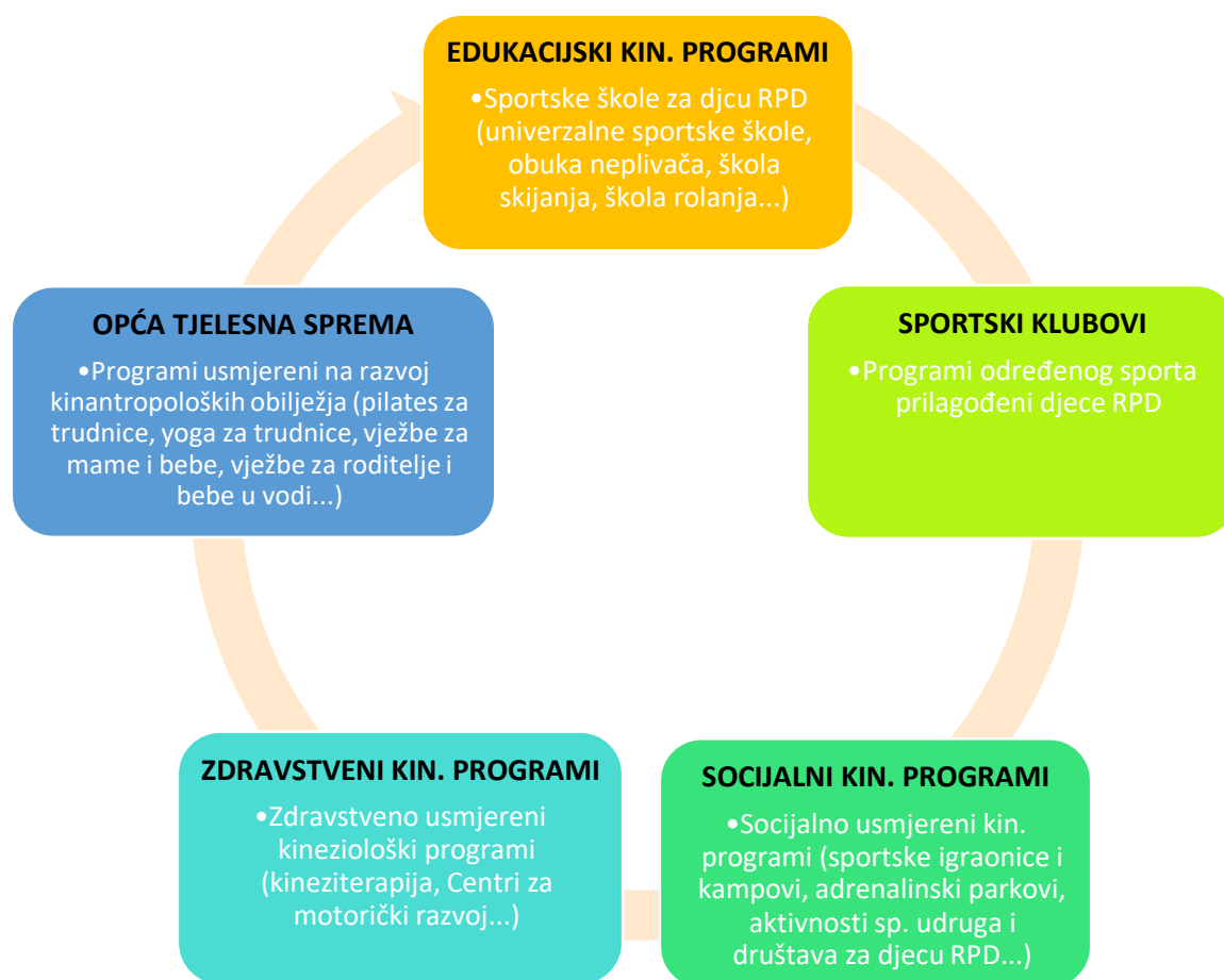
Grafički prikaz 2: Pregled izvaninstitucijskih kinezioloških programa za djecu rane i predškolske dobi

Prema Državnom pedagoškom standardu (2008) izvanvrtičke aktivnosti (programi) su oblik svih aktivnosti koje sportske organizacije planiraju, programiraju i realiziraju s djecom. Danas postoji uistinu veliki broj kinezioloških programa organiziranih izvan ustanova za rani i predškolski odgoj i obrazovanje u koje se djeca mogu uključiti s obzirom na njihove interese. Ovakvi programi omogućuju djeci stjecanje navike bavljenja tjelesnom aktivnošću od najranije dobi, potiču socijalizaciju, razvoj raznih vještina, samopouzdanja, ljubavi i želje prema aktivnom načinu življenja (Andijašević, 2000).