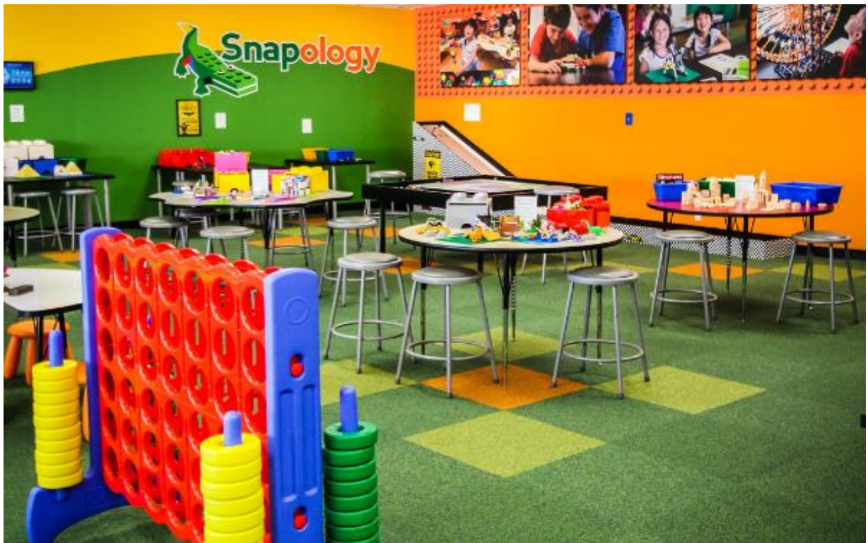
Slika 1. Unutrašnjost Snapology centra

i otvoreni su za posebne zahtjeve roditelja i djece. Kurikulum omogućuje učiteljima fleksibilnost te je moguća prilagođenost kurikuluma s obzirom na potrebe i interese djece koja pohađaju određene programe. Posebno su zanimljivi programi koji su prilagođeni djeci dobi od 2-6 godina u kojima se koristi pristup učenja putem igre. Programi su usmjereni ka razvijanju kreativnosti i fine motorike kroz učenje određenih sadržaja kao što su prepoznavanje slova, fonetika, vještina pisanja, vještina pričanja priča, osnove robotike i inženjerstva. Ističu važnost inspiriranja djece već od najranije dobi kako bi djeca ostvarila svoj puni potencijal. Uz akademska znanja koja djeca stječu polazeći ove programe, kod djece se razvijaju i socijalne vještine putem interaktivnog učenja. Slika 1 prikazuje unutrašnjost Snapology centra u kojemu se jasno može vidjeti kako je prostor raspoređen po centrima aktivnosti.