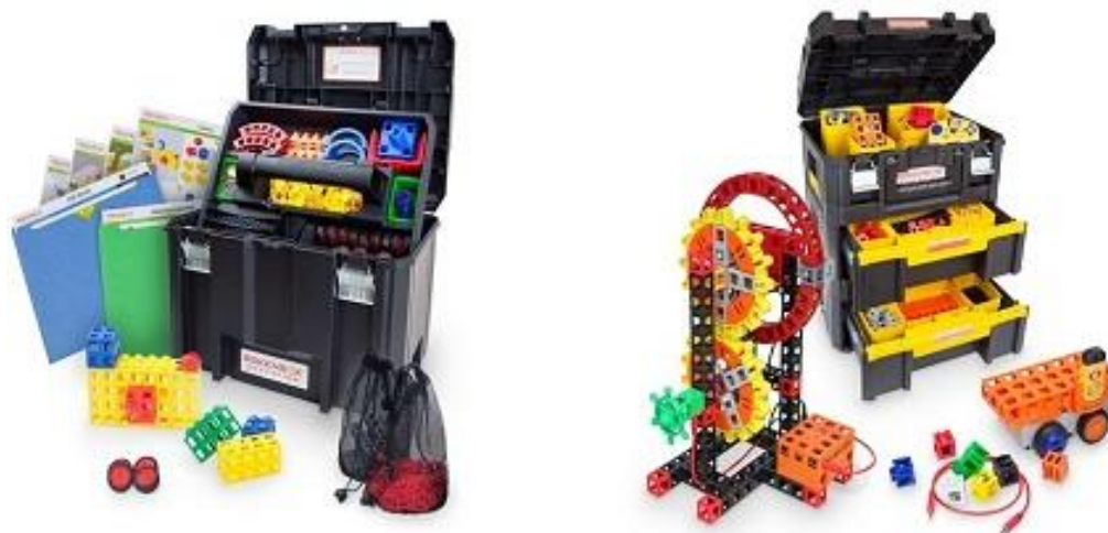
Slika 3. Mobilni STEM laboratorij

https://www.eduporium.com/pub/media/wysiwyg/Kid_Spark_cropped_1.jpg