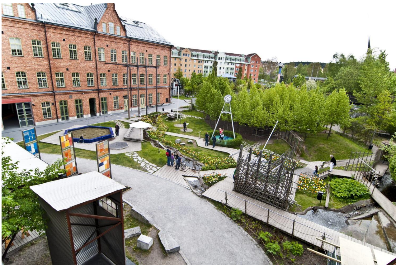
Slika 6. Eksterijer Tom Tits centra

https://www.google.com/search?q=tom+tits+experiments+&fbm=isch&ved=2ahUKEwi288zFw97yAhXFgqQKHZADA2YQ2-cCegQIABAA&oq=tom+tits+experiments+&gs_lcp=CgNpbWcQA1CB8ARYtfEEYMv3BGgAcAB4AIABZlgBtAGSAOMxLjGYAOCgAOGqAQtnd3Mtd2l6LWltZ8ABAO&sclient=img&ei=49YvYfb1J8WFkgWQh4ywBg&bih=710&biw=1686&hl=hr#imgsrc=sLWTcUd1YsEHcM&imgdii=QDn82WuB3JoK-M