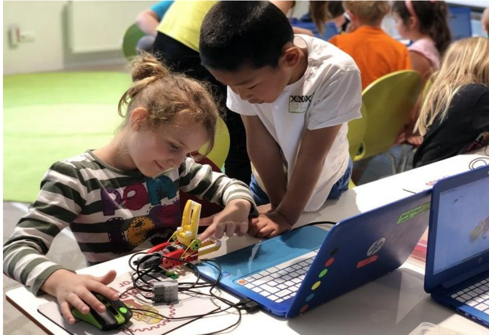
Slika 4. Aktivnost programiranja

https://www.facebook.com/EFKAustria/photos/pcb.471905232477661/4719050728111154/