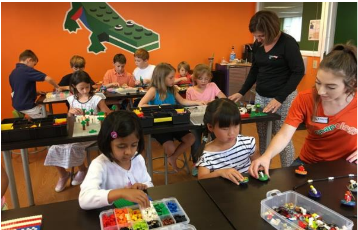
Slika 2. Djeca u igri s Lego kockama

Snapology centar zanimljiv je iz još jednog razloga, a to su Lego igračke za koje njihovi stručnjaci smatraju kako su milijun igračaka u jednoj te djeca igrajući se upravo ovim igračkama nauče mnogo stvari i usvoje različite vještine poput fine motorike, vizualne percepcije, manipulacije različitim predmetima, načine funkcioniranja različitih mehanizama, a najvažnija činjenica je ta da djeca svaki put naprave nešto novo koristeći svoju kreativnost što je vidljivo na slici 2 ( https://www.snapology.com/ ).