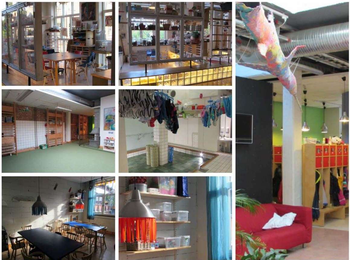
Slika 5. Interijer Tom Tits centra

https://www.google.com/search?q=tom+tits+experiments+interior&tbm=isch&ved=2ahUKEwigopPcwD7yAhUaJcUKHViKCL4Q2-cCegQIABAA&oq=tom+tits+experiments+interior&gs_lcp=CgNpbWcOA1C22w5Yl_EOYODzDmgAcAB4AIABYYgBowaSAOE5mAEAoAEBqgELZ3dzLXdpei1pbWfAAOE&scient=img&ei=-tQvYaC9BJrKIAbYIKLwCw&bih=710&biw=1686&hl=hr#imgrc=XJK-uBKpHVTs1M&imgdii=s9pDnqqKpoL9TM