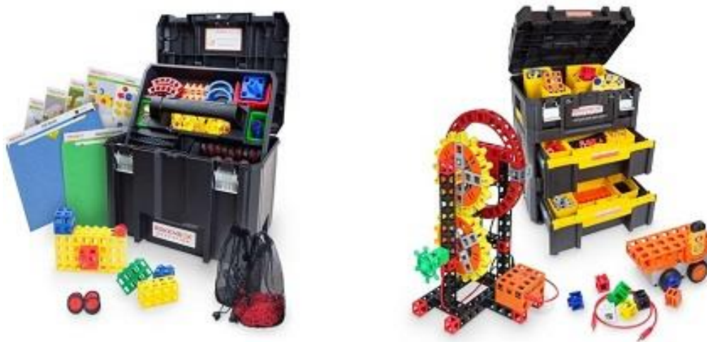
Slika 3. Mobilni STEM laboratorij

https://www.eduporium.com/pub/media/wysiwyg/Kid_Spark_cropped_1.jpg