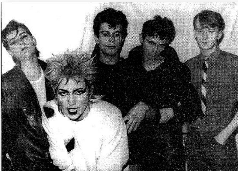
Slika 17. Grupa Paraf na prvom Ri-Rock festivalu 1979. godine