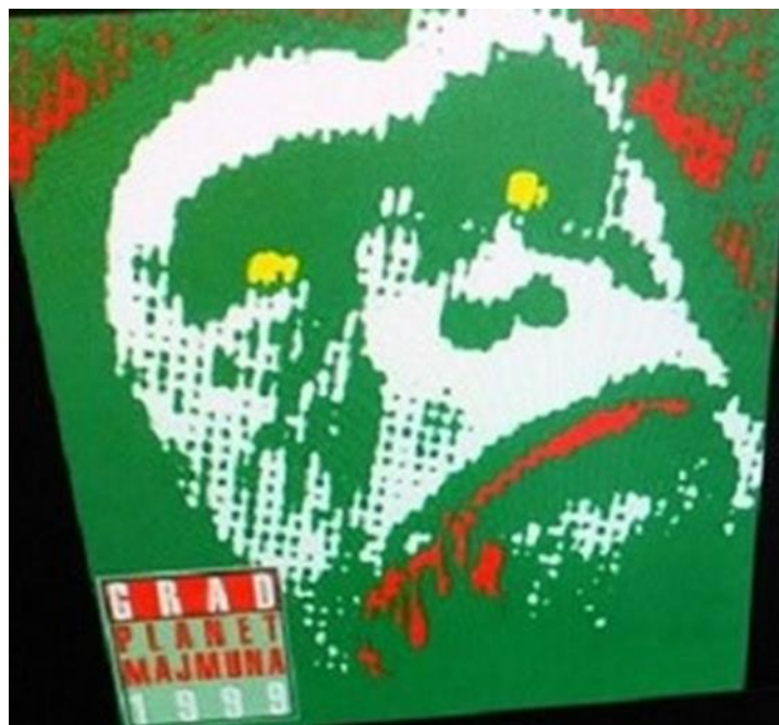
Slika 13 . Grupa Grad: Planet majmuna 1999, Dallas Records 1998.