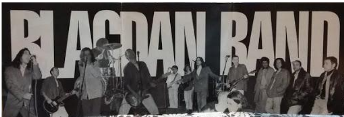
Slika 11. Okupljeni Blagdan Band ( http://mp3kick.ru/release-album/id/fadfehh/Palach-Is-Not-Dead )