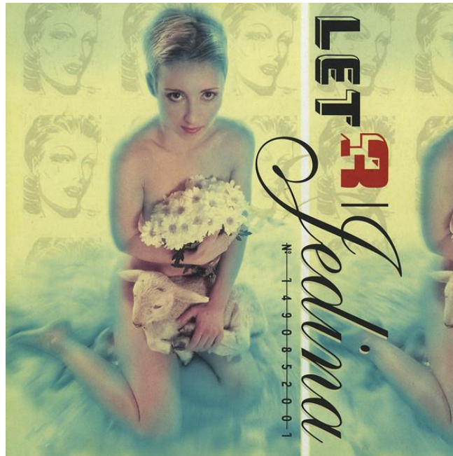
Slika 15. Album grupe Let 3 Jedina izdan u nakladi Dallas Recordsa 2000. godine