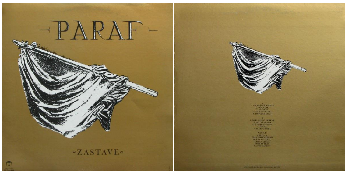
Slika 7. Omot albuma Zastave grupe Paraf iz 1984. godine ( https://www.discogs.com/Paraf-Zastave/release/1040281 )

Zbog raspada Termita Robert Tičić dolazi u Parafe, ali nedugo zatim njegov život završava zbog urođene srčane mane. U prosincu 1984 godine izlazi najznačajniji album Parafa s nazivom Zastave. Album je uvelike doprinio riječkom i hrvatskom rocku, te Novom valu. Grupa Denis & Denis izdaje novu pjesmu Program tvog kompjutera koja ubrzo zatim postiže veliki uspjeh na prostoru bivše Socijalističke Federativne Republike Jugoslavije. Vođeni postignutim uspjehom ubrzo objavljuju album Čuvaj se na kojem se nalazi singl Program tvog kompjutera. Iste godine Xenia izdaje svoj posljednji album Tko je to učinio. Riječka grupa Furije nastupa na Festivalu mladih i postiže uspjeh u Pazinu. Cure iz Opatije osnivaju prvi ženski bend na Kvarneru s nazivom Cacadou Look. Održan je prvi heavy metal koncert grupe Nož u Leđa. Od članova bivših rock bendova nastaje novi bend Walter koji ubrzo postiže uspjeh na Gitarijadi 84. Gitarijada ostaje natjecateljski događaj koji se održao sve do današnjih dana, dok je Ri-Rock festival zadržao vrijednosti izvođenja pjesama i prezentaciju novih izvođača ( http://www.rirock.com/rirock-povijest/1984/ ).