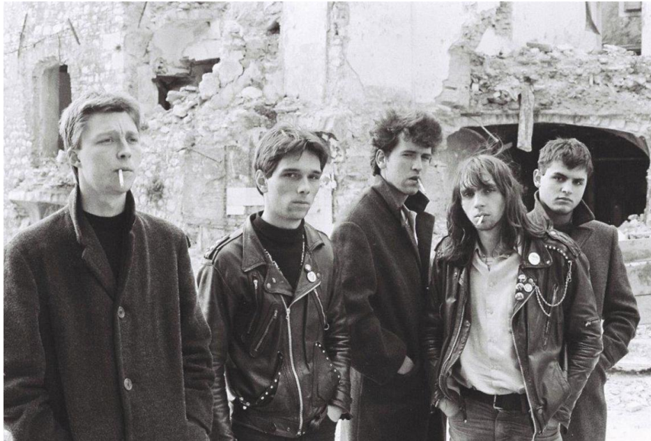
Slika 2. Grupa Termiti 1982 godina

Naredna godina bila je nešto perspektivnija. Nekolicina rock grupa sa područja Rijeke održala je službeni koncert u dvorani Circolo. Na tom događaju najviše se istaknula grupa Paraf koja je svojim energičnim nastupom osvojila slušatelje. Kroničari parafa najčešće uzimaju 22. ožujak 1978. godine kao prvi službeni nastup Parafa. To je ujedno i prvi zabilježeni, prijavljeni punk koncert na prostoru bivše Jugoslavije. Navedeni događaj bio je slabo popraćen od strane lokalnih medija. Iste godine počinje rad prvih riječkih punk bendova: Termiti, Protest, Lom i Zadnji. Ti su bendovi na scenu donijeli nešto novo do tada ne viđeno na prostorima bivše Jugoslavije, energičnost, bunt, protest protiv tadašnjeg režima i nekakvu vrstu otpora. Takve motive i poruke bilo je lako iščitati iz tekstova pjesama koje su izvodili. Krajem godine svoj prvi koncert održala je grupa Termiti. Paraf i Zadnji nastupaju u Sloveniji gdje svojim pjesmama dobivaju pažnju i slovenskih slušatelja. Veliki uspjeh Parafa zabilježen je 14. studenog gdje su uz Azru, Pankrte i Prljavo Kazalište napravili upečatljiv nastup. U prosincu je Paraf uspio odraditi još jedan koncert u Novom Sadu na Boom Festivalu ( http://www.rirock.com/rirock-povijest/1978/ ).