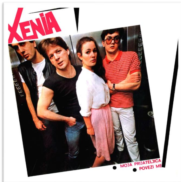
Slika 5. Omot vinyla grupe Xenia iz 1982. godine: Moja prijateljica/ Povezi me

Početak 1981. godine izlazi kompilacija pjesama bivše Jugoslavenske glazbene scene pod nazivom Novi punk val. Na tom albumu mogu se pronaći pjesme Narodna pjesma grupe Paraf i Vjeran pas, Mama s razlogom se brineš te Vremenska prognoza grupe Termiti. Nakon odlaska pjevača Valtera Parafi pronalaze novog pjevača te na njegovo mjesto dolazi Pavica Mijatović. Na mjestu gitariste nalazio se Klaudio Žic, ali se na tom mjestu nije dugo zadržao te ga zamjenjuje Mladen Vičić, a na klavijature dolazi Raoul Varljen. Sve te izmjene članova rezultirale su potpunom promjenom glazbenog izričaja, a u prosincu izlazi novi album Izleti. Osnovan je novi bend Xenia, prikazan na slici 4, u koji iz nekadašnje grupe Vrijeme i Zemlja dolaze Joško Serdarević na bubnjeve i Marinko Radetić na bas gitaru ( http://www.rirock.com/rirock-povijest/1981/ ).