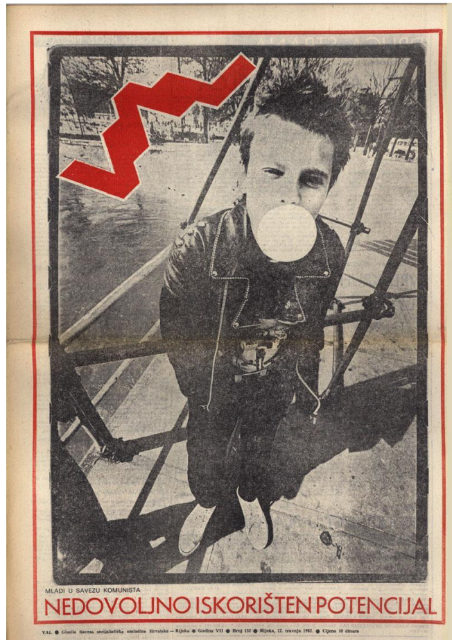
Slika 1. Naslovnica časopisa Val, izdanje travanj 1982. ( https://www.xxzmagazin.com/val-rival-ri-val )