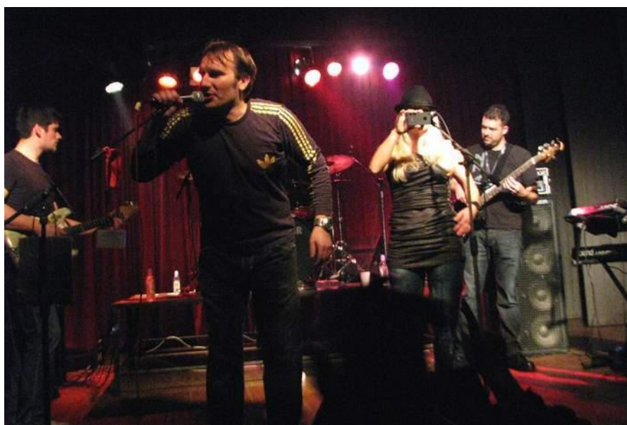
Slika 10. Nastup Šajete u istarskom klubu mladih Mate Balota u Zagrebu 2011. godine ( https://istarski.hr/node/1119-sajeta-odusevio-istarske-studente-u-zagrebu )

U studenom 1994. godine objavljena su dva vrlo važna albuma za riječku glazbenu scenu. Laufer objavljuje album Pustinja, a Let 3 album Peace. Let 3 je privremeno iz Rijeke preselio u središnju Istru gdje su stvorili nove skladbe poput Kontinento, Luna Cinquina, Nafta, Novine itd. Oba albuma rezultirala su višemjesečnim turnejama za oba benda diljem zemlje te rezultirala ovacijama publike i odličnim kritikama medija. Do kraja godine izlazi drugi album grupe En Face s imenom S dlana boga pala si. Na albumu se nalazi istoimeni hit singl koji je otpjevan u suradnji s Damirom Urbanom, a pjesma je 1996. godine dobila Porina i time ušla u povijest kao jedna od značajnijih pjesama u povijesti hrvatske glazbe. Izašla je prva glazbena enciklopedija u Hrvatskoj, Mala enciklopedija hrvatske pop i rock glazbe. Jedina je to knjiga koja je pokrila gotovo sve značajnije hrvatske glazbenike i izvođače ( http://www.rirock.com/rirock-povijest/1994/ ).