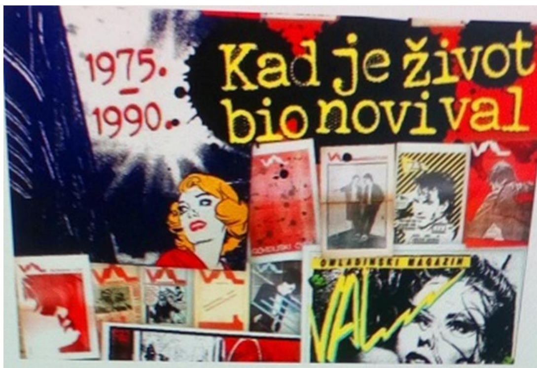
Slika 4. Edi Jurković-knjiga: Kad je život bio novi val, Naklada Val, 2021.