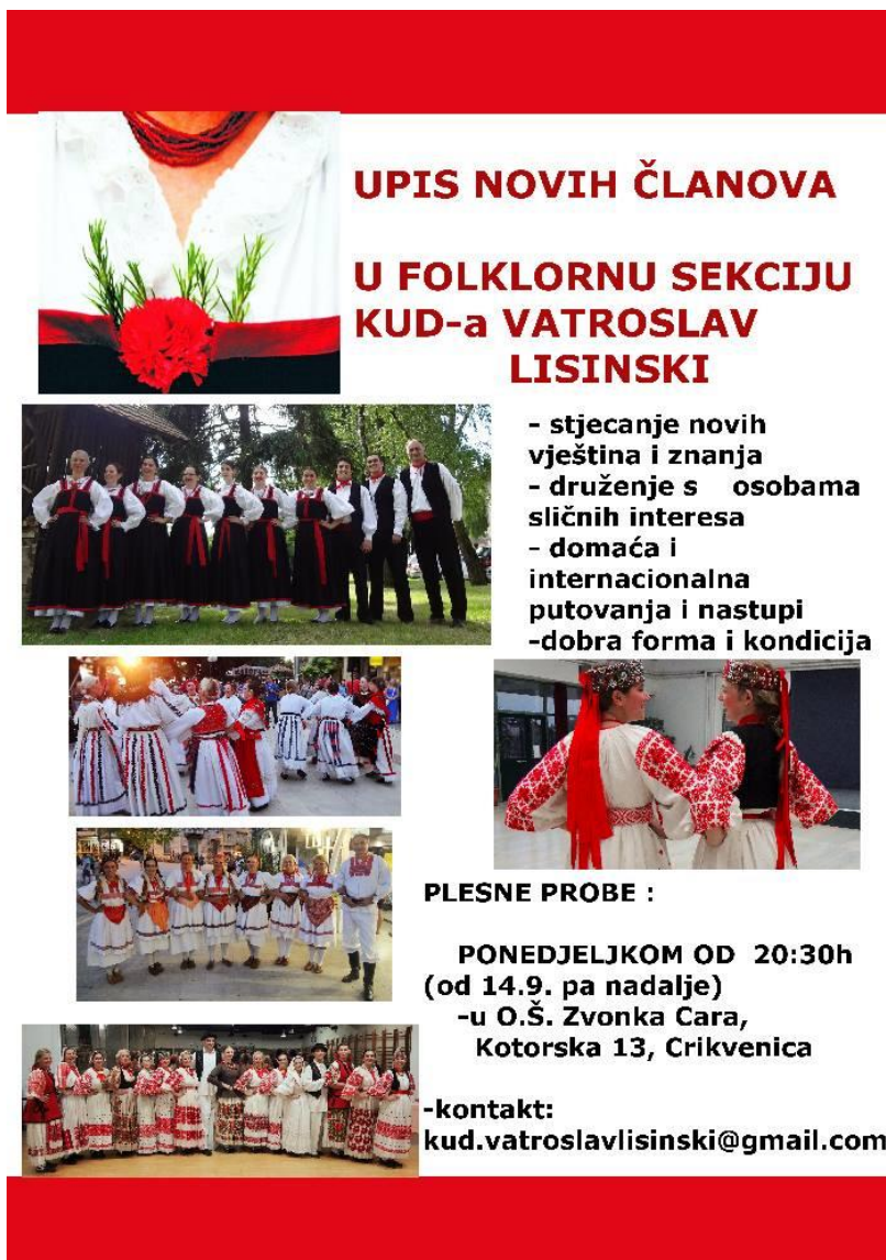
Slika 2: Promotivni letak KUD - a Vatroslav Lisinski za upis novih članova 5