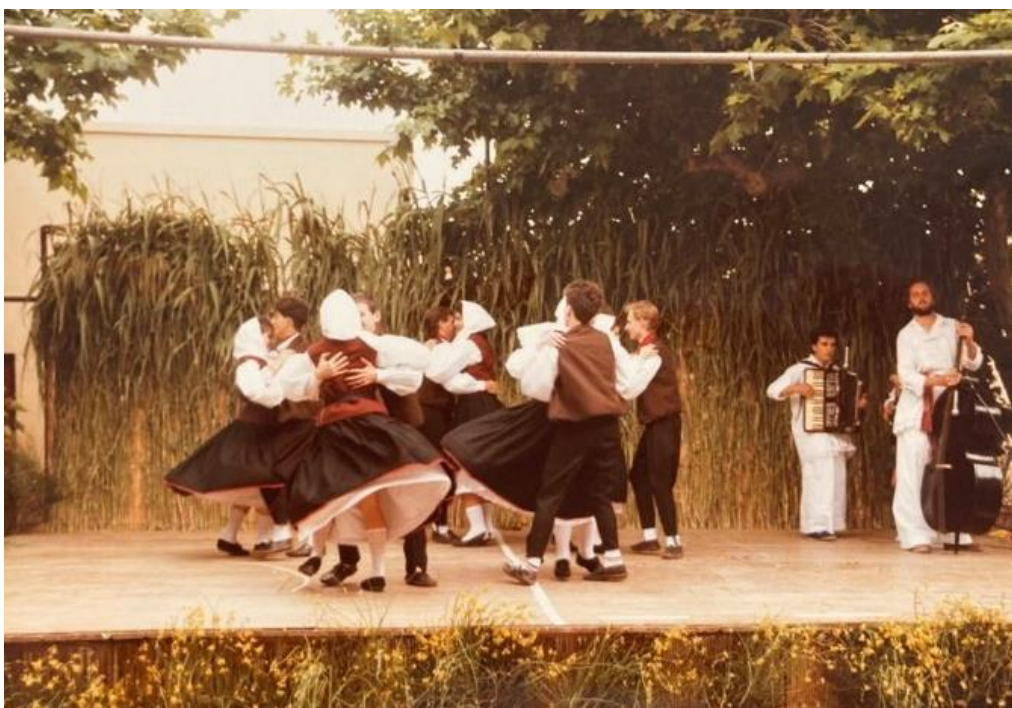
Slika 15: Nastup folklorne sekcije 1984.godine na gostovanju u Solliès Pont - u Francuskoj (poziv društva Lei Fenouie) 50