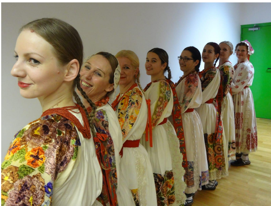
Slika 5: Članice folklorne sekcije u ženskoj posavskoj narodnoj nošnji nakon nastupa na 9. Smotri udruge u kulturi u Crikvenici 2016.godine 21

pjeva u isto vrijeme. „I ja jesam Posavačko dete“ je nešto lakši ples u šetanom kolu. Može se plesati u otvorenom ili zatvorenom kolu, a prati ga dvoglasno pjevanje uz pratnju tamburaškog sastava. Slijedi „Dućec“ koji je fizički zahtjevan ples zbog raznih varijacija skokova u zrak te izmjenjivanja nogu. Plesači su se ovim ovim plesom natjecali tko može više skočiti. Posljednji ples Posavine je „Kiša pada, Neven vene“. To je šetano kolo koje karakteriziraju razni oblici koraka, od šetnje i poskoka do drmeša. Ovaj je ples dinamičan i veseo. 20