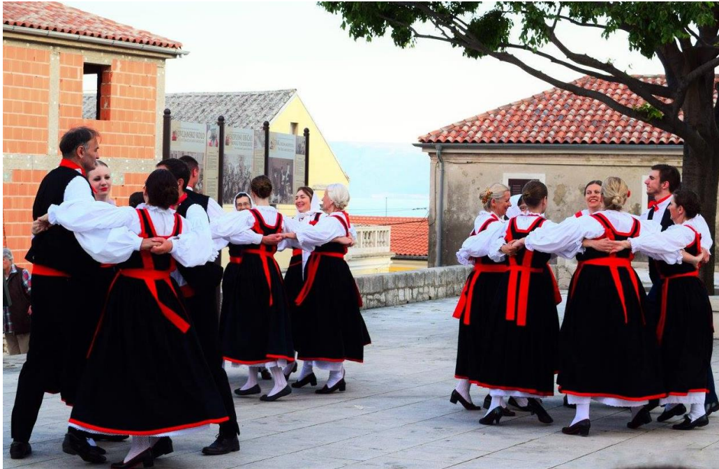
Slika 3: Nastup u Novom Vinodolskom 2016.godine. Izvedba posljednjeg dijela plesa Crikvenički tanci - Kolo po hrvatski 16