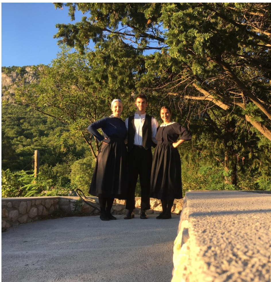
Slika 8: Članovi KUD – a u ražanskoj narodnoj nošnji nakon nastupa u Bribiru 2019.godine 26