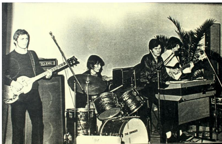
Slika 10: Vokalno - instrumentalni sastav „Galeb“ 1971.godine na nastupu 32