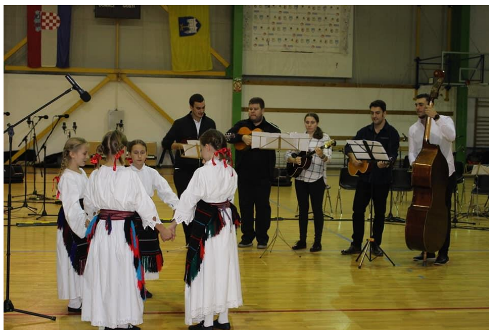
Slika 13: Nastup članica dječje plesno – scenske skupine na 11. Smotri udruga u kulturi u Crikvenici 2016.godine. Odjevene u slavonsku narodnu nošnju 40