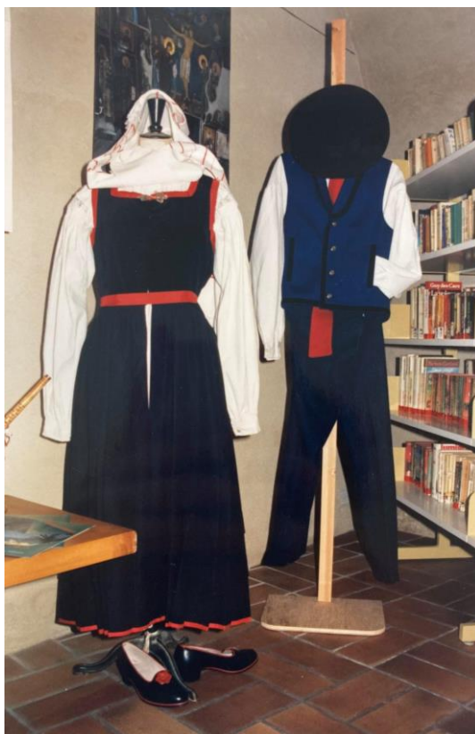
Slika 19: Muška i ženska Crikvenička narodna nošnja 57

Nošnja je nakon toga ostala tek u sjećanjima starijih ljudi prema kojima je stvoren opis crikveničke nošnje prema koje se danas šiva (Belobrajić i sur., 2012).