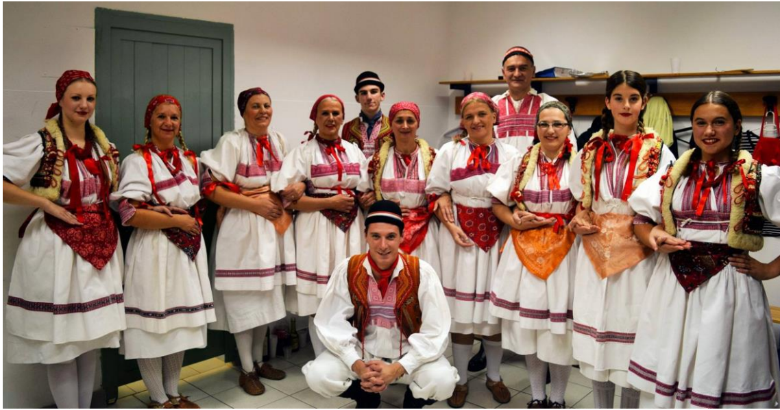
Slika 7: Članovi folklorne sekcije KUD - a Vatroslav Lisinski u prigorskoj narodnoj nošnji prije nastupa na 8. Smotri udruga u kulturi u Crikvenici 2016.godine 24

Na repertoaru KUD –a su i plesovi i pjesme iz Ražanca. Ražanac je poseban po dvoglasnom pjevanju, pleše se bez glazbene pratnje uz komande počimalje: „življe“, „opa“ i „stupčić“, a ritam se udara nogama. 25