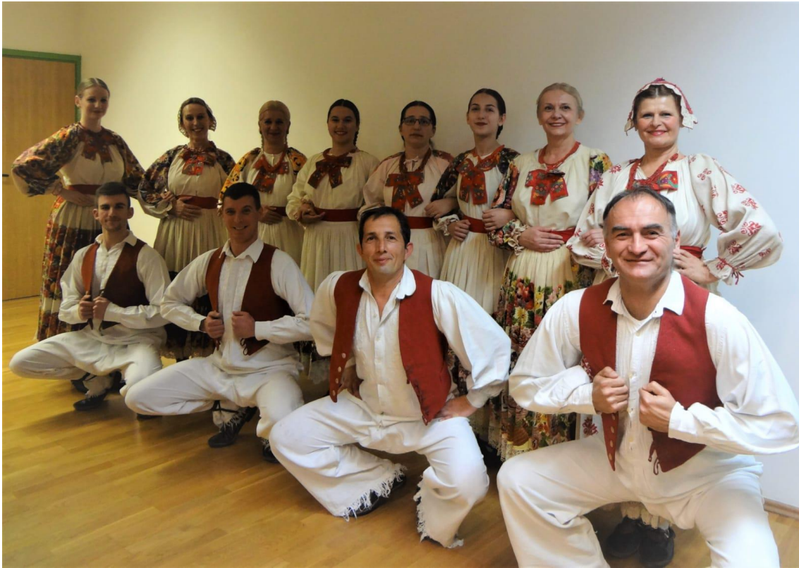
Slika 6: Članovi folklorne sekcije u posavskoj narodnoj nošnji nakon nastupa na 9. Smotri udruga u kulturi u Crikvenici 2016.godine 22

Pjesme i plesovi Prigorja još su jedan dio bogatog repertoara folklorne sekcije KUD - a. Ovi su plesovi odrednica područja oko grada Zagreba. Plešu se uglavnom u paru, trojkama, četvorkama i kružnicama. Koreografija folklorne sekcije započinje pjesmom „Po Prigorju rožice cveteju“ nakon koje slijedi „Drmačica“. U „Drmačici“ parovi stoje okrenuti jedno prema drugome držeći se za ruke te titrajućim koracima kreću lijevo i desno. „Kriči, kriči tiček“ je dinamičan ples titravog koraka koji se pleše u kolu i uz brze okrete parova uz poznatu pjesmu. Slijedi „Prigorska polka“ koja se pleše u paru u trokoraku. Posljednji je „Drmeš“ koji se pleše u kolu uz poskoke i brze vrtnje. „Drmeš“ se najviše plesao za vrijeme blagdana. 23