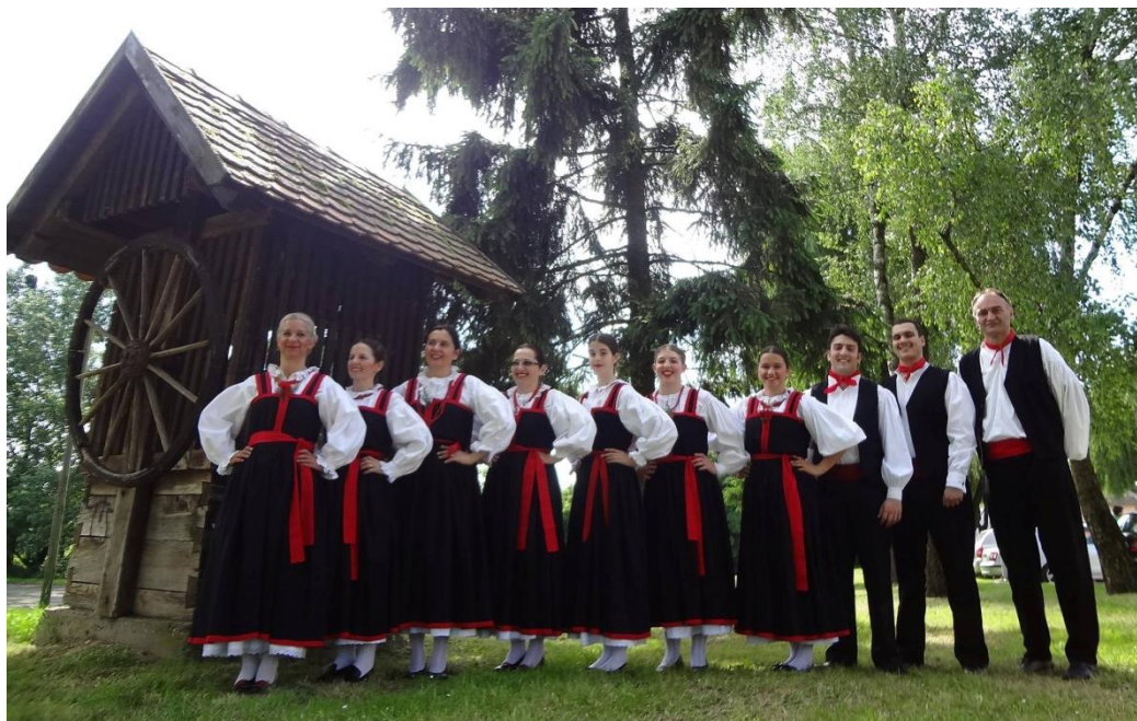
Slika 17: Članovi folklorne sekcije u crikveničkoj narodnoj nošnji u Kutini. KUD je 2015.godine sudjelovao na 35. Smotri folkloru Moslavine u Kutini 30.05.2015.godine 55