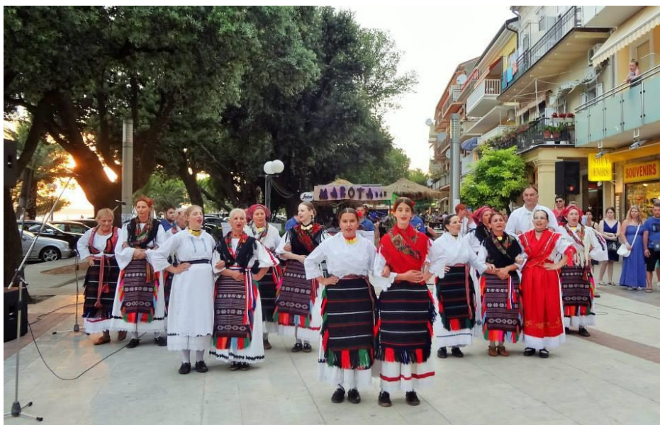
Slika 4: Članovi folklorne sekcije u slavonskoj narodnoj nošnji na nastupu ispred galerije u Crikvenici 2015.godine 19

Ples „Ajđ' za milim, ajđ' za dragim“ pleše se uz pjesmu na velikoj kružnici u hvatu prednjeg križa. Zatim slijedi „Povračanac“ koji se također pleše na kružnici. Karakteristika ovog plesa je kretanje u oba smjera uz pjesmu. Sljedeće je „Kolo“ koje je ujedno i najpoznatiji ples tog kraja. Prepoznatljiv je po dvoglasnom pjevanju. Počimalja započinje pjesmu bez muzike te joj ostali „odgovaraju“ uz muzikom. Teme pjesama, brojalice i pošalice proizlaze iz raznih životnih situacija. Posljednji ples je „Mista“ koji se pleše na mjestu ili se kreće po kružnici uz pjesmu 18