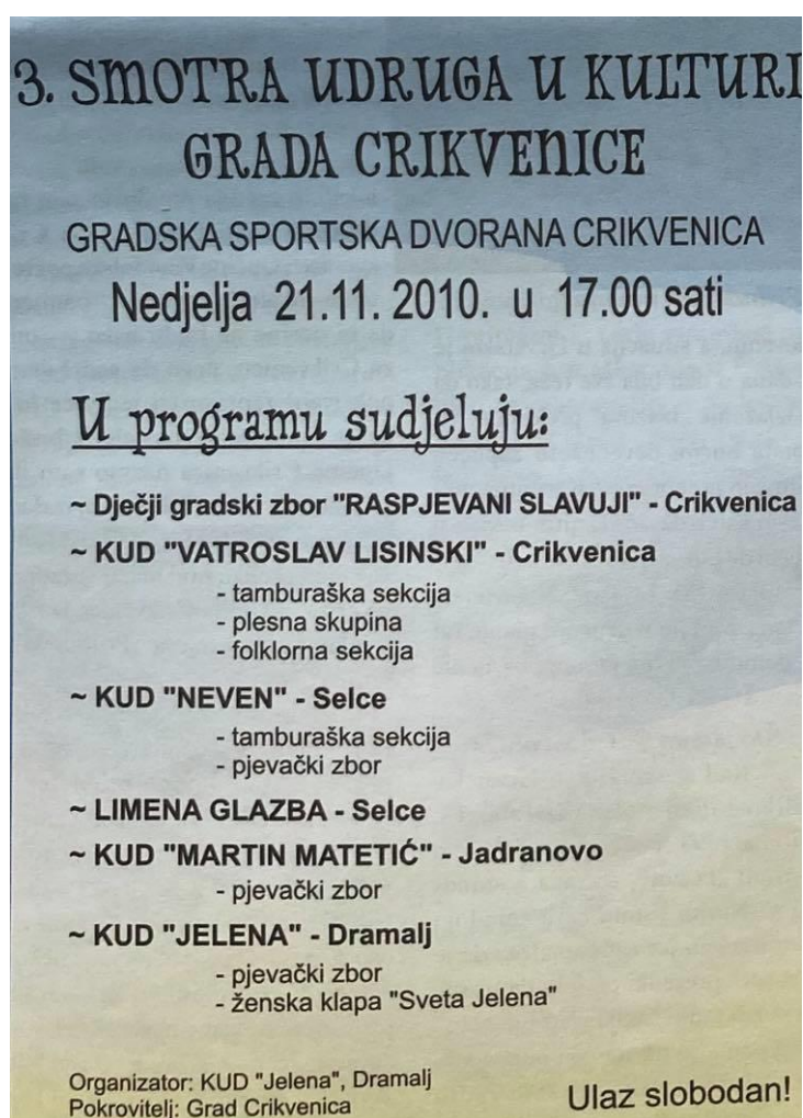
Slika 18: Letak za 3.Smotru Udruga u kulturi grada Crikvenice 2010.godine 56

Ovakva smotra prvi je puta održana u listopadu 2008. godine te je na njoj nastupilo čak 190 izvođača, a 2020. godine prvi se puta nije održala zbog epidemiološke situacije vezane uz covid - 19.