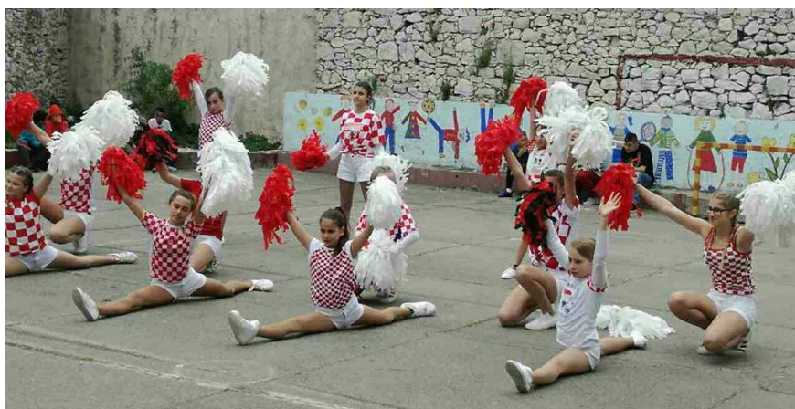
Slika 12: Nastup dječje plesno - scenske skupine 2017.godine u Novom Vinodolskom povodom sportske manifestacije u organizaciji Centra Izvor Selce 39