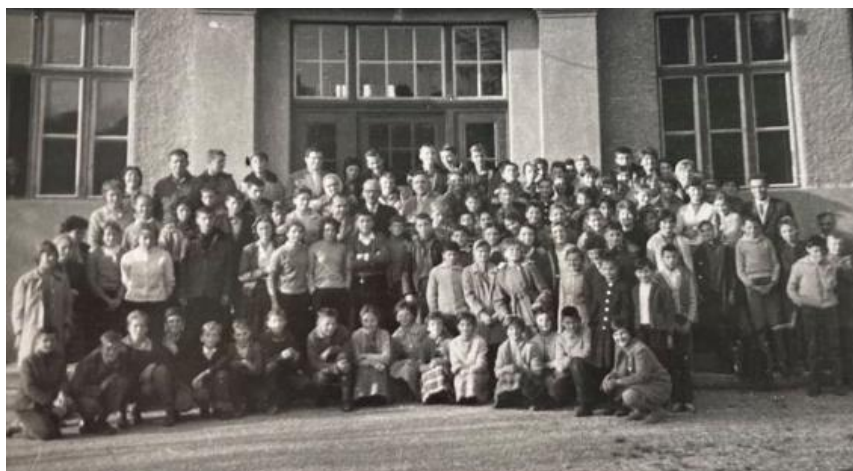
Slika 16: Posjet Gradišćanskim Hrvatima 1961. Zajedničko slikanje sa nastavnicima i učenicima glavne škole 51