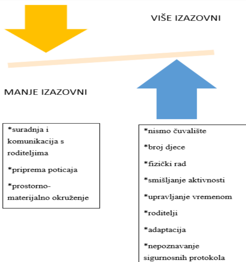
Prikaz 2. Rang izazova

Kao manje izazovne odgajateljice navode prostorno-materijalno okruženje: „...a najmanje izazovnije na primjer, prostorno-materijalno okruženje.“ (K.); kako i na koji način pripremiti poticaje: „I na kraju, nekako među lakšim bi izdvojila kako i na koji način poticaje pripremiti.“ (M.) te suradnju i komunikaciju s roditeljima koja obuhvaća odgovornost i očekivanja: „...na trećem mjestu ostaje suradnja i komunikacija s roditeljima.“ (S.), „Onda bih stavila na treće mjesto recimo odgovornost, intervencije odgajatelja da li previše, premalo.“ (D.) te „...očekivanja.“ (N.). Najizazovnijim dvije odgajateljice smatraju broj djece u skupini: „Am, najizazovniji je po meni možda broj djece...“ (N.); „Svakako, na prvom mjestu je broj djece u skupini jer je najvažnija sigurnost, na drugom prostorno-materijalno okruženje koje je svakako važan čimbenik koji svakako utječe na djetetov cjelokupni razvoj...“ (S.). Po jedna odgajateljica navodi sljedeće izazove kao najizazovnijima: shvaćanje roditelja da vrtić i jaslice nisu čuvalište: „...jedan od najvećih izazova- dokazati roditeljima da mi nismo samo čuvalište!“ (S.); fizički rad, smišljanje aktivnosti te upravljanje vremenom: „Možda po meni je najteže