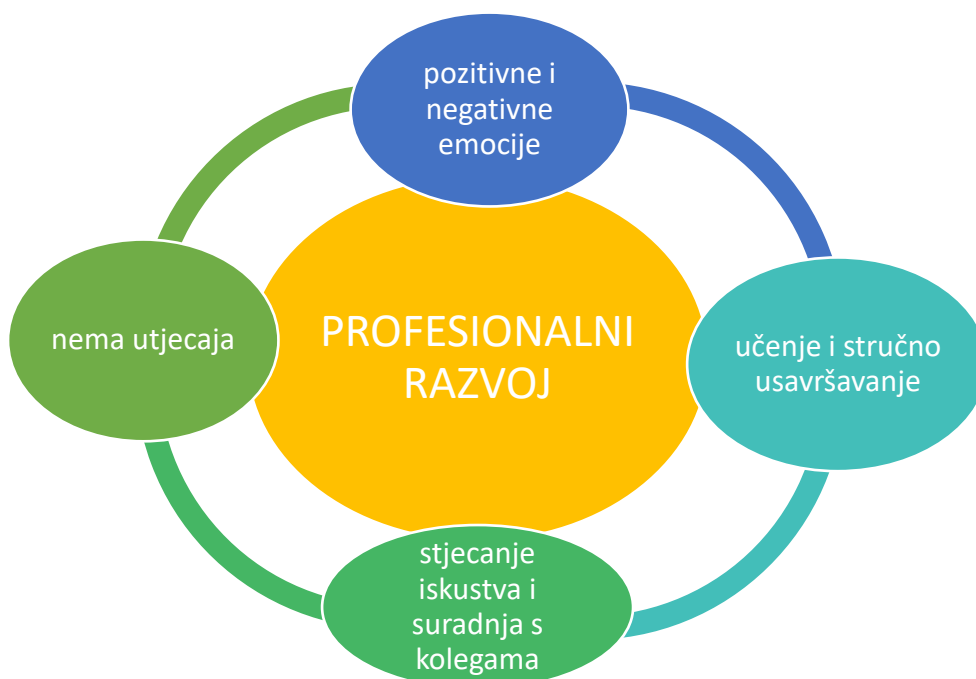
Prikaz 4. Utjecaj na profesionalni razvoj