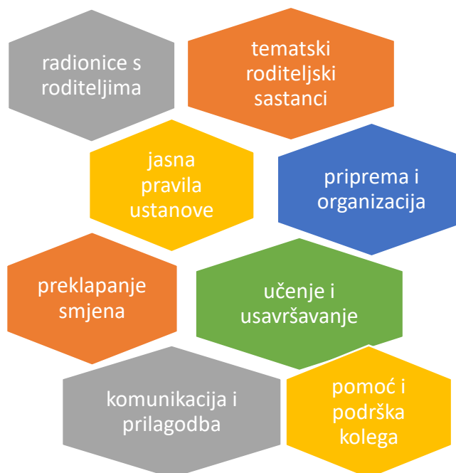
Prikaz 8. Rješenje/ realizacija izazova

Nakon što su gotovo sve odgajateljice istaknule kako je izazove svakako bolje realizirati, dublje se ušlo u sam proces realizacije te su odgajateljice nabrojale ideje i načine realizacije izazova (Prikaz 8).