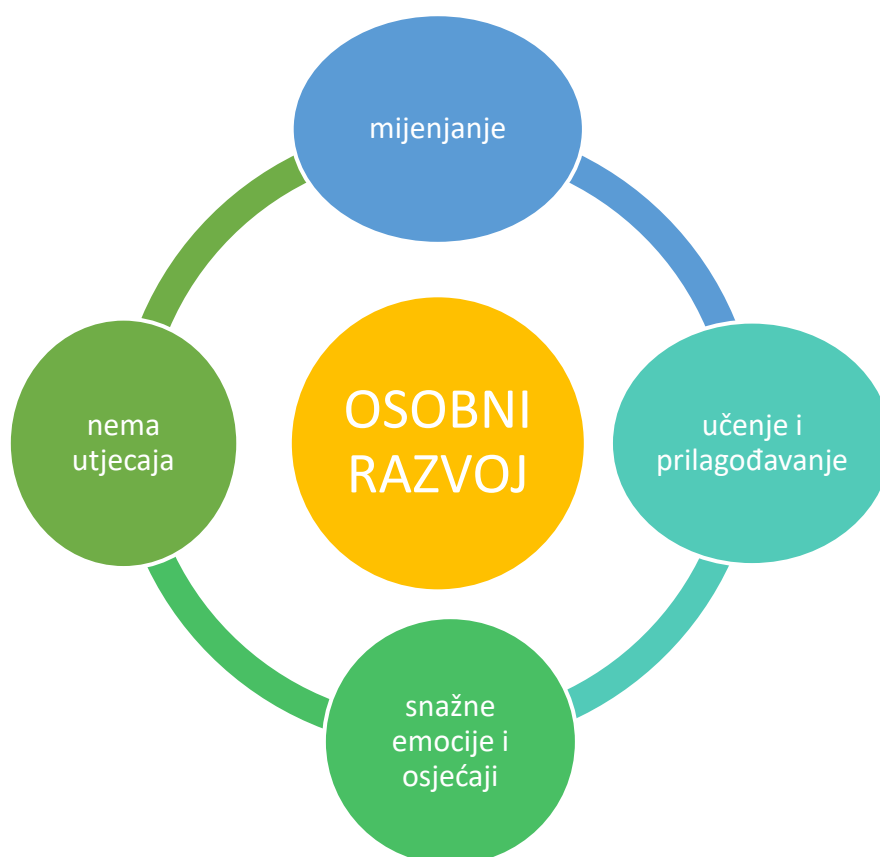
Prikaz 3. Utjecaj na osobni razvoj

Ističu kako je gotovo nemoguće odvojiti sebe i svoju osobnost od utjecaja posla stoga kroz same izazove uče, prilagođavaju se i razvijaju i osobno i profesionalno dok jedna odgajateljica kazuje kako nastoji izolirati svoju osobnost od utjecaja, detaljnije prikazano u Tablici 7.