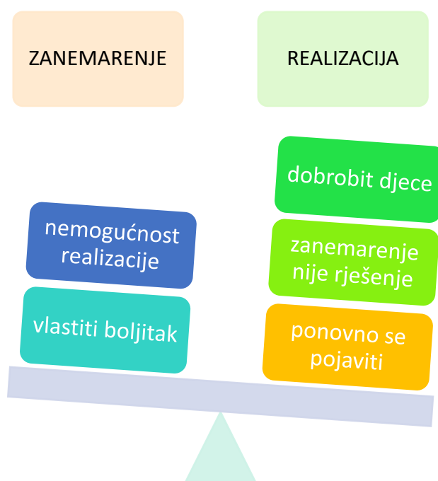
Prikaz 7. Nošenje s izazovima

Osam je odgajateljica istaknulo kako se s izazovima nose na način da ih nastoje realizirati: „Ako zanemaruješ da ipak su u pitanju djeca, da neke stvari se ne mogu se ignorirati jer se radi o dobrobiti djece. Tako da trebao bi realizirati, popraviti određene izazove i teškoće u radu.“ (K.); „Mislim da je bolje suočiti se sa izazovima i problemima u radu nego ih gurnuti pod stol jer će se uvijek vratiti, a sa kvalitetnom edukacijom i stalnim učenjem i radom na sebi, svi izazovi sa kojima se čovjek susreće, bili oni profesionalni ili osobni, postajati će sve manji i manji.“ (LC.), ali su se složile kako to nije uvijek baš lako: „Sa ovim izazovima nosim se teško. Bolje bi bilo realizirati nego zanemariti zbog boljitka djece, ali i mene kao profesionalca. Najčešće ih pokušavam riješiti na miran način uz komunikaciju, ali bezuspješno.“ (S.); „Pa normalno da rješavati koliko god da je to teško.“ (T.). S druge strane, dvije odgajateljice drže da je pojedine izazove bolje zanemariti što zbog toga što se jednostavno ne mogu realizirati, ali i zbog vlastita boljitka: „A kako koji. Ja uporno svoju kolegicu zanemarujem jer mi se ne da s njim bakcat. Takva je i eto takva je...“ (T); „Pa nešto moraš zanemariti kako biš sačuvao zdravu glavu, ali većinu toga se pokušava realizirati. To je najčešće u komunikaciji sa roditeljima. Da se neke stvari ne mogu promijeniti i da su ljudi takvi iako neke stvari prihvaćaju, opet rade po svome i ne možeš ti pomoć...“ (Me.), Tablica 13.