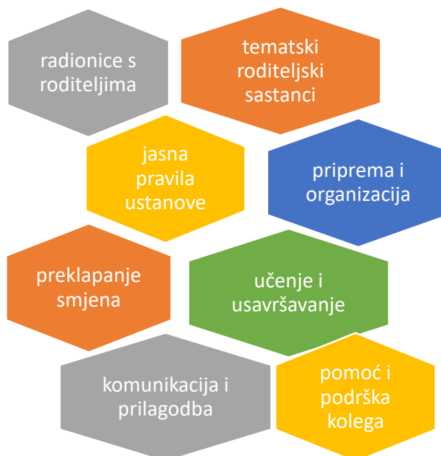
Prikaz 8. Rješenje/ realizacija izazova

Nakon što su gotovo sve odgajateljice istaknule kako je izazove svakako bolje realizirati, dublje se ušlo u sam proces realizacije te su odgajateljice nabrojale ideje i načine realizacije izazova (Prikaz 8).