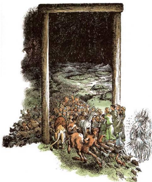
Slika 5: Posljednja bitka, ilustratorica: Pauline Baynes

su opisivali jednoroge u svojim zapisima opisivali su životinju nalik na nosoroga pa se smatra da su jednorogi ustvari indijski nosorogi. 7 U grčkoj mitologiji se spominju kao magarci s crvenim rogom na čelu, veličine konja te bijelog tijela s ljubičastom glavom. Prema mitovima, jednoroga se može uloviti jedino ako se pred njega baci djevica. Tada on položi glavu na njezino krilo, a ona mu zaveže uzde oko glave. U pojedinim biblijskim pjesmama može se pronaći kako se spominje biće re'em koje podsjeća na jednoroga. U Bibliji jednorog predstavlja alegoriju na Isusa Krista koji je rastao u utrobi Djevice Marije te je uzdigao rog spasenja. Rog ujedno može značiti i vrstu instrumenta ili pak posudu odnosno kalež iz kojega je narod pio. Lewis je u fantastičnim pričama opisao jednoroge kao iznimno čista i dobra bića koja su se uvijek borila na strani Aslana. Dva najpoznatija jednoroga su Peterov jednorog, kojega je jahao u borbi protiv Bijele Vještice, i Jewel, koji je bio spašen od kralja Tirijana te je izuzetno poštovao i slijedio Aslana (Ford, 2005).