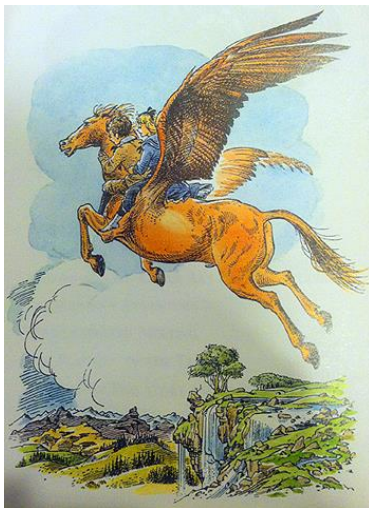
Slika 4: Pegaz Jagoda, ilustratorica: Pauline Baynes

kako bi na vrijeme odveo Digoryja i Polly u čarobni vrt kako bi ubrali jabuku za Aslana iz koje će kasnije izrasti stablo koje će štititi čitavu Narniju od Vještrice Jadis (Ford, 2005).