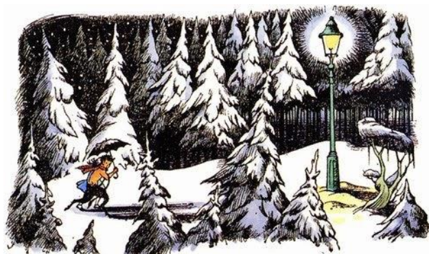
Slika 2: Lewisova vizija, ilustratorica: Pauline Baynes

U početku pisac nije imao ideju kako započeti priču, no u svojem djelu On Stories: And Other Essays on Literature (1982) navodi kako je sanjao lavove te se lik lava idealno uklapao u cijelu priču. Na osnovi tog lika uspio je napisati ostalih šest dijelova jednog od najpopularnijih serijala. Kada je imao četrdeset godina, uspio je napisati jedno poglavlje knjige inspiriran djecom koja su prisilno bila evakuirana iz Londona i veoma ugodno primljena i prihvaćena u Lewisovom domu za vrijeme Drugog svjetskog rata 1939. godine te je ostatak knjige pisao sve do 1949. godine (Lewis, 2005).