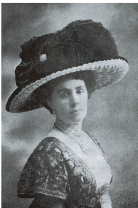
Slika 1: Ivana Brlić-Mažuranić

Njezina Knjiga omladini izlazi iste godine kad i ponovljeno izdanje Čudnovatih zgoda šegrta Hlapića . Također je u svojoj karijeri napisala Dječju čitanku o zdravlju , u koja je zbirka dječjih stihova. Zatim sređuje obiteljsku građu iz arhiva te ju naziva Iz arhiva obitelji Brlić u Brodu na Savi . Kasnije piše i Uvod k zbirci starih pisama 1848. – 1852 . Izuzev Priča iz davnine , o kojima više u sljedećem poglavlju, prevodi se i roman Čudnovate zgode šegrta Hlapića na češki jezik. Kasnije piše i dječji povijesno-pustolovni roman Jaša Dalmatin, potkralj Gudžerata , te se priprema za izdavanje njezine knjige Srce od licitara koja je objavljena tek nakon njezine smrti. Umire 21. rujna 1938. godine u Zagrebu (Zima, 2001, prema Fučkar, 2016).