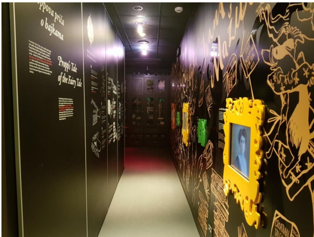
Slika 3: Stalna izložba Ivanine kuće bajke u Ogulinu

U sklopu Ivanine kuće bajke nalazi se i radionica, suvenirnica i biblioteka gdje se često održavaju razne aktivnosti povezane uz njezina djela. Raznim radionicama djecu se upoznaje s bajkama Ivane Brlić-Mažuranić i potiče se kreativno izražavanje kako bi djeca imala predodžbu nastanka njezinih djela.