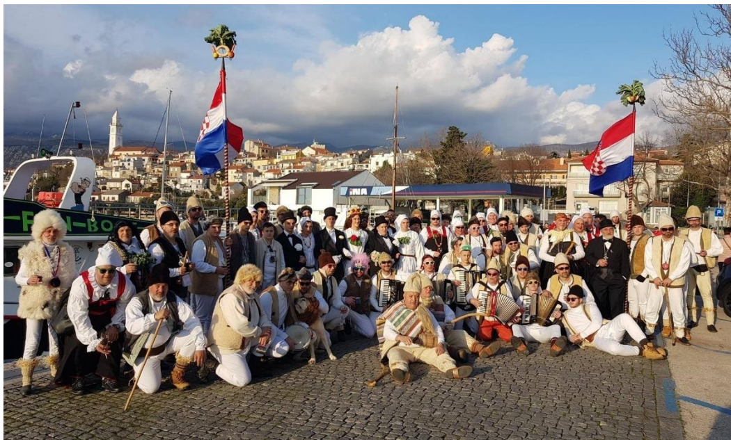
Slika 7. – Svi sudionici Mlade mesopustove 7

S prozora mladenkine kuće, vije zastava (hrvatska trobojnica), a mladoženjine svate dočekaju mladenkini te započinju pjesmu. Mladenka se u kući skriva, a ispred kuće se pije, pjeva i pleše na sopile. Debeli kum nastoji, pomoću roditelja, doći do mladenke. Kada mladenka izlazi van, cijela se svaća okreće prema njoj. Pri izlasku, svaća mladenki pjeva „ Kad se je hčerčica... “. Mladenka je odjevena u berhan ili svilenicu poput djevojaka koje plešu kolo, a ukrašene su s