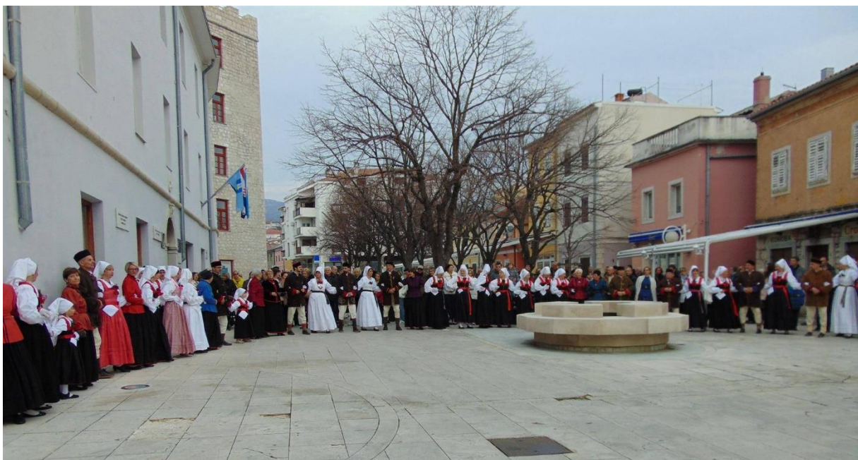
Slika 14. – Igranje novljanskog kola na Placi 14