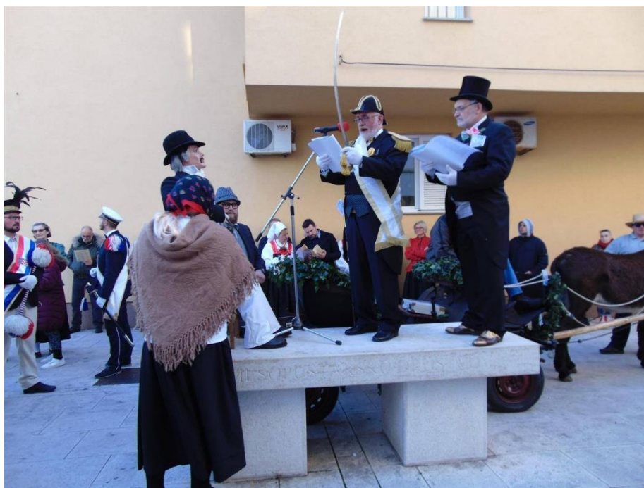
Slika 2. – Auditor i odvjetnik 2

Picimorti imaju zadaću da na drvenu stubu, okićenu bršljanom, polegnu mesopusta. Četiri picimorta nosi mesopusta na „Zatrep“. Njihova se odjeća sastoji od crnih frakova ili odijela, bijele košulje i rukavica bijele boje, crne leptir mašne i crnih cilindara. Na cilindrima s prednje strane svakome od njih se nalazi tablica bijele boje na kojoj pišu po dva slova crne boje, PI-CI-MO-RT. Oko lijeve nadlaktice nose traku od jutene vreće (juteni fijok), te tako pokazuju svoje žaljenje za mesopustom (Blažević, 2012).