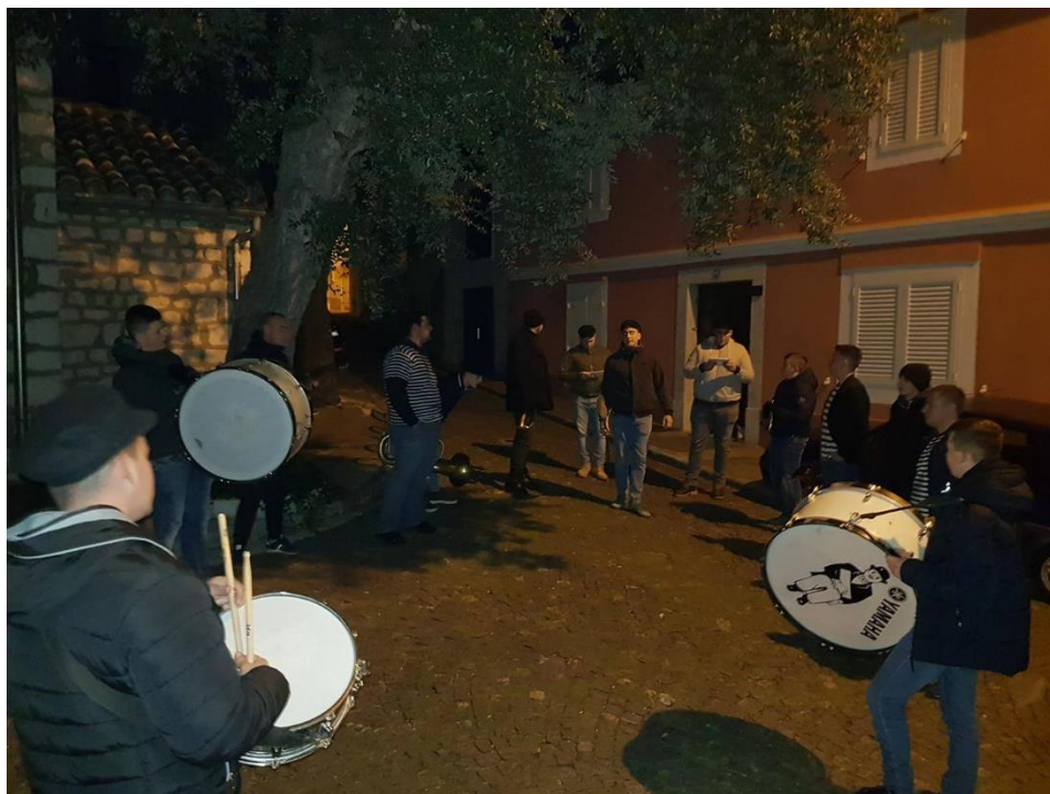
Slika 6. – Prvo napovidanje dovčen i dovican 6

Kada izlaze iz ulice Krasa, kapetani šire paradu i idu do ulaza u ulicu Šćedine te se tada muzika opet ubrzava. Tuče se do prvog raskrižja u Šćedinama, te tada advitor viče POZOR! Mesopustari jako paze da na Placu dođu točno u 22 sata. Od Place se kreće u Šćedine, točnije do prvog raskrižja gdje započinje Prvo napovidanje dovčen i dovican (Blažević, 2012).