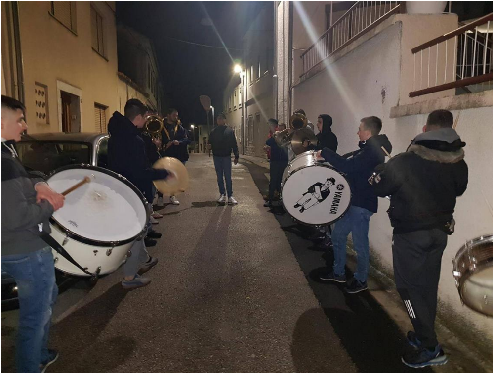
Slika 9. –Drugo napovidanja dovčen i dovican 9