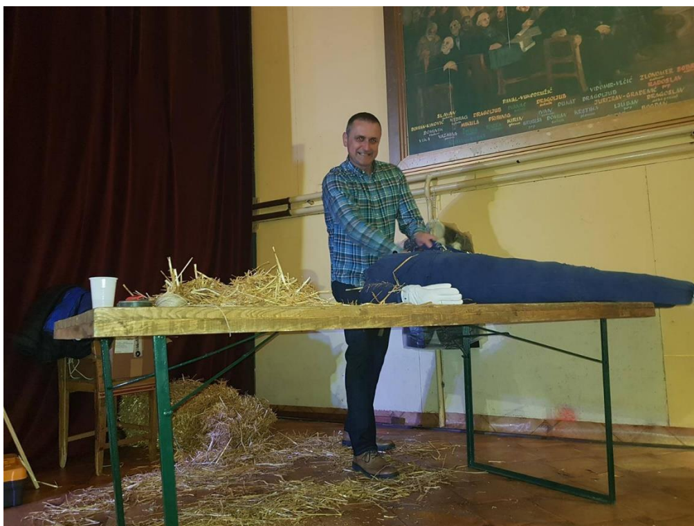
Slika 11. – Mišenje mesopusta 11

Mesopust se počinje mijesiti iza 21 sat, a mesopustari odlaze u mesopustariju. Dok se mijesi mesopust, pjevaju se pjesme i tuče se zoga . Mesopusta, nakon što ga odjenu, posjednu na kantridu te ga za kraj prekriju u kanu. Desna mu je ruka savijena u laktu na način da se na prsima nalazi bijela rukavica, a velika mu se cigareta stavlja između kažiprsta i srednjeg prsta (Blažević, 2012).