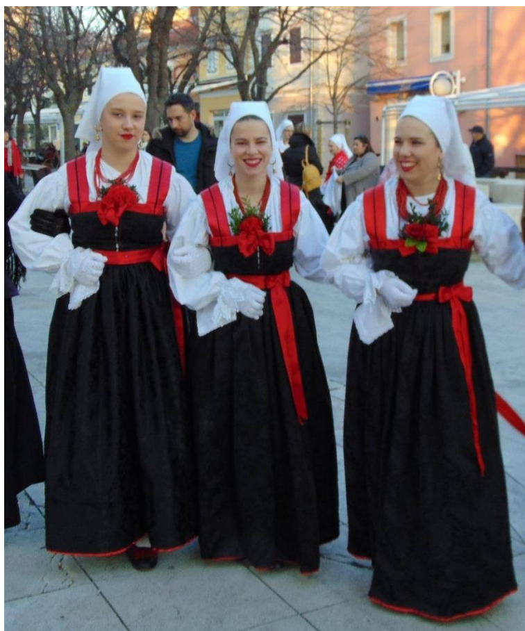
Slika 24. – Ženska narodna nošnja (svečana odjeća) 24

Berhan je bijela nošnja u kojoj je sve bijelo. Bijeli su kas, mezulanka, kiklja, košulja i rubac. Obrubljen je trakom od pamuka, plečićem . Berhan je napravljen od pikea (pamučni). Obično