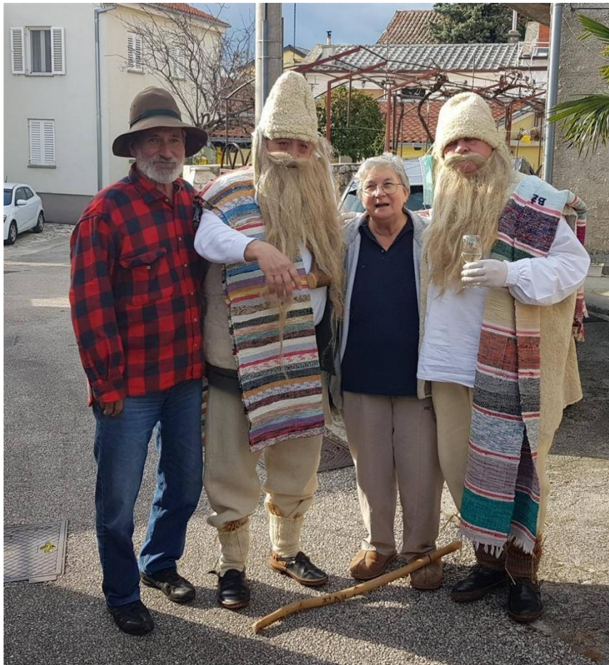
Slika 4. – Stari svati 4

Nadalje, uz mesopustare, veliku ulogu imaju i instrumenti mesopustara koje sačinjavaju udaraljke i puhački instrumenati (Blažević, 2012).