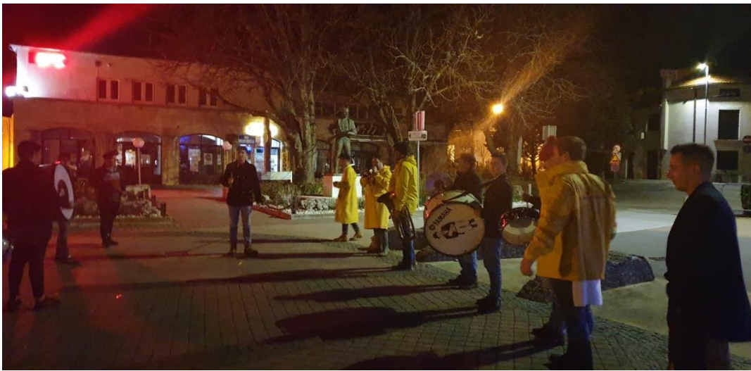
Slika 10. – Treto napovidanje dovcen i dovican 10