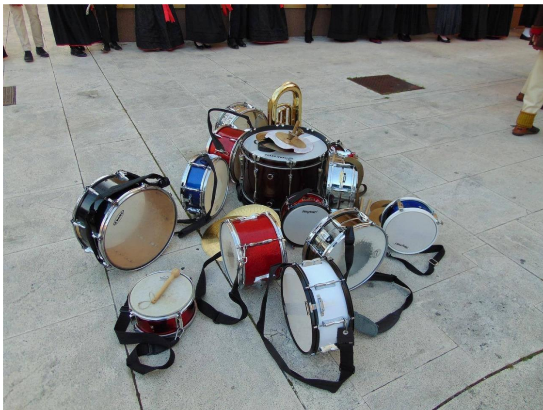
Slika 5. – Instrumenti novljanskih mesopustara 5