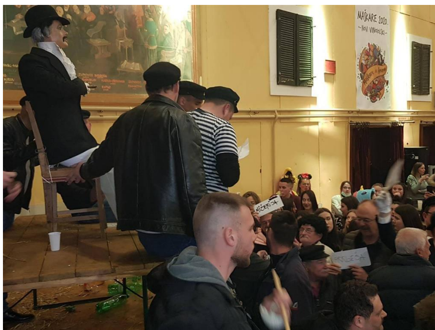
Slika 12. – Odabir imena mesopusta 12