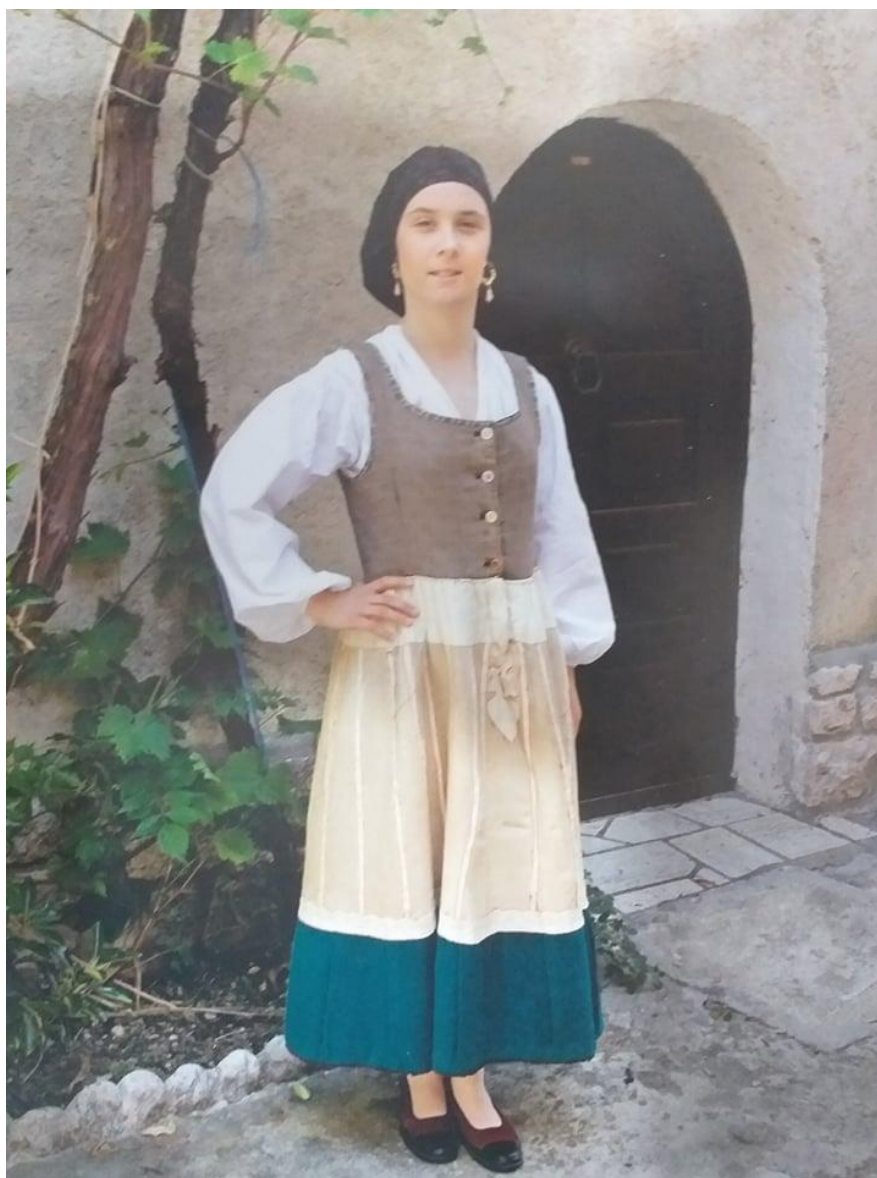
Slika 23. – Ženska narodna nošnja (radna odjeća) 23