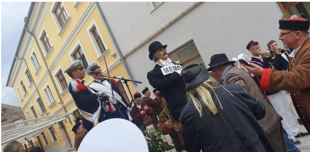
Slika 16. – Sudeње mesopustu 16

Prije svega, prvi auditorov posao je desnom rukom izvaditi, odnosno isukat sablju kako bi mogao pozdraviti. Poslije pozdrava se čita žitak koji je pisan u novljanskom govoru u osmercu,