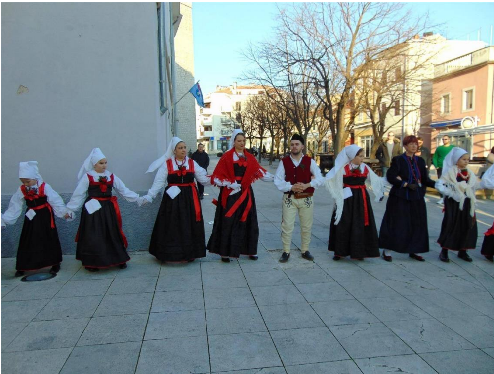
Slika 21. – Sudionici novljanskog kola 21