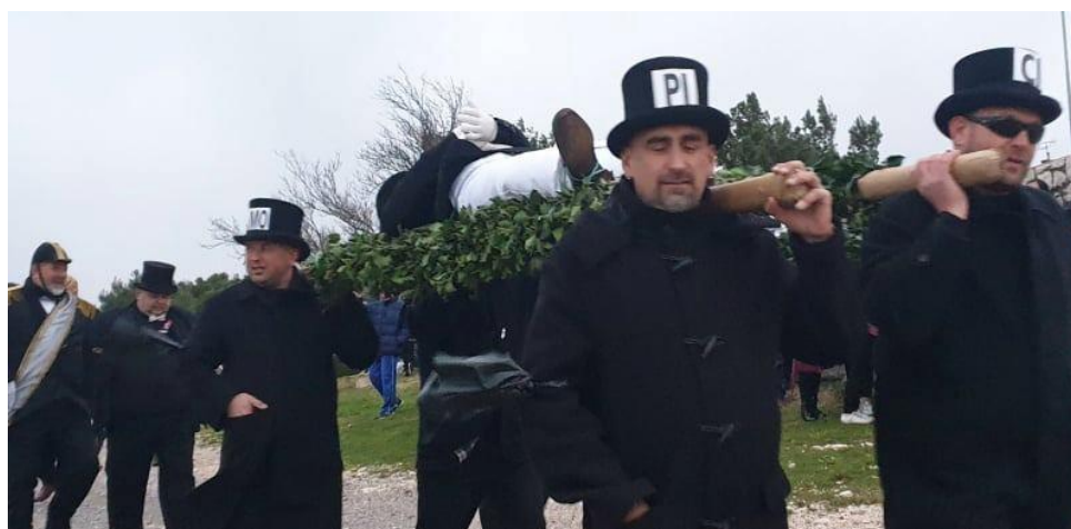
Slika 3. – Picimorti 3

Picimorti imaju zadaću da na drvenu stubu, okićenu bršljanom, polegnu mesopusta. Četiri picimorta nosi mesopusta na „Zatrep“. Njihova se odjeća sastoji od crnih frakova ili odijela, bijele košulje i rukavica bijele boje, crne leptir mašne i crnih cilindara. Na cilindrima s prednje strane svakome od njih se nalazi tablica bijele boje na kojoj pišu po dva slova crne boje, PI-CI-MO-RT. Oko lijeve nadlaktice nose traku od jutene vreće (juteni fijok), te tako pokazuju svoje žaljenje za mesopustom (Blažević, 2012).