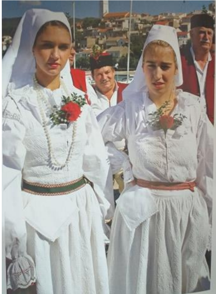
Slika 25. - Berhan 25

su ga odijevale djevojke koje su se udavale. Mladenka je na glavi nosila krunu koja je bila izrađena od cvijeća, bisernicu (Blažević, 2012).