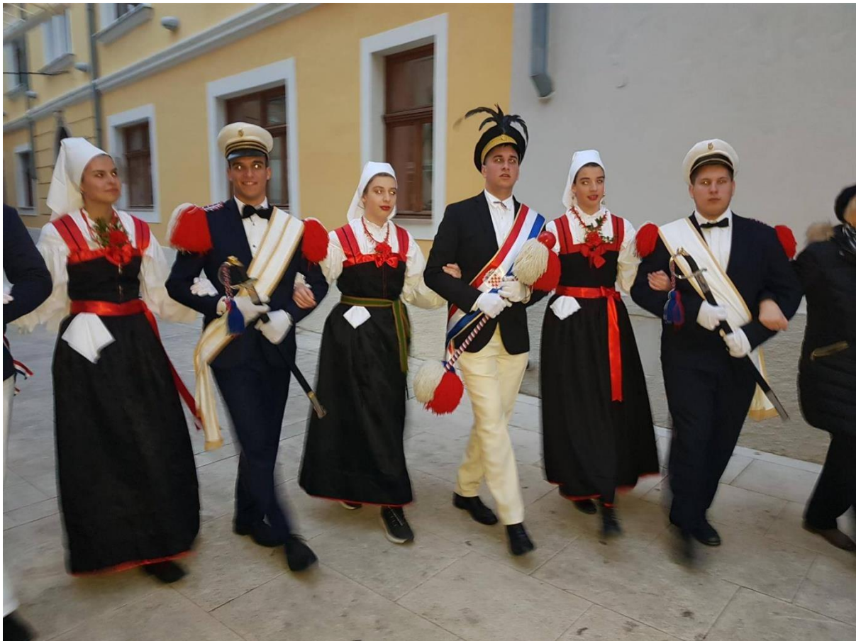
Slika 20. – Novljansko kolo 20

dvodijelna i trodijelna mjera. Korak je trodijelan. Pivač ima pauzu od dva stiha, no iako on ima pauzu, kolo se ne prestaje kretati. Nakon senjskog koraka, započinje arbanaški korak. Arbanaški korak ima jednake korake kao i senjski, ali njihova je razlika u melodiji. Mjera arbanaškog koraka je dvodijelna, a korak trodijelni (Sokolić-Kozarić, 1977). Arbanaškim korakom kolo postaje veselije, življe, brže (Sokolić-Kozarić, 1977). Posljednja je melodija puno življa, a mijenjaju se i koraci. Kolo se kreće na način da se lijevom nogom krene ulijevo, a desna se noga prebacuje preko lijeve. Idući korak započinje na način da se lijevom nogom krene unaprijed, a desnom se korakne unatrag (Sokolić-Kozarić, 1977).