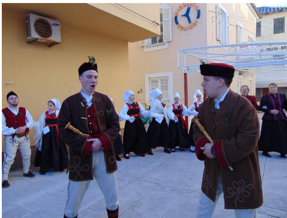
Slika 15. – Pivači novljanskog kola pjevaju dok se igra kolo 15