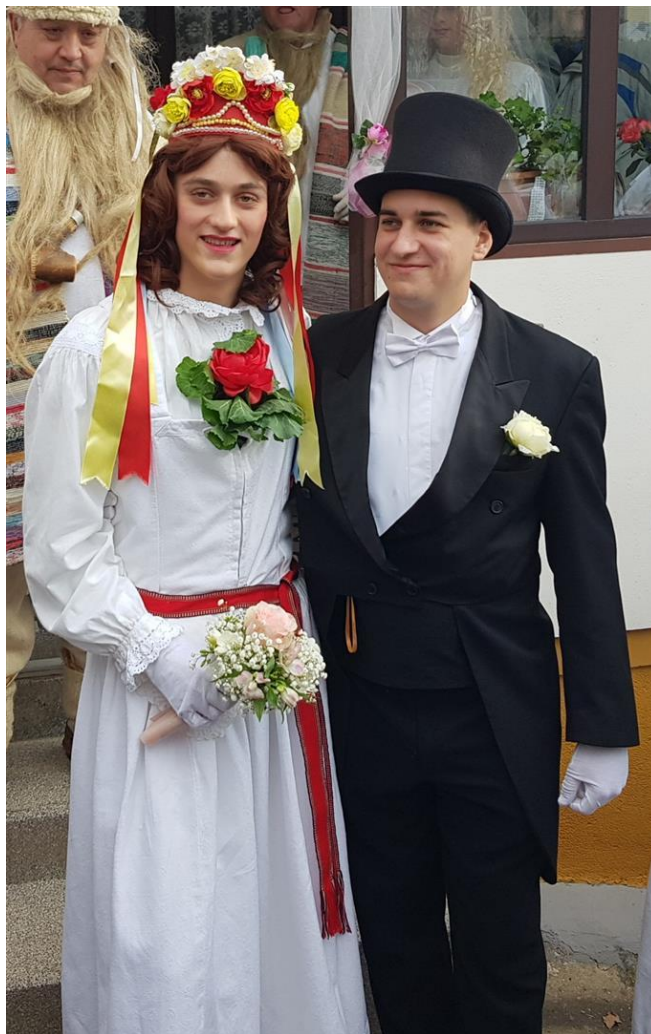
Slika 8. – Mlada i mladoženja 8

Bandiraši izlaze iz zamka, a sopilaši započinju svirat. Kumovi hvataju mladenku ispod ruku, a iza njih su dvije divice uhvatile mladoženju. Iza njih se nalaze soljače svaka sa svojim parom, pa svatovi po dvoje. Pirna kolona, uz svadbene pjesme, odlazi na zakon. Zakon se obavlja u jednoj gradskoj gostionici, a ne u crkvi. Danas je to u gostionici ispred Doma kulture, a u slučaju lošeg vremena, u Sali Doma kulture (Hirc, 1993).