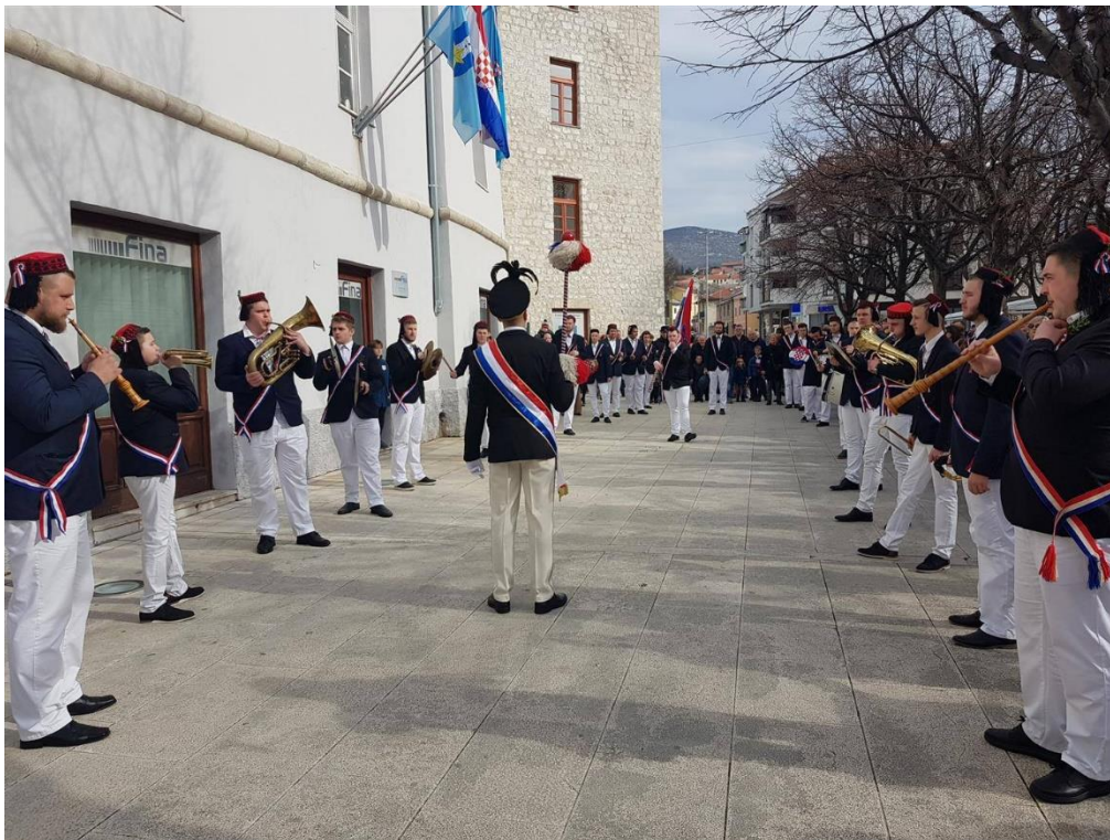
Slika 13. – Mesopustari pozdravljaju Grad Novi Vinodolski 13

Kapetani pozdravljaju institucije Grada, gradonačelnika, predsjednika Gradskog vijeća i sve zaposlene u gradskoj upravi. Nakon što pozdrave Grad, križaju se uz zogu te jedan red mesopustara naizmjenično prolazi kroz drugi red te uz pratnju muzike odlaze do Travice. Kada dođu ispod Travice, mesopustari se okreću prema mesopustu na način da ga gledaju licem (Blažević, 2012).