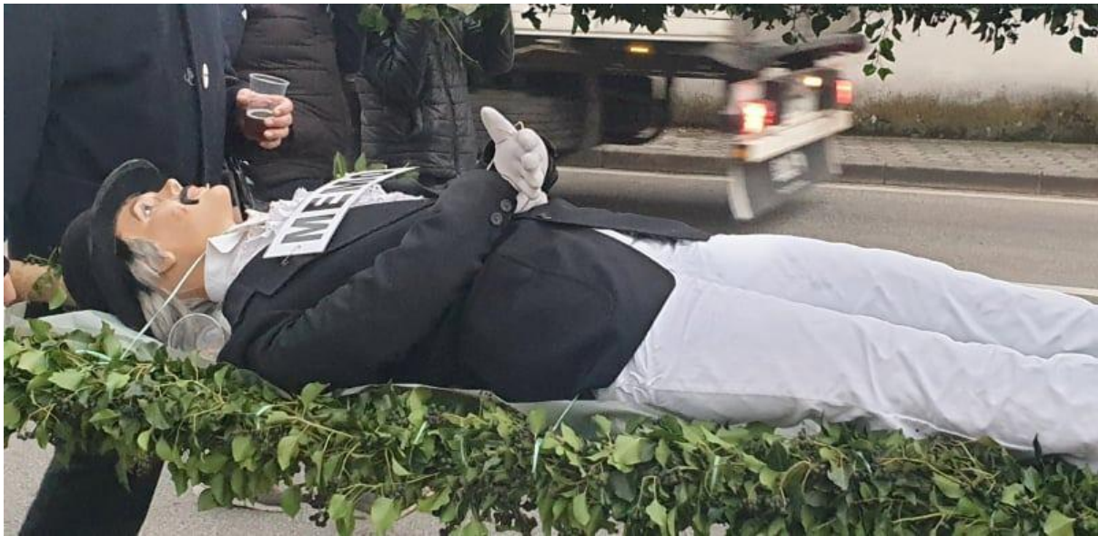
Slika 17. – Mesopust odlazi na spaljivanje 17

Oko 14 sati, dolaze mesopustari koji sviraju zogu za sprovod koja je najsporija te grad obilaze tri puta. Mesopustari grad obilaze dva puta bez mesopusta, a treći ga put picimorti nose polegnutog mesopusta na drvenim stubama koje su okićene bršljanom. Picimorti nose mesopusta ispred mesopustara (Blažević, 2012). Kada se mesopustari pojave na Placi četvrti put, idu prema kopriviću preko Place uz kaštel. Kada dođu do koprivića, picimorti i mesopustari se oko njega zavrte tri puta te se preko Place upute na Korzo. Na Korzu ih čeka kočija s auditorom, odvjetnikom, mandatorom i kočijašem što označava početak pogrebne povorke (Blažević, 2012).