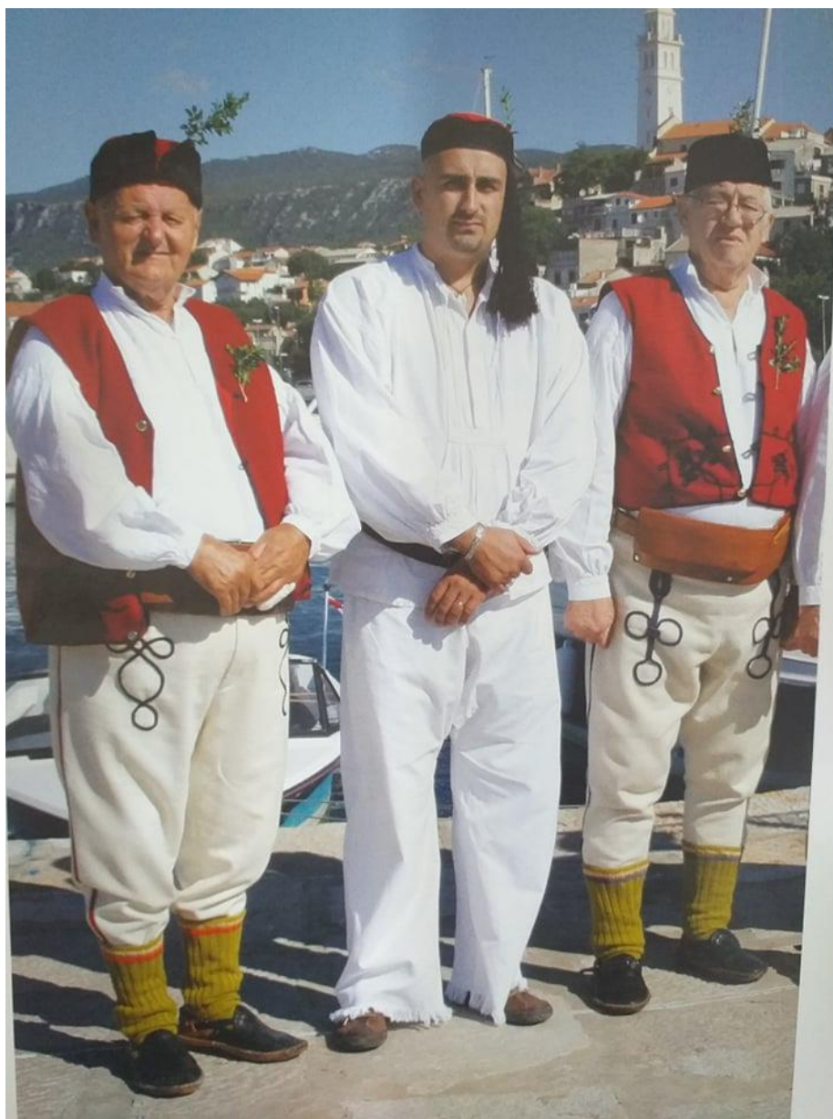
Slika 26. – Muška narodna nošnja; zimska (lijevo i desno) i ljetna ( u sredini) 26