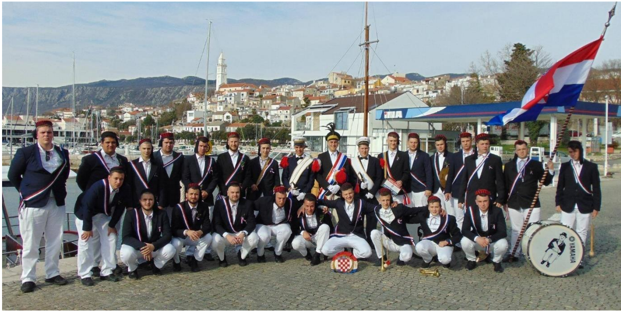
Slika 1. - Mesopustari 1

Auditor (sudac) nosi hlače crne boje te frak u istoj boji, bijelu košulju koja ima ovratnik te oko vrata crnu leptir mašnu. Ispod fraka, odnosno preko košulje nosi svileni prsluk (lajbek). Na ramenima fraka nalaze se zlatne epolete, a preko lijevog ramena mu se nalazi bijeli veo za svečane prilike (Blažević, 2012). U džepu od fraka nosi šipenicu (ružu) bijele boje ili list broskve. Nosi bijele rukavice na rukama, a s lijeve strane, za pojasom nosi sudačku sablju koja se naziva demeškinja. Nosi sudačku kapu koju s lijeve strane krase zlatni nakit (Blažević, 2012).