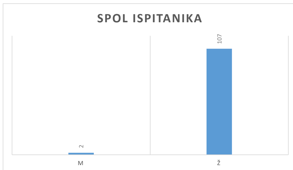
Slika 1. Raspodjela ispitanika prema spolu

Istraživanje je provedeno na uzorku od 109 odgojitelja, od toga 107 (98,17%) žena i 2 (1,83%) muškarca (Slika 1.).