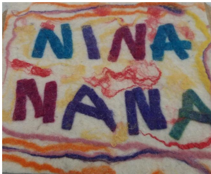
Fotografija broj 36 (autorski rad): Naslovna stranica slikovnice

Prisutne su tople i hladne boje te kontrasti (ptica i nebo). Na prvoj stranici prevladavaju žarke i tople boje prikazane valovitim neravnim tanjim i dužim linijama. Na zadnjoj stranici prevladavaju pastelne i hladne boje.