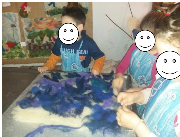
Fotografija broj 13 (autorski rad): Slaganje vune u boji na bijelu vunenu plohu prilikom izrade posljednje stranice slikovnice