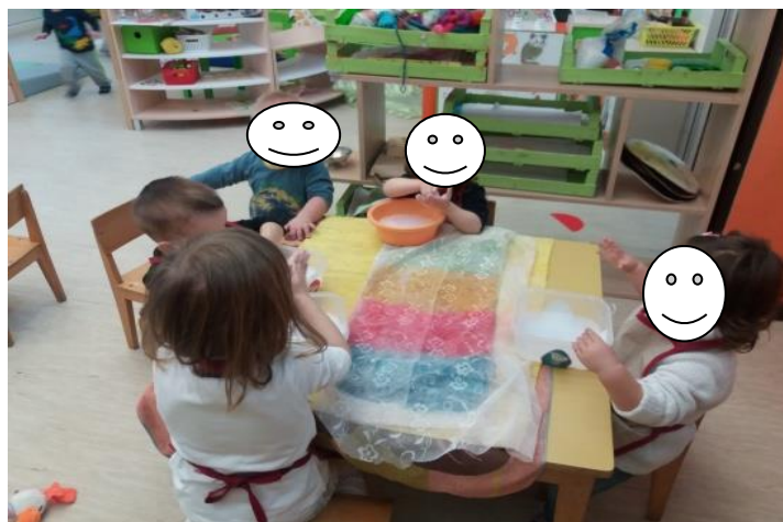
Fotografija broj 30 (autorski rad): Pticu treba oživiti