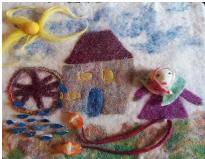
Fotografija broj 38 (autorski rad): Druga stranica u slikovnici