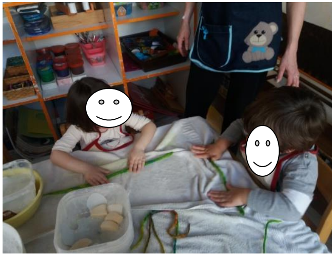
Fotografija broj 35 (autorski rad): Vrijedne ruke skupine „Loptice“