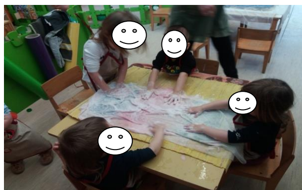
Fotografija broj 17 (autorski rad): Utiskivanje dlanova, prstiju i šaka pri likovnom oblikovanju vunom u izvođenju skupine „Pužići“