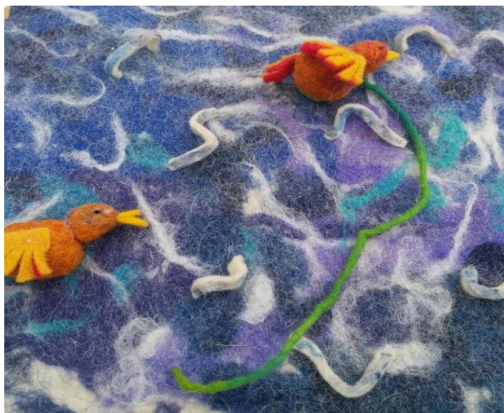
Fotografija broj 40 (autorski rad): Posljednja stranica slikovnice