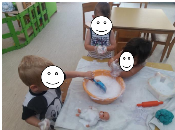
Fotografija broj 25: Zabava s mjehurićima