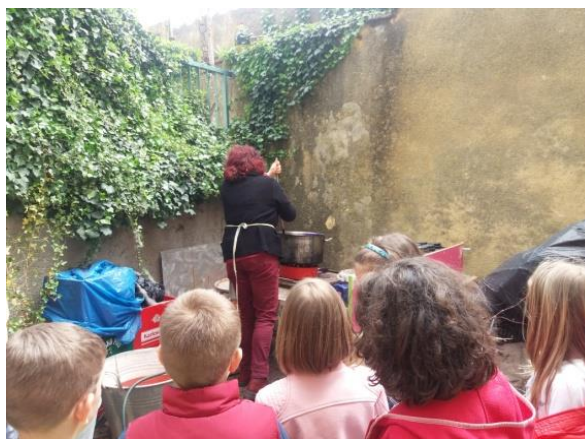
Fotografija broj 4 (autorski rad): Stavljanje vune na štrik