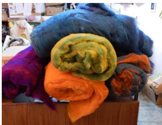
Fotografija broj 7: Priprema materijala za izradu stranica