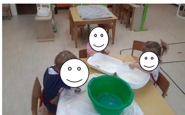
Fotografija broj 26 (autorski rad): Namakanje kuglica toplom sapunicom