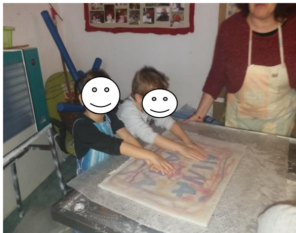
Fotografija broj 15 (autorski rad): Stavljanje rupičaste tkanine na složenu sliku u Sobi dnevnog boravka skupine „Pužići“