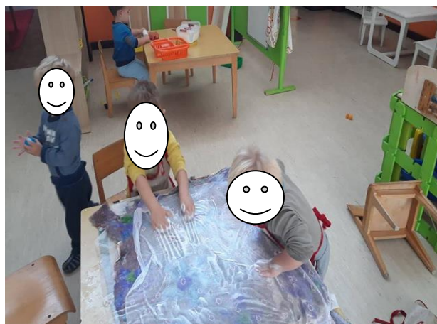
Fotografija broj 20 (autorski rad): Iskustveno učenje kroz igru