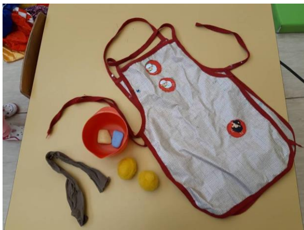
Fotografija broj 23 (autorski rad): Priprema materijal za izradu okruglog oblika - ptice

Krila i rep ptice izrađeni su istim načinom izrade kao i stranice slikovnice. Dobiveni komad filca izrezuje se u željeni oblik kako bi nalikovalo krilima i repu. Krila i rep priljepljuju se vrućim ljepilom ili ušiju debljom iglom. Tako prilijepljena ili ušivena režu se na trakice kako bi se dobio volumen i pokret istih. Na isti način dobijemo se maramu bake i kapljice vode.