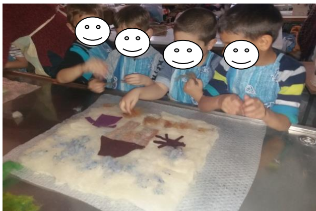
Fotografija broj 11 (autorski rad): Slaganje vune u boji na bijelu vunenu plohu prilikom izrade treće stranice slikovnice