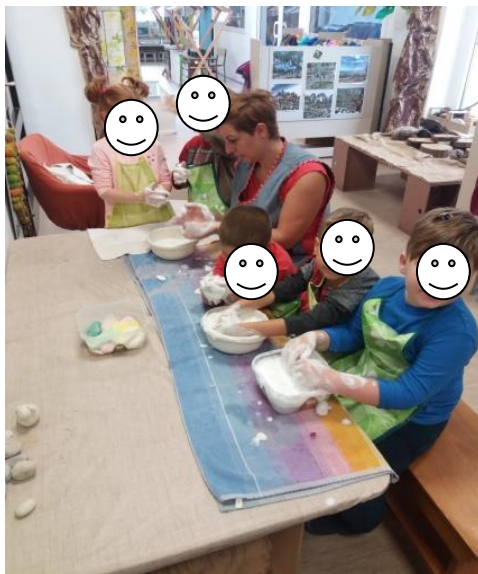
Fotografija broj 9 ( autorski rad): Slaganje vune u boji na bijelu vunenu plohu prilikom izrade naslovne stranice slikovnice