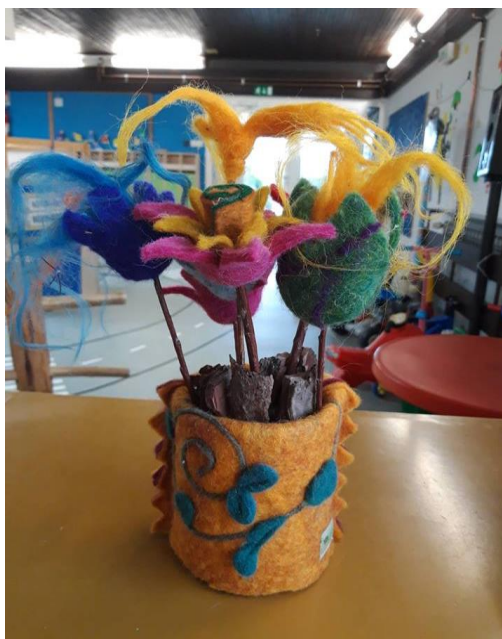
Slika broj 45 (autorski rad): Moj grad