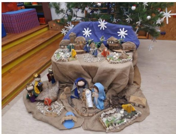
Slika broj 41(autorski rad): Jaslice od filca