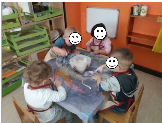
Fotografija broj 33 (autorski rad ): Trljanje trakica dlanovima