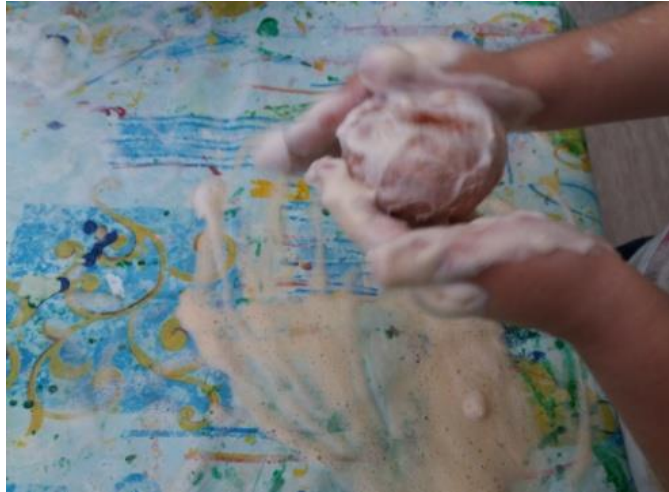
Fotografija broj 28 (autorski rad): Oblikovanje vunom dlanovima