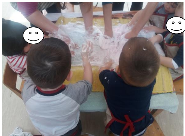
Fotografija broj 16 (autorski rad): Utiskivanje dlanova, prstiju i šaka pri likovnom oblikovanju vunom u izvođenju skupine „Loptice“