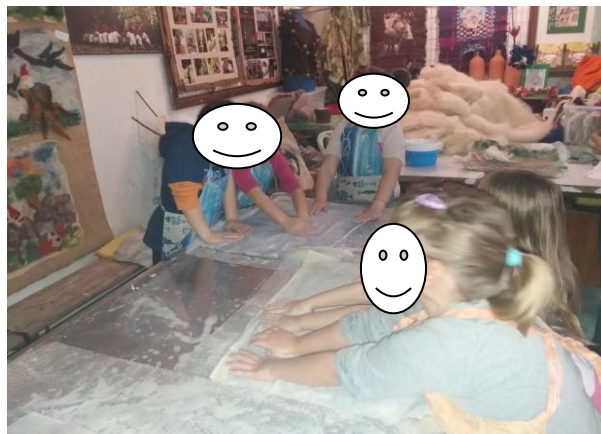
Fotografija broj 19 (autorski rad): Istraživanje djece najranije dobi