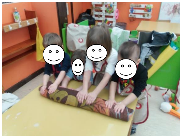
Fotografija broj 22 (autorski rad): Suradničko učenje