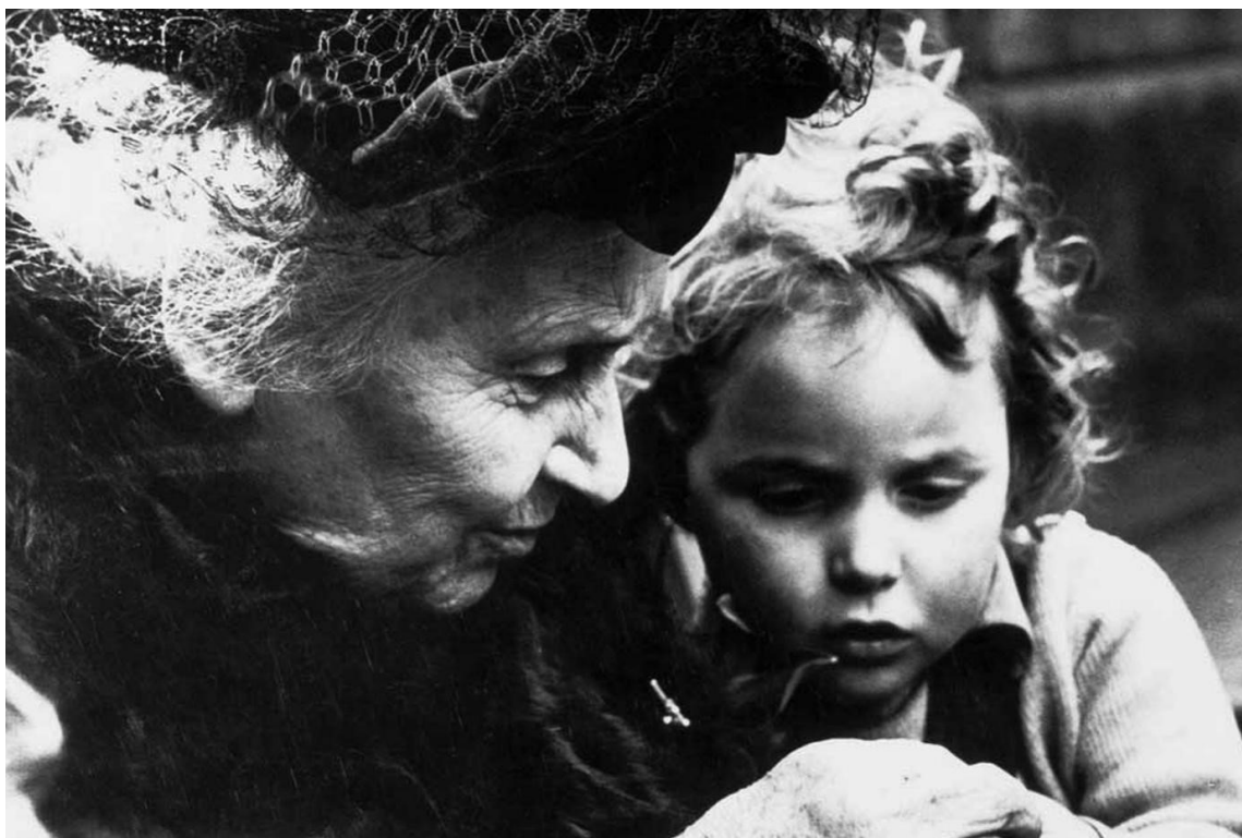
Fotografija 2.: Maria Montessori

U Rimu je 1907. godine otvorila dječju kuću "Casa dei bambini" za djecu između dvije i šest godina. Nadgledajući rad dječje kuće zaključila je da su materijali koje je ranije koristila u psihijatrijskoj klinici, ubrzali učenje djece urednog razvoja. Dječja kuća postaje sve posjećenija od zainteresiranih osoba, a Maria (Fotografija 2.) pomaže u osnivanju novih kuća.