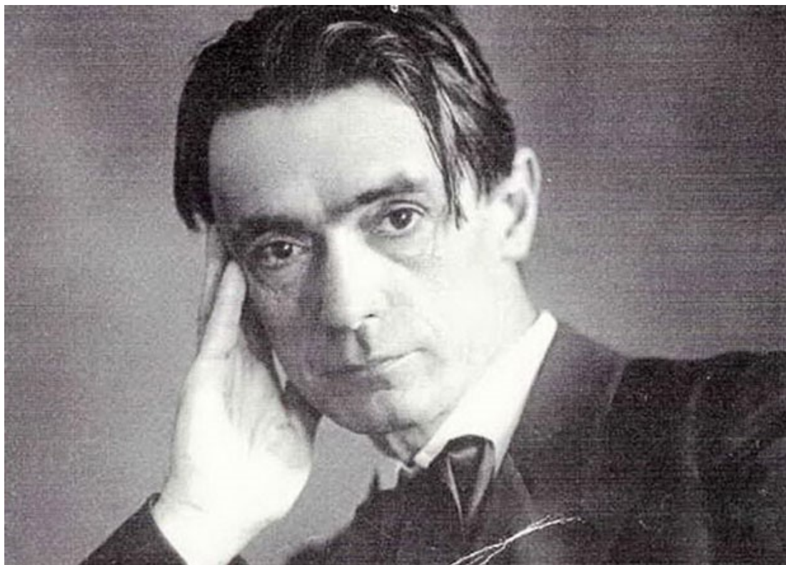
Fotografija 1. Rudolf Steiner