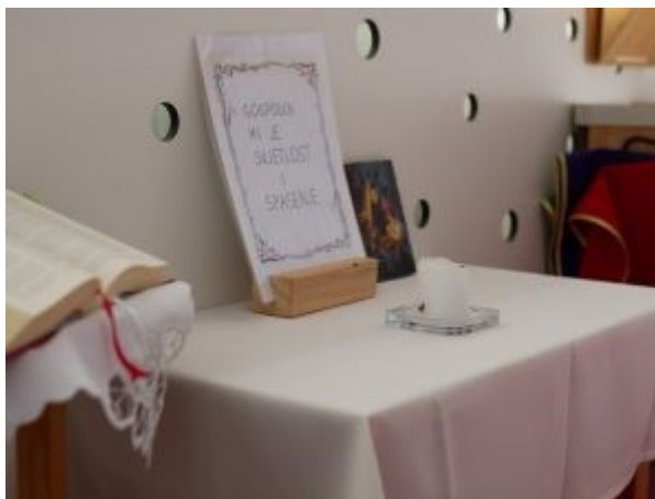
Fotografija 4. Kutić za molitvu

Kutić za molitvu (Fotografija 4.) odražava liturgijsko razdoblje sa svojim prikladnim liturgijskim bojama, svijećama, pjesmom i molitvom, čitanjima koja obrede i svečanosti liturgijskog vremena čine intenzivnijim (Đuzel, 2006).