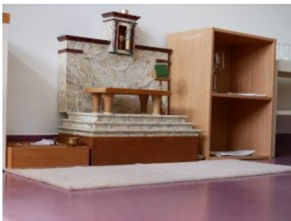
Fotografija 3. Kutić za sv. Misu

Katehetsko-didaktička sredstva također imaju obilježja Montessori materijala. Katehetsko-didaktička sredstva se sastoje od konkretnih predmeta koji su uvijek na dostupnom i stalnom mjestu, kako bi ih djeca uzimala kada žele i koristila koliko dugo žele. Vrlo su jednostavna i vezuju se s biblijskim i liturgijskim sadržajima. Ona djeci služe kao pomoć kako bi steklo neovisnost o kateheti - odgojitelju u vjeri. Nisu pomoć za učenje već za vjerski život. Potiču ga da se samo zaustavi nad onim što mu je kateheta posredovao i tako si omogući dublji unutarnji doživljaj. Potiču ga na osobnu aktivnost, a to može biti meditacija i kontemplacija. Pri izradi katehetsko-didaktičkih sredstava odgojitelja/ica u vjeri ne smiju voditi osobni interesi i osjećaj pobožnosti koji je njemu/oj vrijedan kako bi se izbjeglo nametanje djetetu (Đuzel, 2006).