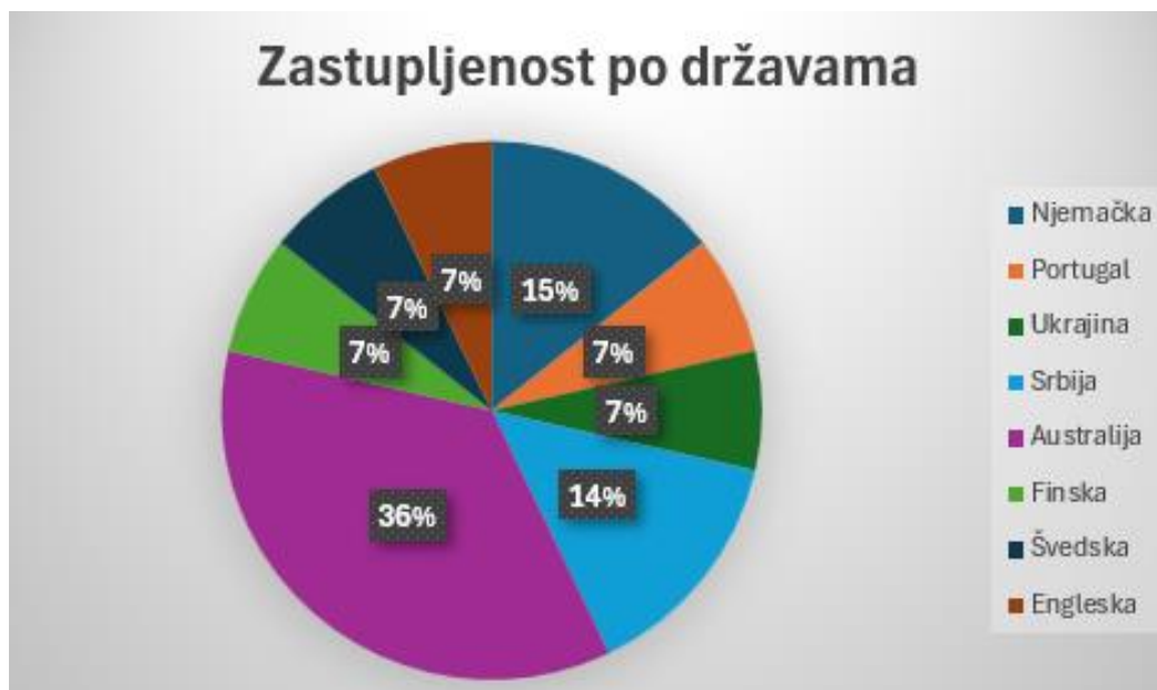
Grafikon 1: Zastupljenost po državama

Recentni radovi i istraživanja prikazuju postojeći interes za istraživanje kvalitete Ranog i predškolskog odgoja i obrazovanja, mogućnosti profesionalnog razvoja odgajatelja, kvalitete obrazovanja odgajatelja, izazove u radu, dobrobit odgajatelja. Pregledom recentnih radova došlo se do trenutnih spoznaja o praksi odgajatelja te mogućnosti unapređenja prakse. U ovome radu izdvojeno je četrnaest relevantnih istraživanja o navedenoj tematici. S obzirom na vrstu istraživanja, najzastupljeniji bili su empirijski radovi, a promatrajući države gdje su recentni i relevantni radovi nastali, može se utvrditi da se približno jednako o tematici istražuje u različitim dijelovima Europe no najviše se istražuje u Australiji (Grafikon 1).