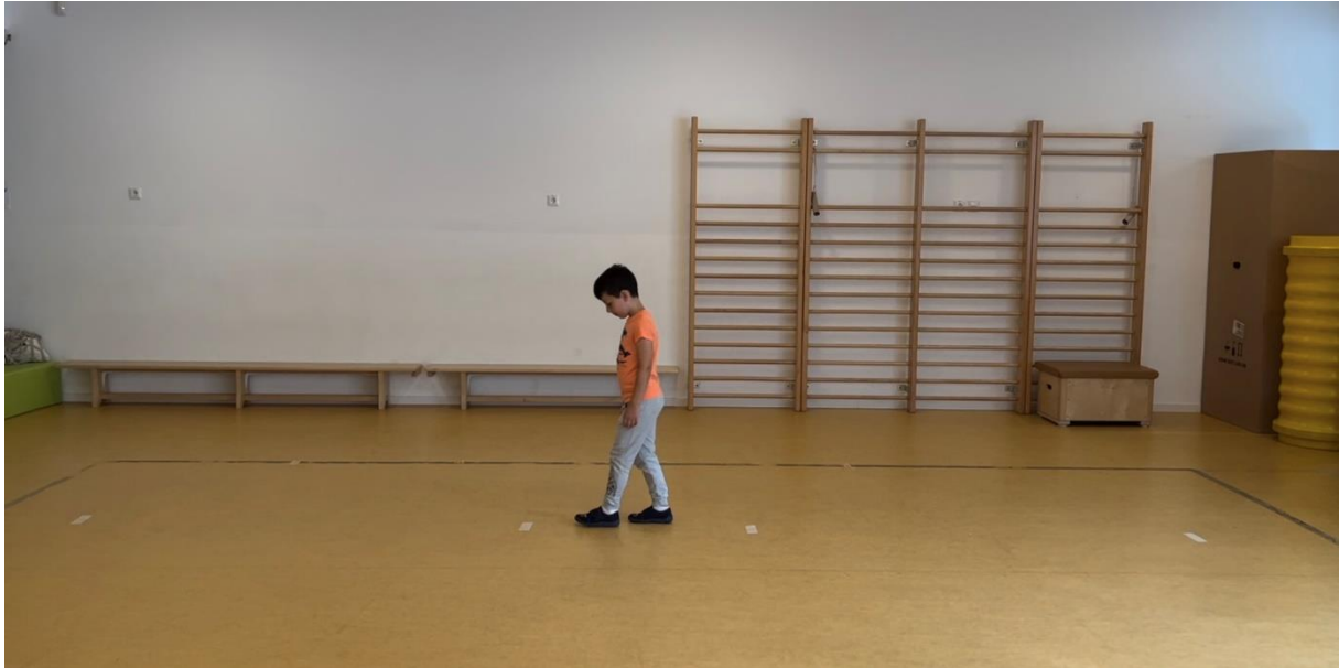
Slika 4: motorički zadatak 2: HODANJE UNATRAG

Drugi motorički zadatak bio je hodanje unazad po istoj udaljenosti od pet metara. Djeci je bila potrebna isključivo usmena uputa. U motoričkom zadatku hodanje unatrag izdvojile su se sljedeće varijable: ukupno trajanje zadatka, broj koraka, prosječno trajanje koraka, dužina koraka, prosječan kut (kuk i glava) te aktivnost ruku.