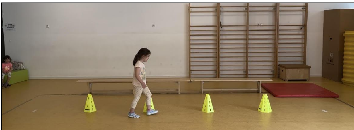
Slika 11: Vanjska noga nije u ravnini čunja

Gledajući navedene parametre iz Tablice 14, može se uočiti da je korelacija dosta visoka, odnosno statistički značajna. Crvene brojke prikazuju statistički značajan rezultat. Vidljivo je da indeks tjelesne mase utječe na trajanje zadatka i broj koraka. Možemo zaključiti da djeca sa većim indeksom tjelesne mase sporije odrađuju motoričke zadatke. Na dužinu koraka kao i u prethodnim tablicama utječe dob djece, što su djeca viša to je i njihov korak duži.