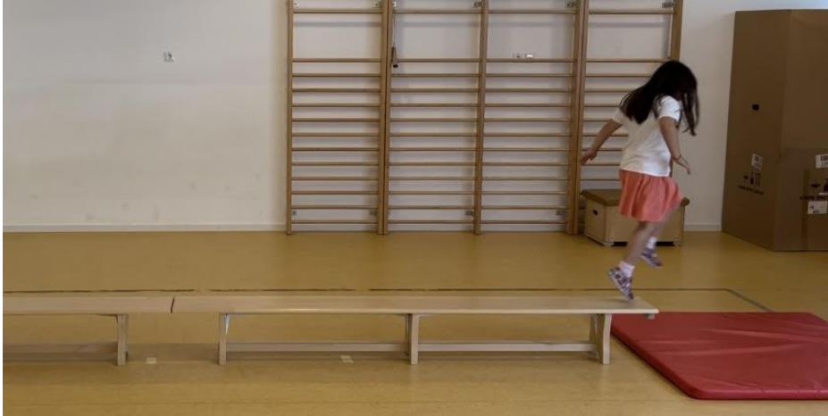
Slika 15: Jednonožan odraz (slika 14) i sunožan doskok (slika 15)