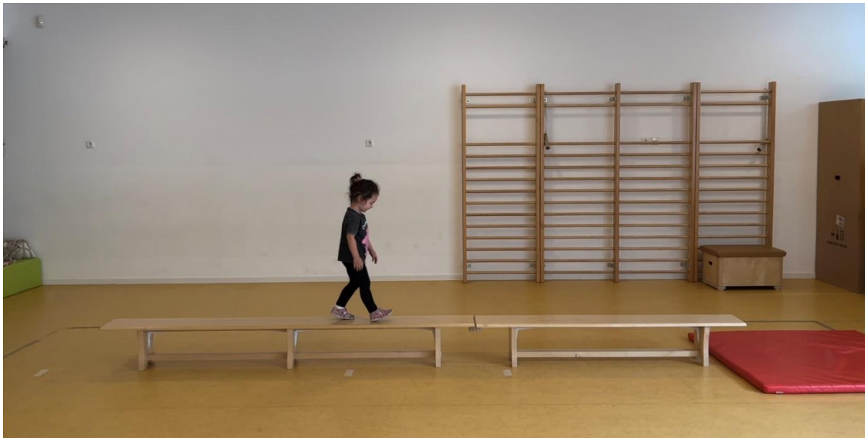
Slika 6: motorički zadatak 4: HODANJE PO KLUPI

U četvrtom motoričkom zadatku djeca su hodala po švedskoj klupi. Uz navedene varijable ukupno trajanje zadatka, broj i dužina koraka, trajanje koraka, prosječan kut u zglobu kuka i glave i aktivnost ruku, dodane su još dvije varijable način penjanja (jednonožno penjanje i jednonožno penjanje uz pomoć ruku) te način silaženja (jednonožan odraz i sunožan skok, jednonožan odraz i jednonožan doskok, jednonožno silaženje te sunožan odraz i sunožan doskok).