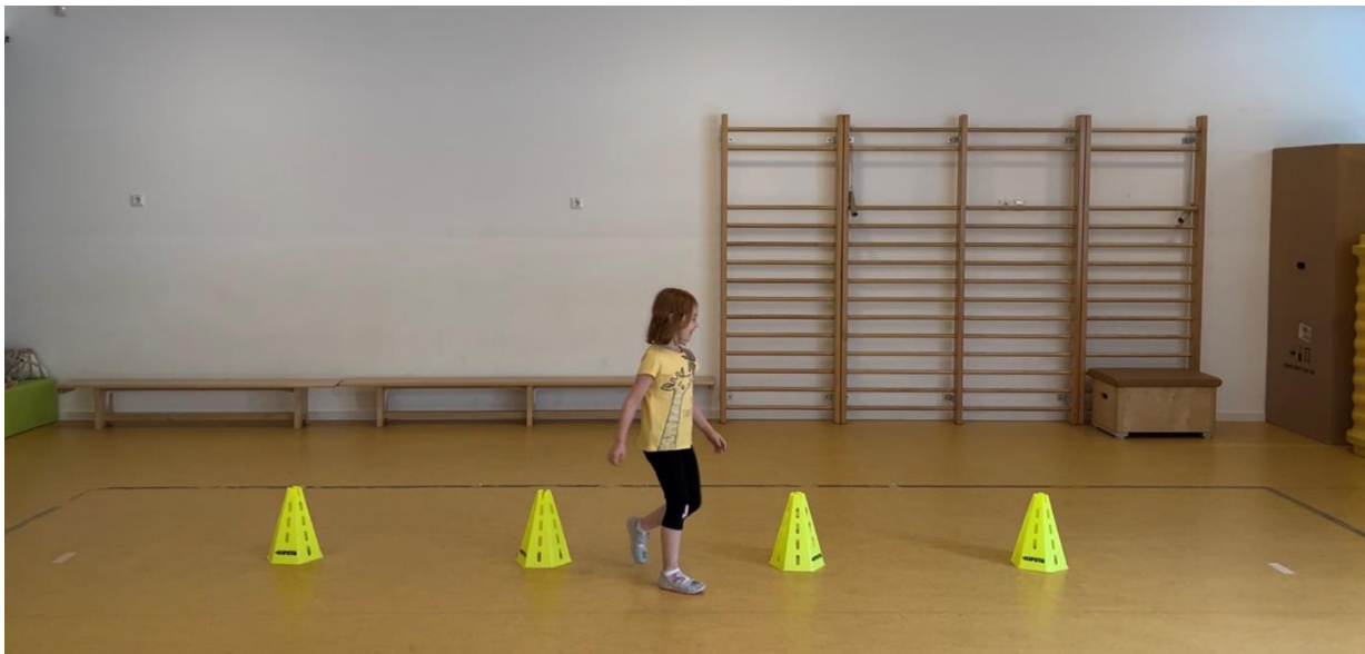
Slika 5: motorički zadatak 3: HODANJE SLALOM

U trećem motoričkom zadatku hodanje u slalom, na označeni teren postavljeni su čunjevi. Čunjevi su postavljeni na udaljenost od jednog metra. Djeca su tijekom hodanja zaobilazila čunjeve. Tijekom hodanja slalom izdvojile su se sljedeće varijable: ukupno trajanje zadatka, broj koraka, prosječno trajanje koraka, dužina koraka, prosječan kut (kuk, glava, gležanj i koljeno), aktivnost ruku i pravac kretanja stopala.