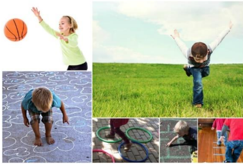
Slika 1: Razvoj grube motorike