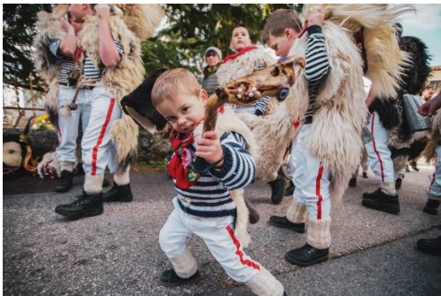
Slika 10. Mići Halubajski zvončari