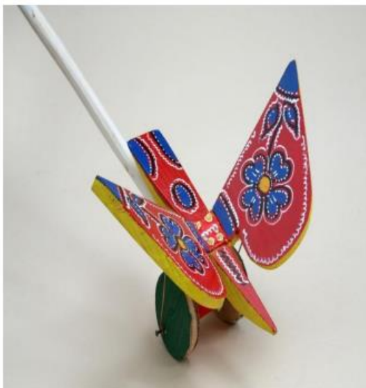
Slika 5. leptir i konjić