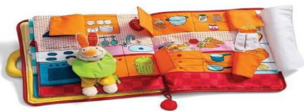
Slika 3. Interaktivna slikovnica “Zeko ide na spavanje”