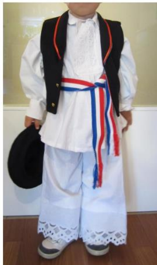
Slika 4. dječja nošnja