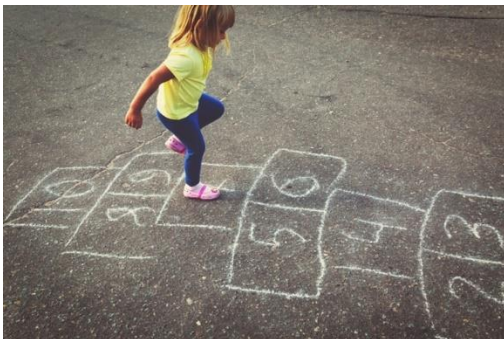
Slika 11. Djevojčica igra školice

Preuzeto sa Internet stranice dječjeg vrtića Viškovo https://www.vrtic-viskovo.hr/content/3283/igre-iz-davnina , preuzeto 27.2.2023.