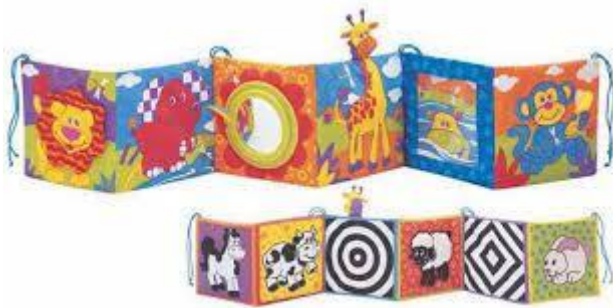
Slika 2. Leporello slikovnica