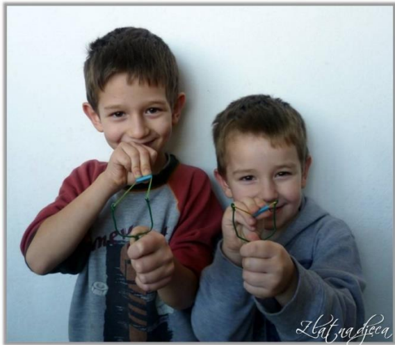
Slika 12. Dječaci s pračkama