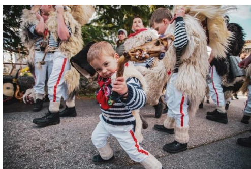
Slika 10. Mići Halubajski zvončari