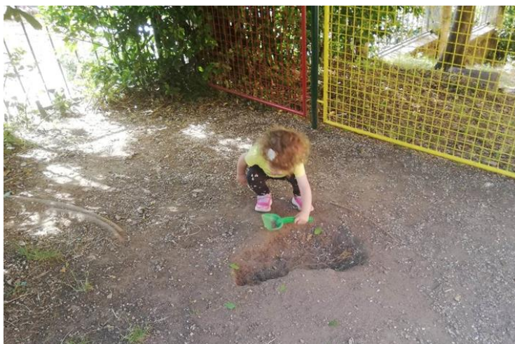
Slika 7.: Kopanje rupe

Zemlju pokušava baciti što dalje, iskušava pritom razne pokrete. Okreće se i promatra gdje je bacila zemlju i koliko daleko. Uzima ju u ruku, trlja ju među rukama i baca na tlo. Prenosi zemlju u lopatici od A do B točke. Zatim baca i lopaticu u zrak. Odlazi do gusjenice i ponovno se penje na nju. Primijetila sam da se penje na nju dok je prazna, a čim dođu druga djeca (starija), povlači se i odlazi dalje.