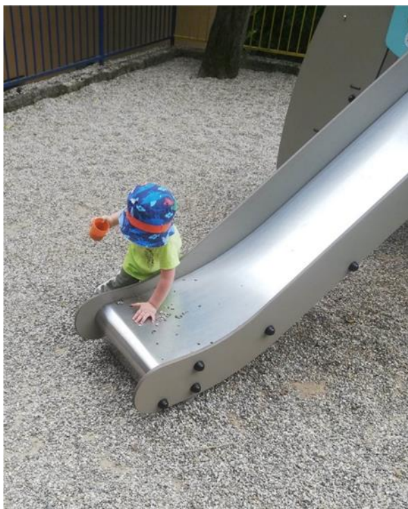
Slika 10.: Bacanje kamenčića na tobogan