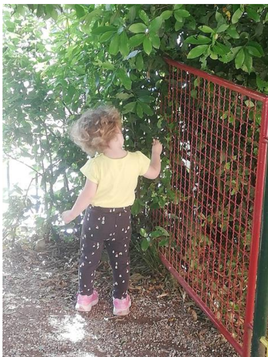
Slika 6.: Bacanje kamenčića kroz ogradu

Ubrzo je naišla na otpalo, suho lišće koje se nalazilo s kamenčićima. Opipava lišće, trga ga, savija, promatra ga sa svih strana, a potom ga baca. Okreće se prema iskopanoj rupi koja se nalazi kraj nje. Počinje kopati rupu, malo rukom, malo lopaticom.