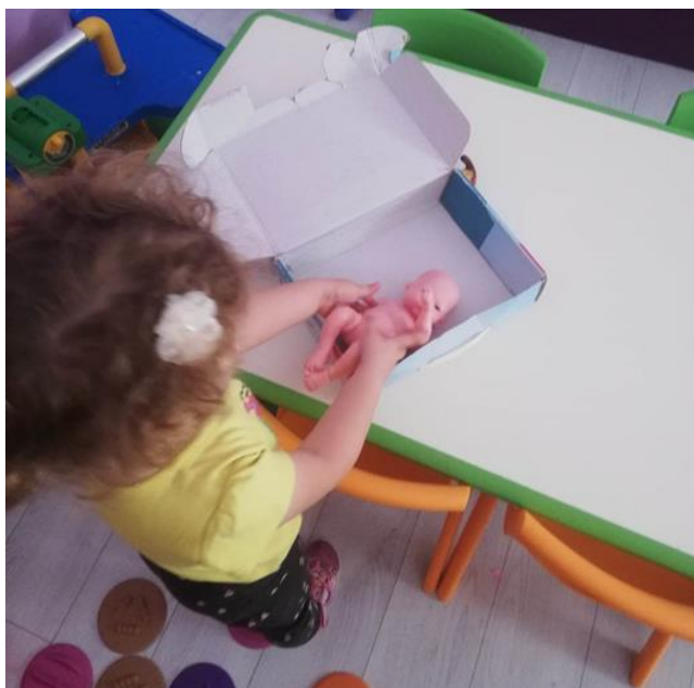
Slika 3.: Imitativna igra s bebom

Sljedećeg dana, djevojčica je uzela bebu i započela s imitativnom igrom. Spremila je bebu u kutiju od puzzli. Nosi je na prsima i ljuljuška je, a potom je prenosi po sobi. Prilikom ove igre, ona promatra drugu djecu (s kim se igraju, što rade), ali ih i osluškuje o čemu razgovaraju. Prolazi s bebom kroz cijelu sobu u nekoliko navrata i sve ponavlja ispočetka. Nakon ove igre uslijedio je izlazak u vanjsko dvorište.