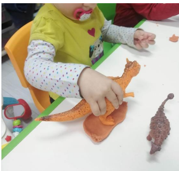
Slika 2.: Likovna aktivnost – otisak ruke dinosaura