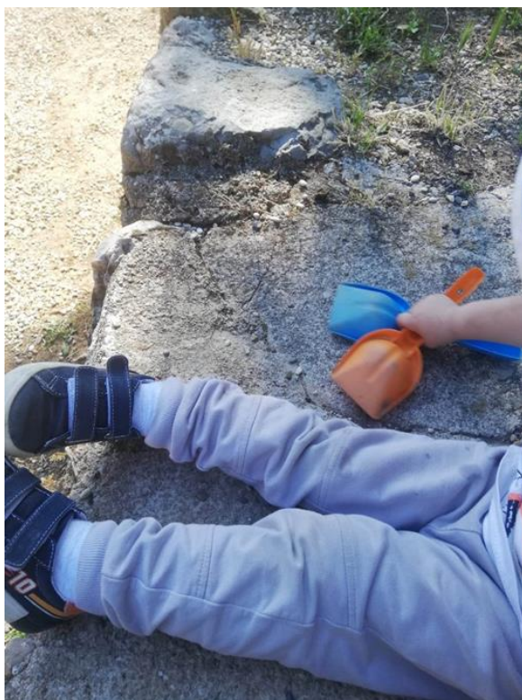
Slika 8.: Hvatanje kamenčića s lopaticom

Nakon ove igre (koja je kratko trajala) prelazi na sljedeću – istraživanje kosine. Hoda najprije uzbrdo po betonu te hoda niz njega dolje. Ponovno se penje, ovog puta brže te se spušta trčeći. Potom uzima kamenčiće u lopaticu, nosi ih na vrh uzvisine te ih ispušta i gleda kako se kotrljaju i padaju. Nakon te igre, odlazi u šetnju po dvorištu. Na kraju puta pronalazi jedan veći kamen. Pogledom traži posudu. Uzima je te u nju stavlja kamen. Počinje hodati prema dvorištu s kamenom u posudi. Zatim počinje trčati i osluškivati. Uzima novu (veću) posudu i premeće u nju kamen. U igri mu se vrlo brzo pridružuje još jedan dječak, koji donosi još nekoliko sličnih kamenja. Svako dijete uzima svoju posudu i zvoni s kamenjem. Odlučuju prebaciti sve kamenje u jednu posudu i ponovno zveckati posudom kako bi čuli zvuk. Dječak me primjećuje i pokazuje mi što rade, a zatim mi pruža posudu da i sama isprobam zveckanje. Neko vrijeme prebacuju kamenje te se igraju s količinom, zvukom i veličinama posuda.