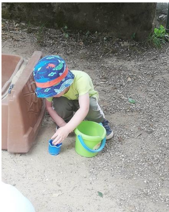
Slika 9.: Prebacivanje kamenčića iz posude u posudu

Sljedeća igra u koju ulazi promatrani dječak je bacanje kamenčića (šljunka) na tobogan. Jako mu je zabavno slušati zvuk koji se proizvodi. Baca nekoliko šaka kamenčića i osluškuje, a potom rukom sve to miče i čisti tobogan. Dakle, eksperimentira s različitom količinom i brzinom bacanja kamenčića. Najprije je kamenčiće bacao na način da je stao bočno kraj tobogana i samo je ispustio kamenčiće iz ruke. Nakon nekoliko minuta, pridružila su mu se još neka djeca u igri te mu jedan dječak pokazuje kako on baca. Ubrzo D.P. uzima kamenčiće, staje na kraj tobogana i baca kamenčiće u vis. Oni se sada kotrljaju niz tobogan prema dolje. Ovo mu se činilo još zanimljivijim i ponavlja to dugo. U međuvremenu je otkrio kako kamenčiće može baciti s višeg položaja. Penje se na početak tobogana i kamenčiće baca s vrha tobogana. Gleda ih i smije se, a potom se spušta niz tobogan pa tu igru nastavlja ponavljati. Na kraju igre uzima posudu i baca ju u tobogan prema gora, a ona pada dolje. Za kraj se poigrao s posudom koju je više puta bacao uzbrdo uz tobogan.