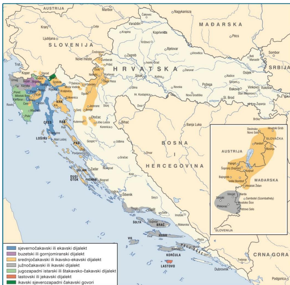
SLIKA 2. Čakavski dijalekti

Bičanić, A. (2018). Povijest hrvatskoga jezika, 5. knjiga. Zagreb: Croatica: 526. (Autori karte: Vranić, S., Zubčić, S.; Kartograf: Kaniški, T.)