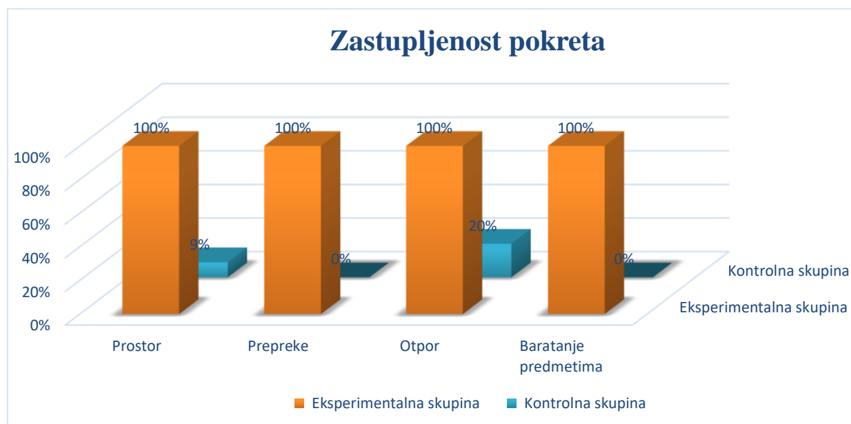
Graf 2 :Zastupljenost biotičko motoričkih znanja u eksperimentalnoj i kontrolnoj mješovitoj skupini u sobi dnevnog boravka

Rezultati jasno ukazuju na to kako je pokret u eksperimentalnoj skupini djece prisutan u potpunosti u svim domenama biotičko motoričkih znanja, dok pokret u kontrolnoj skupini neusporedivo manje prisutan.