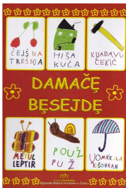
Slika 3. Slikovnica-rječnik Damače besejde

Svim odgojiteljima, učiteljima i odraslima prenošenje mjesnih govora trebao bi biti poticaj za očuvanje govora, ali i da djecu upoznaju s njegovom posebnosti. Govori čabarskog kraja međusobno su vrlo različiti, ali i zanimljivi za proučavanje, stoga bi trebalo poticati govornike da i dalje prenose na mlađe generacije kako bi se ta različitost i ljepota jezika očuvala i među onim najmlađima.