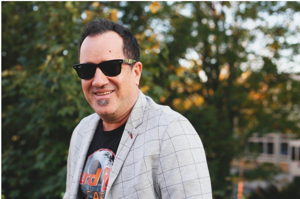
Slika 16. Neno Belan

Riječki glazbenici su bili produktivni 2005. godine te je ove godine objavljeno mnogo albuma koji su popraćeni nagradama. Održano je dosta događanja koji su ovo godinu još više obilježili kao jednom od najproduktivnijih. Father nakon više godina rada izbacuju svoj prvijenac Inspirit u sklopu Dallas Recordsa. En face izbacuje novi album Lako je ostati mlad također u za Dallas. Crooks & Straights bend country rock stila objavljuje svoj drugi album pod nazivom So Little Left To Say za Zeta Records. Elvis Stanić grupa objavljuje album Bolja strana svijeta u sklopu Croatia Records. Pasi su također izbacili novi album u stilu punk rocka. Od poznatijih bendova nove albume izdali su Grad, Let 3, Hesus Attor, Urban & 4 itd. Održani su mnogi događaji od koji su značajniji Gitarijada, Ri-Rock festival, Rado ližem, ljetni festival na Kastvu itd. Održan je SEAS Rijeka s ciljem promišljanja budućih funkcija industrijske zone u Rijeci. U tu svrhu okupili su se mnogi umjetnici, urbanisti, teoretičari i drugi stručnjaci. Razmjena informacija i znanja s drugim europskim gradovima doprinijela bi idejnom rješenju. Usporedno s radom konferencije SEAS održan je koncert u prostoru Tvornice papira. Nastupili su Bambi Molestersi koji su danas na glasu kao jedan od svjetski poznatih bendova na području surf rock stila. Meri Tošelj odnijela je nagradu Porin za najbolju žensku vokalnu izvedbu ( http://www.rirock.com/rirock-povijest/2005/ ).