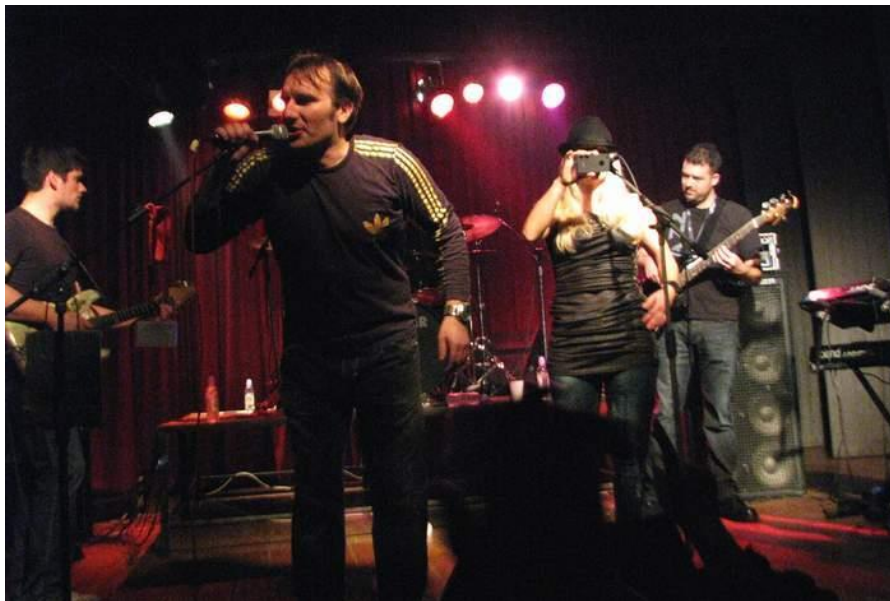
Slika 10. Nastup Šajete u istarskom klubu mladih Mate Balota u Zagrebu 2011. godine ( https://istarski.hr/node/1119-sajeta-odusevio-istarske-studente-u-zagrebu )

U studenom 1994. godine objavljena su dva vrlo važna albuma za riječku glazbenu scenu. Laufer objavljuje album Pustinja, a Let 3 album Peace. Let 3 je privremeno iz Rijeke preselio u središnju Istru gdje su stvorili nove skladbe poput Kontinento, Luna Cinquina, Nafta, Novine itd. Oba albuma rezultirala su višemjesečnim turnejama za oba benda diljem zemlje te rezultirala ovacijama publike i odličnim kritikama medija. Do kraja godine izlazi drugi album grupe En Face s imenom S dlana boga pala si. Na albumu se nalazi istoimeni hit singl koji je otpjevan u suradnji s Damirom Urbanom, a pjesma je 1996. godine dobila Porina i time ušla u povijest kao jedna od značajnijih pjesama u povijesti hrvatske glazbe. Izašla je prva glazbena enciklopedija u Hrvatskoj, Mala enciklopedija hrvatske pop i rock glazbe. Jedina je to knjiga koja je pokrila gotovo sve značajnije hrvatske glazbenike i izvođače ( http://www.rirock.com/rirock-povijest/1994/ ).