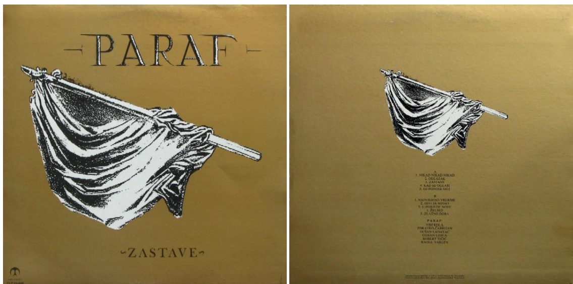
Slika 7. Omot albuma Zastave grupe Paraf iz 1984. godine ( https://www.discogs.com/Paraf-Zastave/release/1040281 )

Zbog raspada Termita Robert Tičić dolazi u Parafe, ali nedugo zatim njegov život završava zbog urođene srčane mane. U prosincu 1984 godine izlazi najznačajniji album Parafa s nazivom Zastave. Album je uvelike doprinio riječkom i hrvatskom rocku, te Novom valu. Grupa Denis & Denis izdaje novu pjesmu Program tvog kompjutera koja ubrzo zatim postiže veliki uspjeh na prostoru bivše Socijalističke Federativne Republike Jugoslavije. Vođeni postignutim uspjehom ubrzo objavljuju album Čuvaj se na kojem se nalazi singl Program tvog kompjutera. Iste godine Xenia izdaje svoj posljednji album Tko je to učinio. Riječka grupa Furije nastupa na Festivalu mladih i postiže uspjeh u Pazinu. Cure iz Opatije osnivaju prvi ženski bend na Kvarneru s nazivom Cacadou Look. Održan je prvi heavy metal koncert grupe Nož u Leđa. Od članova bivših rock bendova nastaje novi bend Walter koji ubrzo postiže uspjeh na Gitarijadi 84. Gitarijada ostaje natjecateljski događaj koji se održao sve do današnjih dana, dok je Ri-Rock festival zadržao vrijednosti izvođenja pjesama i prezentaciju novih izvođača ( http://www.rirock.com/rirock-povijest/1984/ ).