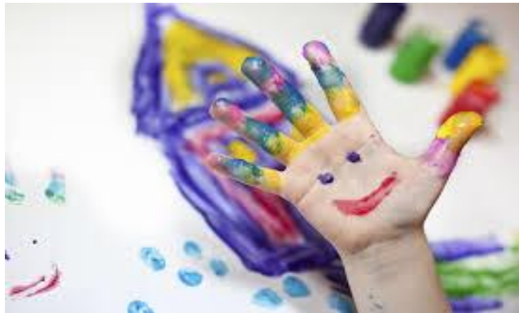
Slika 2. Likovne aktivnosti