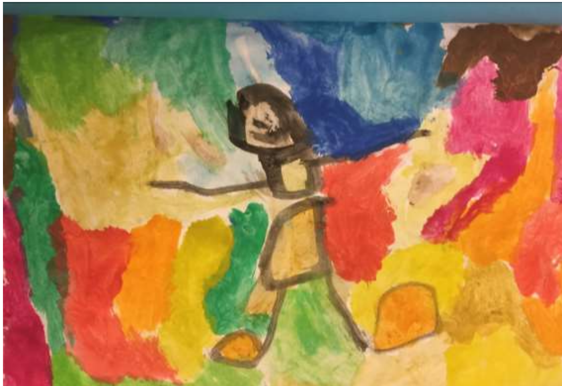
Slika 7: Dječak L.M. – 5 godina

Ovaj koloristički prikaz nastao je bojanjem ploha različitim bojama čime je stvorena dinamika radnje. Bogatstvom odabira raznih boja, dječak je izrazio fluentnost. Također je dobro elaborirao raspored i ritmičnost boja po površini papira, dok je ljudsku figuru smjestio u središnjem dijelu papira.