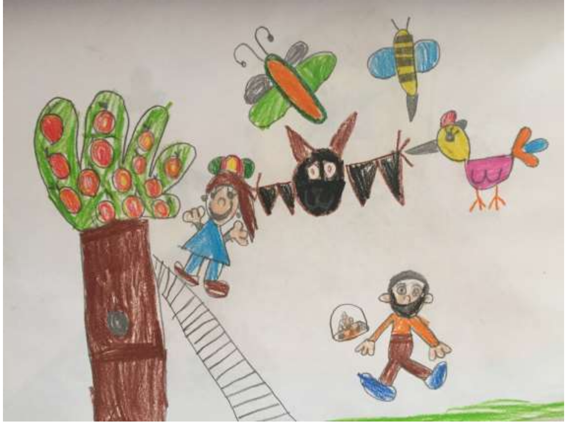
Slika 6: Dječak L. P. – 6 godina

Na ovom likovnom uradku prije svega se ističe kombiniranje likovnih tehnika (olovka i drvene boje), a zatim i fluentnost. Fluentnost je uočljiva u raznovrsnosti i bogatstvu likovnih elemenata (boje, crta, točaka...), kojima se prikazuju bića na slici, čime je predočena dinamika radnje branja jabuka. Osjetljivost za prikaz likovnog problema uočava se i u pojavnosti šišmiša među ostalim dnevnim životinjama.