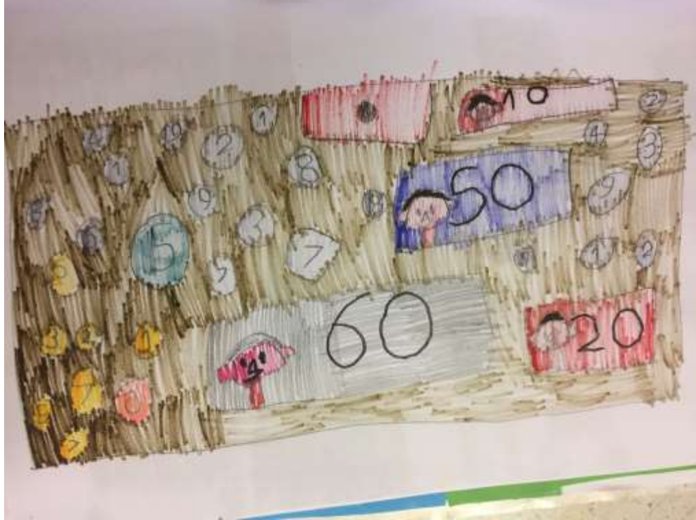
Slika 5: Dječak S. I. – 7 godina

Na ovom likovnom uradku među faktorima likovne kreativnosti ističe se fleksibilnost. Ona se uočava u prikazu novčanica na razne, nove načine, osmišljavajući novi dizajn. U sklopu fleksibilnosti se ističe i humor budući da su novčanice i kovanice u iznosima po 3, 6, 8 i 9 jedinica vrijednosti. Na uradku uostalom uočava i dosljedna elaboracija budući da je gotovo cijeli papir ispunjen, a novčanice i kovanice ritmično raspoređene. Naposljetku uočava se i dosljednost u popunjavanju ploha.