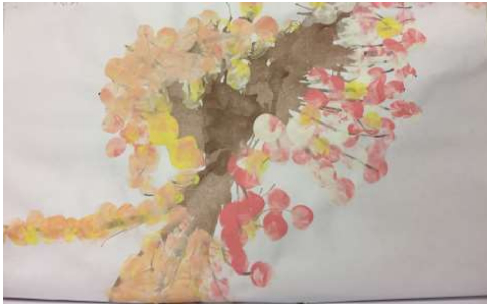
Slika 4: Djevojčica K.R. - 7 godina

Na ovom uradku među elementima likovne kreativnosti ističu se elaboracija i originalnost. Elaboracija je uočljiva jer dijete neuobičajeno određuje kompoziciju djela u dijagonalni raspored i time upotpunjava cjelovit vizualni prikaz. Originalnost je vidljiva, osim u inovativnosti dijagonalne kompozicije, i u načinu miješanja boja izravno na papiru.