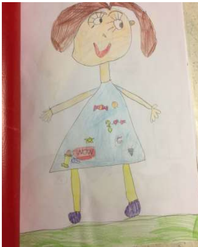
Slika 2: Djevojčica E.S. - 7 godina

Rezultati istraživanja odnose se na dječje likovne uradke, kojih je mnogo pa je u ovom radu egzemplarno odabranih nekoliko u kojima su vidljivi ispoljeni faktori likovne kreativnosti.