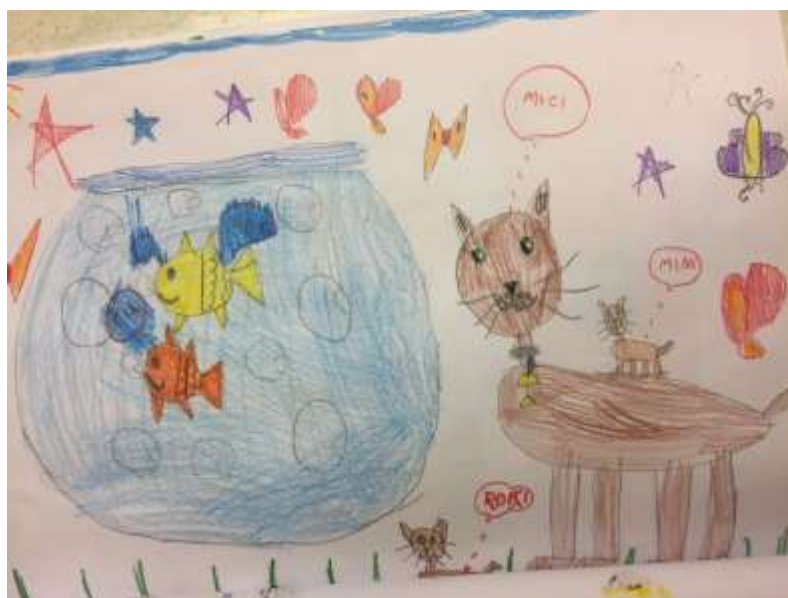
Slika 3: Djevojčica E.S. - 7 godina

Na ovom se likovnom uradku od faktora kreativnosti uočavaju fluentnost, elaboracija i elementi osjetljivosti za problem. Fluentnost je prije svega uočljiva na temelju bogatstva elemenata na uradku (mačke, ribe, leptiri, srca, zvijezde, nebo, trava, mjehuri zraka, sunce...). Elaboracija je uočljiva rasporedu svih elemenata na papiru, s vrlo malo praznog prostora. To upućuje na dobro vladanje dvodimenzionalnim prostorom, odnosno plohom. Osjetljivost za problem uočljiva je u narativnom prikazu radnje. To je postignuto velikim brojem detalja u sklopu svih elemenata na papiru – senzibiliziranje.