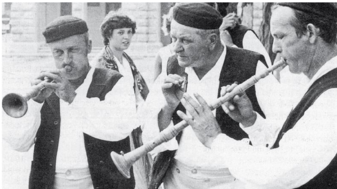
Slika 12: Sopci 20