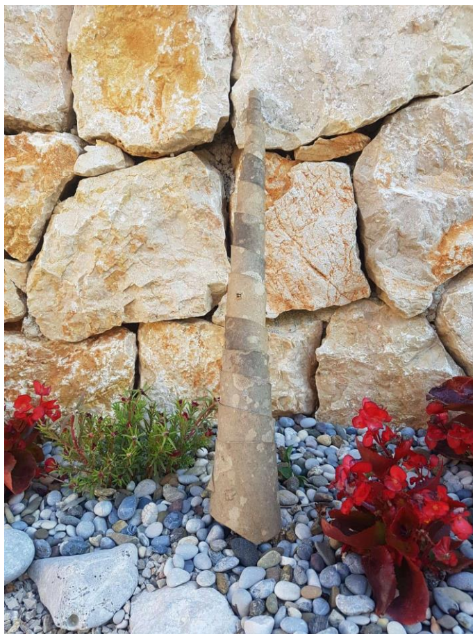
Slika 5 :Trumba 12

bez kojih sviranje nije bilo moguće, a koji su se izrađivali od mladog jasena. Dimenzije prebiralnice i piska ovisile su o širini trumbe na početku te su se prema tome i izrađivali. Trumbe su se najprije koristile kao glazbala koja su bila zabava osobama koje su vodile stoku na ispašu na Jurjevo, a izrađivale su se dan ranije. Na taj dan, na ispašu bi se vodila samo najbolja stoka koja bi kada se vrati među svoje stado, donijela blagoslov te nadu da će sljedeća godina biti bogata plodom i potomcima. Zanimljivo je bilo da su pastiri znali odvesti stoku na različite strane brda te bi trumbama svirali jedni drugima i zabavljali se za vrijeme čuvanja blaga. Običaj trumbanja godinama nije bio provođen, sve do prije desetak godina kada su na području Dobrinja mladi odlučili ponovno oživjeti običaj trumbanja na dan prvog maja (Kirinčić, I).