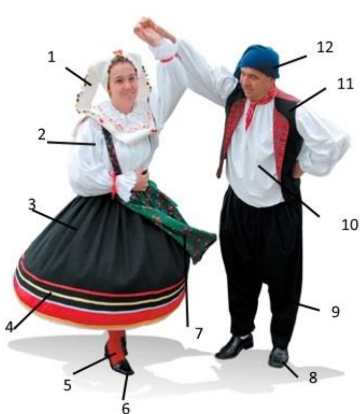
Slika 3 Nošnja s Dobrinjštine 10

Mušku nošnju u Dobrinju karakterizira ukras oko vrata kojega predstavlja crveni facol . Muškarci također nose i vardakol , a njega posebno ukrašava pozadina koja je napravljena od atlas svile. Na nogama nose vunene čarape koje se na dobrinjštini nazivaju hojevi .