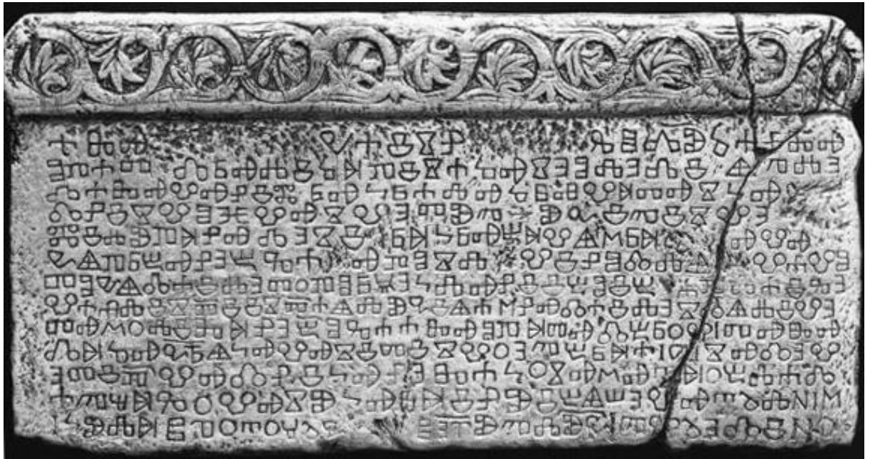
Slika 1: Bašćanska ploča 3

Detaljniji opis pisma koji se nalazi na Bašćanskoj ploči, a koristio se na našem području slijedi u sljedećem tekstu o glagoljici.