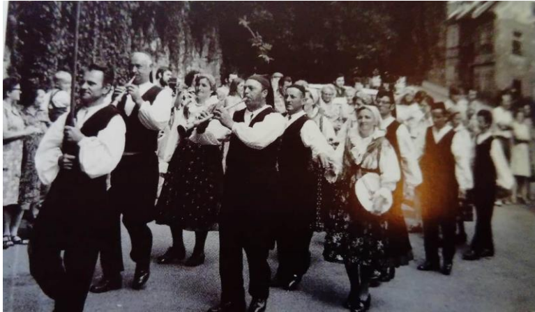
Slika 14: Sudionici prvog Krčkog festivala iz Punta 26