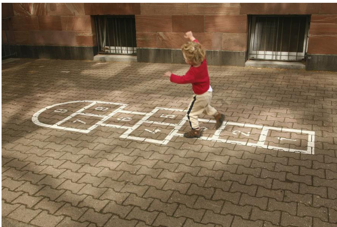
Slika 18:Igra Školice 30

po poljima na jednoj nozi ili na dvije, ovisno kako polje zahtijeva. Kada dođu do cilja, igrači se okreću polukružno i skakuću unatrag istim putem na isti način. U povratku moraju pokupiti kamenčić s poda dok stoje na jednoj nozi. Ukoliko uspiju, bacaju kamenčić na sljedeće polje i ponavljaju postupak sve dok ne pogriješe. Kada pogriješe, na njihovo mjesto dolazi drugi igrač, a igrač broj jedan nastavlja igru kada na njega ponovo dođe red, na broju na kojemu je prethodno pogriješio.