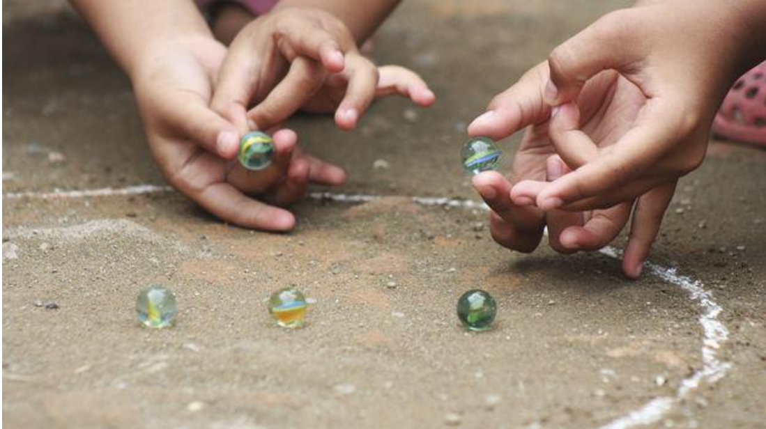
Slika 17: Igranje špegulima 29