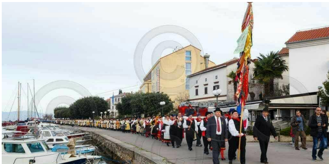
Slika 4:Kolejani u Dubašnici 2015.godine 11

kralja i označavao je razdoblje sabiranja. U sabiranju su sudjelovali mladi iz Dubašnice koji su dogovorno unaprijed birali kralja i kraljicu kako bi olakšali sam proces i izbjegli neugodne situacije mogućeg odbijanja sudjelovanja. Za kralja se uvijek odabirao najbolje stojeći mještatinin jer su izdaci koji su bili povezani uz tu funkciju i tu čast bili jako veliki, a prethodno bi se takvim osobama najavila mogućnost izbora, odnosno kandidiranja za kralja kako bi se izbjegle neugodnosti u trenutku proglašenja. Uloga kraljice je bila manje „rizična“ te je manje zadirala u njezino imovinsko stanje jer se njezina uloga odnosila na sudjelovanje u povorci s kolejanima pri obilasku kuća s ciljem prikupljanja darova koje su kolejani dobivali kao nagradu prilikom ophoda i čestitanja. Kraljica se zamoli da sudjeluje i prihvati tu ulogu. Najčešće je ulogu kraljice također imao muškarac. Kraljica je imala ulogu da s kolejanima obilazi kuće kako bi skupili što više sredstava za održavanje pira, a kuća koju ne bi posjetili, smatrala bi se uvrijeđenom. Prilikom prikupljanja darova nije bilo plesanja već je ples bio vrlo važan nakon ceremonije pira i plesalo se nakon večere dugo u noć.