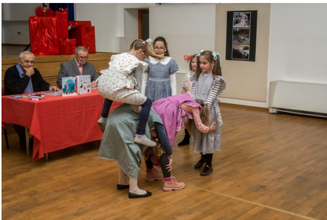
Slika 19: Igra Cukar i kafe 31

Cukar i kafe stara je igra koju danas djeca rijetko igraju. Za igru je potrebno više sudionika. Igra se igra tako da se određeni broj djece posloži na način da budu sagnuta te da tako sagnuta, stoje jedan iza drugoga. Cilj igre je da jedan igrač pokuša preskočiti što veći broj igrača koji su u sagnutom položaju kako bi bio pobjednik. Pri tome skoku igrač će doskočiti na jednog igrača i sjesti na njega. Igra se igra dok se svi ne izmijene i dok se ne dobije pobjednik.