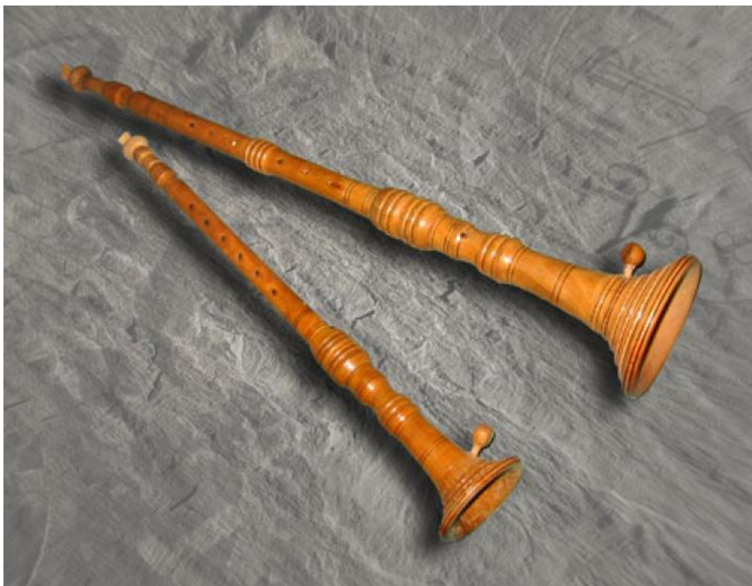
Slika 9:Soplele 17

Najpopularnije tradicijsko pučko glazbalo otoka Krka su sopele. Pretečom sopela smatra se srednjovjekovni instrument šalmaj koji je nestao iz europske glazbene prakse 1700.godine kada ga je zamijenila oboa, no koji se još uvijek danas može susresti kao tradicijsko glazbalo u Švicarskim Alpama. Povezanost među tim instrumentima ističe se u dvostrukom jezičcu (pisok) i cilindričnoj cijevi (prebiralnica) koju imaju oba instrumenta. Soplele su se na području otoka Krka nastanile u dalekoj prošlosti i imaju jedinstvene i zajedničke korijene zajedno s glazbenom kulturom Istre i Hrvatskog primorja.