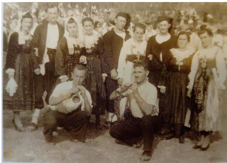
Slika 16: Sudionici prvog Krčkog festivala iz Vrbnika 28