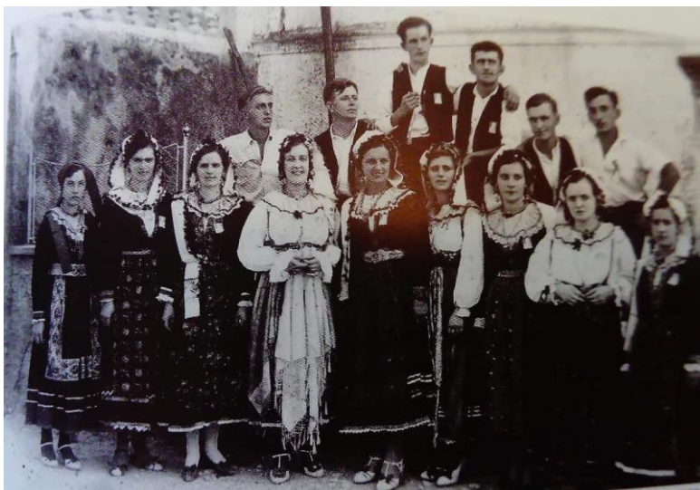
Slika 12.Sudionici prvog Krčkog festivala iz Dobrinja 24