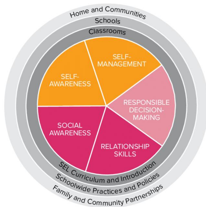
Slika 1 : Pet kompetencija CASEL-a (prema Duraiappah, Mercier i Singh, 2020:32)

Za uspješan prijelaz i prilagodbu djece, odgajatelji moraju posjedovati niz socijalno-emocionalnih kompetencija. Emocionalna povezanost s djecom ključna je za stvaranje osjećaja sigurnosti i podrške tijekom ovog važnog procesa. Socijalno-emocionalne kompetencije predstavljaju ključne vještine koje omogućuju pojedincima da razumiju i upravljaju vlastitim emocijama, uspostave pozitivne odnose s drugima te donose odgovorne odluke. Organizacija Collaborative for Academic, Social, and Emotional Learning (CASEL) definira socijalno-emocionalno učenje (SEL) kao proces koji obuhvaća pet ključnih dimenzija kompetencija,