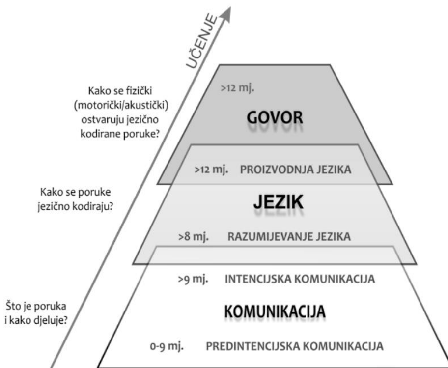
Slika 1: Razvojna piramida razvoja komunikacije, jezika i govora (preuzeto od Ljubešić i Ceganec, 2012:36) 1

Za dobru komunikaciju treba posjedovati vještine slušanja i promatranja drugih i treba razumjeti njihove poruke kao i posjedovati vještine prenošenja vlastitih ideja i osjećaja drugima kako bi iste bile od pomoći. Sa svim navedenim vještinama se susrećemo svakodnevno, ali kada se nalazimo pred nekim tko je uzrujan i treba pomoć, poput djeteta, treba promisliti na koji način mu pristupiti kako bi dobilo našu pomoć, podršku i potrebnu utjehu (Lupis, 2002). Dijete aktivno sluša govor osoba koje ga okružuju i stvara temelje za usvajanje jezika. Kod djece koja pokazuju primarna odstupanja u domeni razvoja komunikacije uočavaju se znakovi niže zainteresiranosti za socijalnu okolinu, nesustavno odazivanje na ime, oskudniji kontakt očima, oslanjanje na jednostavnija komunikacijska sredstva i sl. Razvojna piramida prikazuje razvoj komunikacije, jezika i govora (Ljubešić i Ceganec, 2012, prema Ceganec, 2023), a naznačena dob upućuje kada se u djetetovu ponašanju mogu uočiti začeci navedenih sposobnosti (Ceganec, 2023).