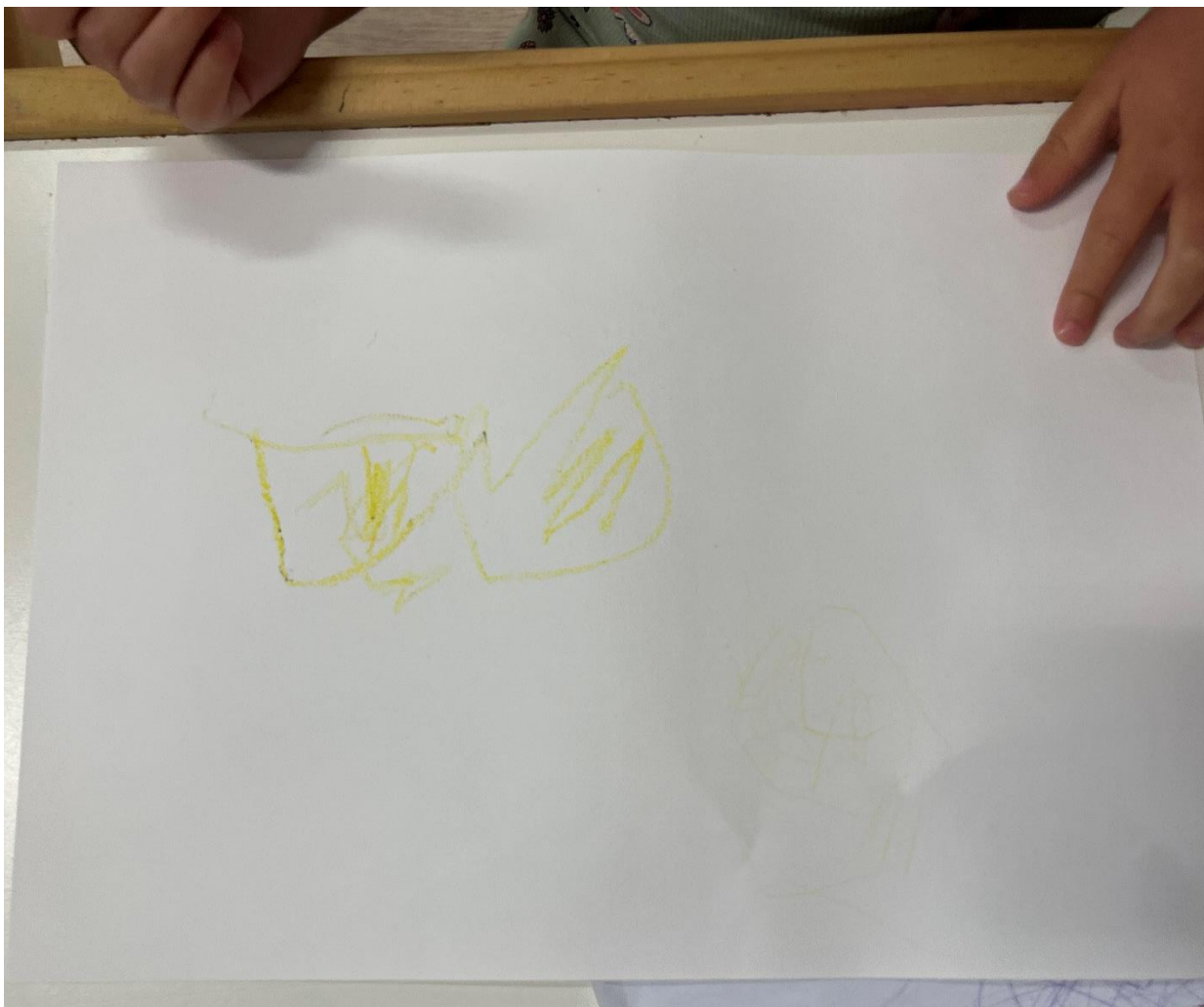
Slika 3. – crtež „sestra Eva“

Na slici 3. djevojčica u dobi od dvije i pol godine koristila je žutu pastelnu koju je nacrtala svoju mlađu „sestru“ koja se nedavno rodila. Odgojiteljici je djevojčica rekla da je to njezina sestra te ju imenovala imenom. Tijekom likovne aktivnosti crtanja, djevojčica se glasno smijala i pokazivala svaki korak crtanja posebno. Vidljivo je kako je djevojčica jako ponosna što je postala starija sestra jer često govori "ja sam dobila seku", "moja seka" i slično. Osjećaji sreće pratili su djevojčicu tijekom cijele crtačke likovne aktivnosti. Može se zaključiti kako je djevojčica novi događaj u svom životu, odnosno rođenje sestre prihvatila vrlo pozitivno i zadovoljna je svojom ulogom u obitelji kao starijom sestrom.