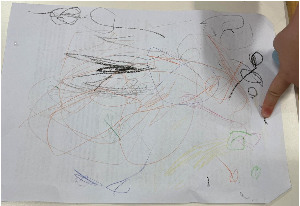
Slika 4. – crtež „pas Sky“

Slika 4. prikazuje crtež djevojčice od tri godine koja je nacrtala svog „psa Sky-a“. Zanimljivo je što ista djevojčica u posljednjih nekoliko mjeseci crta iste ili slične okrugle oblike koristeći se drvenim bojicama, flomasterima i pastelama. U crtačkoj likovnoj aktivnosti zadržava se duže te je visoko motivirana i koncentrirana na aktivnost. Tijekom likovne aktivnosti i razgovora sa djevojčicom primjećuje se velika razina uzbuđenosti kod djevojčice. Ona opisuje različite događaje sa psom Sky-em od kojih su neki povezani sa emocijama sreće i uzbuđenja a neki sa emocijama ljutnje i iznenađenja. Primjerice, kada djevojčica govori o tome da ona i pas Sky spavaju zajedno to govori sa osmjehom i zadovoljstvom. Međutim, djevojčica spominje i kako pas Sky nije slušao tatu na zajedničkom obiteljskom izletu te joj se izraz lica mijenja na način da se mršti i podiže obrve uz pokazivanje kažiprstom i govorenjem "tata je rekao ne - ne Sky". Vidljivo je kako djevojčica koristi različite boje što se može povezati sa različitim emotivnim stanjima koja se bude kod djevojčice.