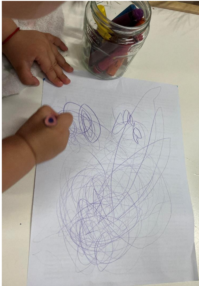
Slika 1. – crtež „tate“

Na slici 1. nalazi se crtež djevojčice od dvije godine. Djevojčica je odabrala ljubičastu drvenu bojicu i nacrtala „tatu“. U razgovoru sa djevojčicom, u početku se primjećuju emocije sreće i uzbuđenja što se može povezati sa pozitivnim stavom i osjećajima prema ocu. Međutim nakon