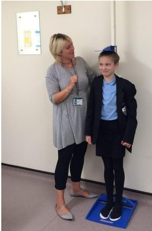
Fotografija 9: Mjerenje tjelesne visine