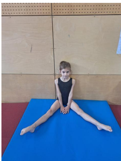
Fotografija 4: Test Pretklon raznožno

„Učenik sunožno sjedne na tlo oslonjen čvrsto leđima i glavnom na zid. Ispružene noge raširi tako da one leže na označenim crtama na podu. U tom položaju ispruži ruke i postavi dlan desne ruke na dlan lijeve ruke, tako da se srednji prsti prekrivaju. Tako postavljene i opružene ruke spušta na tlo ispred sebe. Ramena i glava za to vrijeme moraju ostati oslonjeni na zid. Učitelj postavlja metar s nulom na mjesto gdje učenik dodirne tlo vrhovima prstiju. Zadatak je učenika izvesti što dublji pretklon, ali tako da vrhovi prstiju spojenih ruku lagano, tj. bez trzaja, klize uz metar po podu“ (Pejčić i Trajkovski, 2018). Zadatak se ponavlja tri puta bez, a učitelj zapisuje najbolji rezultat u centimetrima.