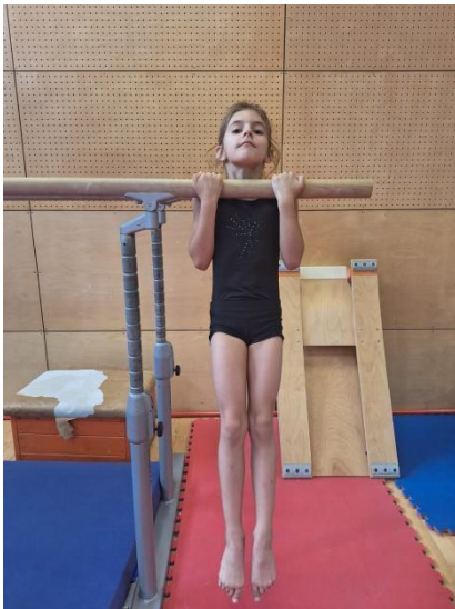
Fotografija 3: Test Izdržaj u visu zgibom

„Test se izvodi tako da se dijete podigne pothvatom dok bradom ne dosegne visinu iznad preče i taj položaj zadržava što je moguće dulje“ (Trajkovski, 2022). Učenik treba izdržati što dulje, tj dok mu se brada ne spusti ispod preče, a ruke se ispruže u laktovima. Rezultat se izražava u sekundama.