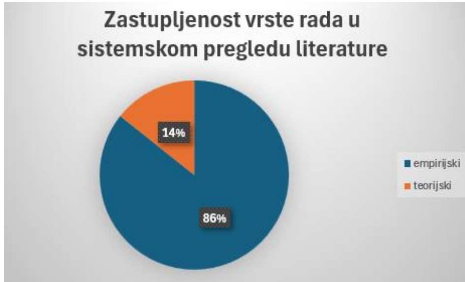
Grafikon 2: Zastupljenost vrste rada u sistemskom pregledu literature

U radovima se naglašava važnost kvalitete rada odgajatelja u odnosu na kvalitetu ustanove i kvalitetu odgoja i obrazovanja djece rane i predškolske dobi. Kvaliteta ustanove te unapređenje prakse ključno je za pružanje kvalitetnog odgoja i obrazovanja djeci rane dobi. Profesionalni razvoj odgajatelja utječe na kvalitetu rada odgajatelja te je važno da im ustanova osigura i omogući uključivanje u potrebne oblike profesionalnog usavršavanja. Također, dobrobit odgajatelja te smanjenje negativnih učinaka pozitivno utječe na kvalitetu njegova rada. U radovima se pokušavaju utvrditi utjecaji na odgajateljevo zadovoljstvo ili nezadovoljstvo radom te načini na koji se ono može unaprijediti. U istraživanjima se naglašava kvaliteta odgajatelja koja ponajprije ovisi o njegovom zadovoljstvu poslom i radnim uvjetima. Radni uvjeti odgajatelja su često narušeni te ono dovodi do emocionalne iscrpljenosti i nezadovoljstva. Radovi naglašavaju promjene u ustanovama ranog i predškolskog odgoja i obrazovanja, odgajatelji nose puno više odgovornosti i obaveza te se postavlja pitanje priprema li fakultet buduće odgajateljke dovoljno za ono što ih očekuje u praksi. Nužan je kontinuiran profesionalni razvoj kako bi odgajatelji razvili profesionalne kompetencije za 21. stoljeće i današnju praksu.