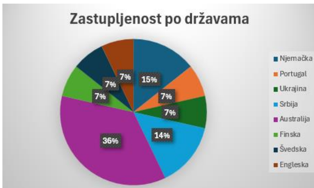
Grafikon 1: Zastupljenost po državama

Recentni radovi i istraživanja prikazuju postojeći interes za istraživanje kvalitete Ranog i predškolskog odgoja i obrazovanja, mogućnosti profesionalnog razvoja odgajatelja, kvalitete obrazovanja odgajatelja, izazove u radu, dobrobit odgajatelja. Pregledom recentnih radova došlo se do trenutnih spoznaja o praksi odgajatelja te mogućnosti unapređenja prakse. U ovome radu izdvojeno je četrnaest relevantnih istraživanja o navedenoj tematici. S obzirom na vrstu istraživanja, najzastupljeniji bili su empirijski radovi, a promatrajući države gdje su recentni i relevantni radovi nastali, može se utvrditi da se približno jednako o tematici istražuje u različitim dijelovima Europe no najviše se istražuje u Australiji (Grafikon 1).