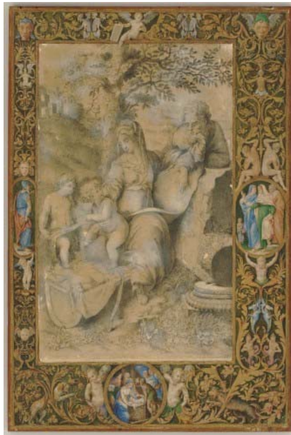
Slika 1. : RENESANSA, J. Klović, ukrasni okvir za crtež Sv. obitelji ispod hrasta (pripisan Andrei del Sarto), Zagreb, Ured Predsjednika Republike ( https://enciklopedija.hr/clanak/renesansa )

je umjetnike romantizma da prikazuju djecu kao male anđele i uzdižu ih kao božanska bića (Slika 1. ).