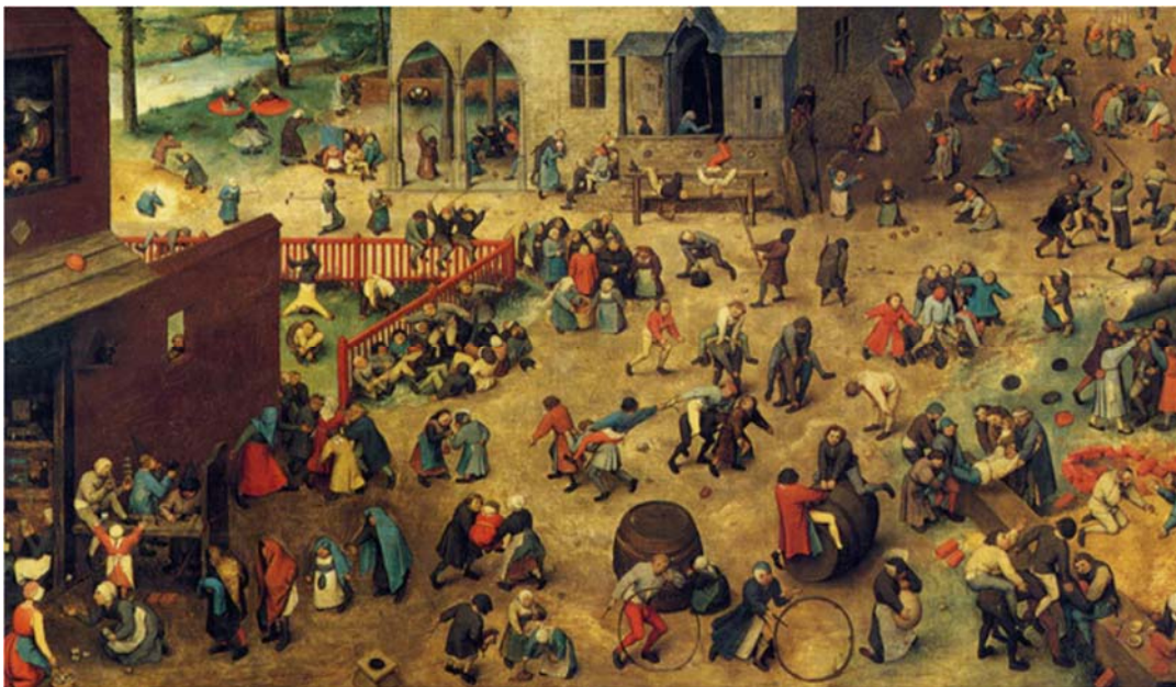
Slika 2. : Pieter Brueghel Stariji, Dječja igra (sredina 16. st.) ( https://commons.wikimedia.org/w/index.php?curid=4892331 )

U 17. stoljeću počeli su se objavljivati priručnici sa savjetima o obrazovanju i odgoju djece, što je dovelo do razvoja tržišta odjeće, knjiga, igračaka i igara posebno dizajniranih za djecu, a pojava posebne briga za djecu, označila je početak pedagogije koja se kasnije razvila u zasebnu granu medicine (Honoré, 2009). Ova promjena pokazuje rastuću svijest o potrebama djece i važnost o njihovoj skrbi i putokaz je prema razumijevanju dječjeg razvoja. Prihvaćeno je da igra važna za razvoj djece i da je važno omogućiti djeci slobodno vrijeme za igru i kreativnost (Slika 2.).