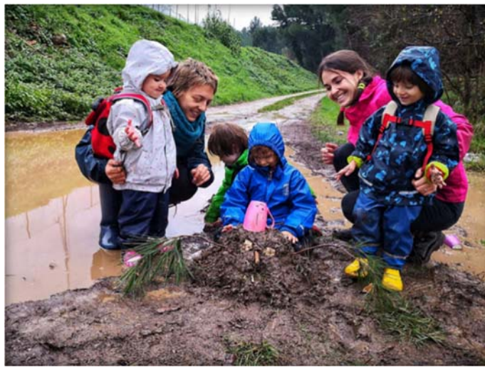
Slika 3.: Igra u šumskom vrtiću ( https://sumskadjeca.com )

najprirodniji način. Inicijativa za oslobađanje djece od utjecaja formalnog obrazovanja rezultirala je razvojem još jednog oblika predškolskog odgoja. Slično onome što je u 18. stoljeću zagovarao Roussou, u Skandinaviji su se 1950.-ih godina počeli otvarati vrtići na otvorenom bez knjiga, bojanki, računala niti igrališta koja su presvučena gumom, bez krovova i zidova. Djeci se pruža prostor i vrijeme za samostalno učenje, dok ih odgajatelji promatraju kako istražuju kroz igru, preuzimaju odgovornost, uče kroz pogreške i iz njih te rade na svojim zadacima, jer je igra bitan sastojak djetinjstva (Honoré, 2009). To su bile preteče današnjih šumskih vrtića, koji se otvaraju i u Hrvatskoj, a koji naglašavaju važnost boravka u prirodi i igranja s prirodnim, neoblikovanim materijalima (Slika 3.).