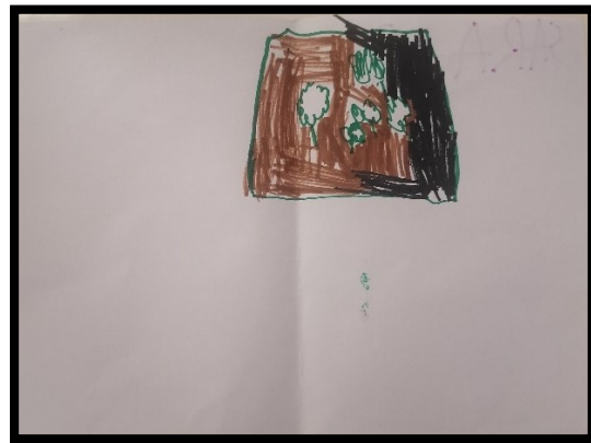
Crtež 4. NAŠ VRT (djevojčica S., 5 g.)