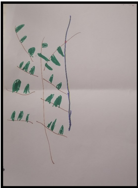
Crtež 3. ZAVEZANA ŠPAGA NA STABLU (djevojčica D., 5,5 g.)