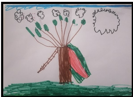
Crtež 5. STABLO SA STEPENICAMA I TOBOGANOM (djevojčica E., 5,5 g.)