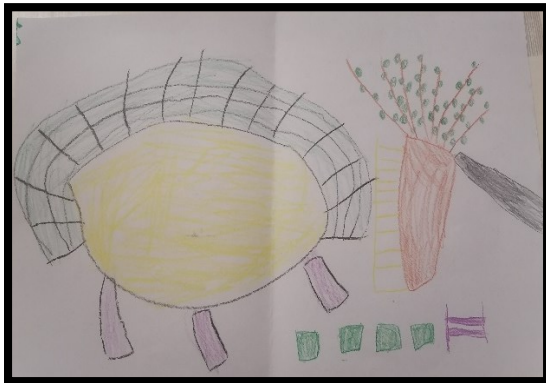
Crtež 1. TRAMPOLIN, DRVO S LJESTVAMA I TOBOGANOM TE STUPOVI ZA HODANJE (dječak P., 5 g.)