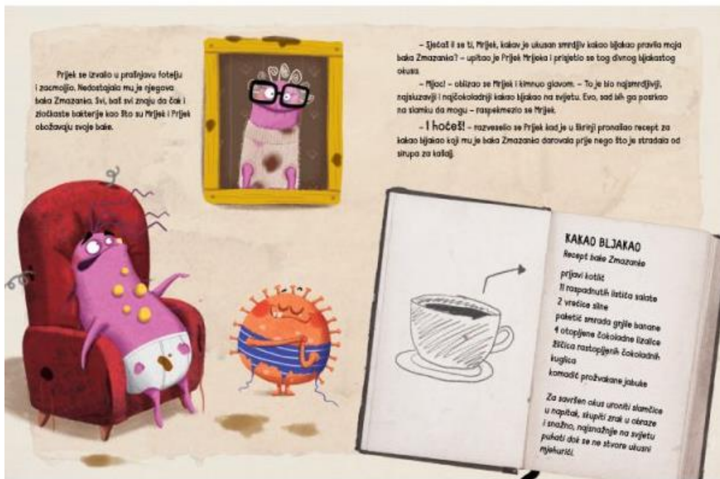
Slika 1: Ilustracije Jelene Brezovec u slikovnici Mrijek i Prljek mučkaju bljakavi napitak (Pervan, 2018)