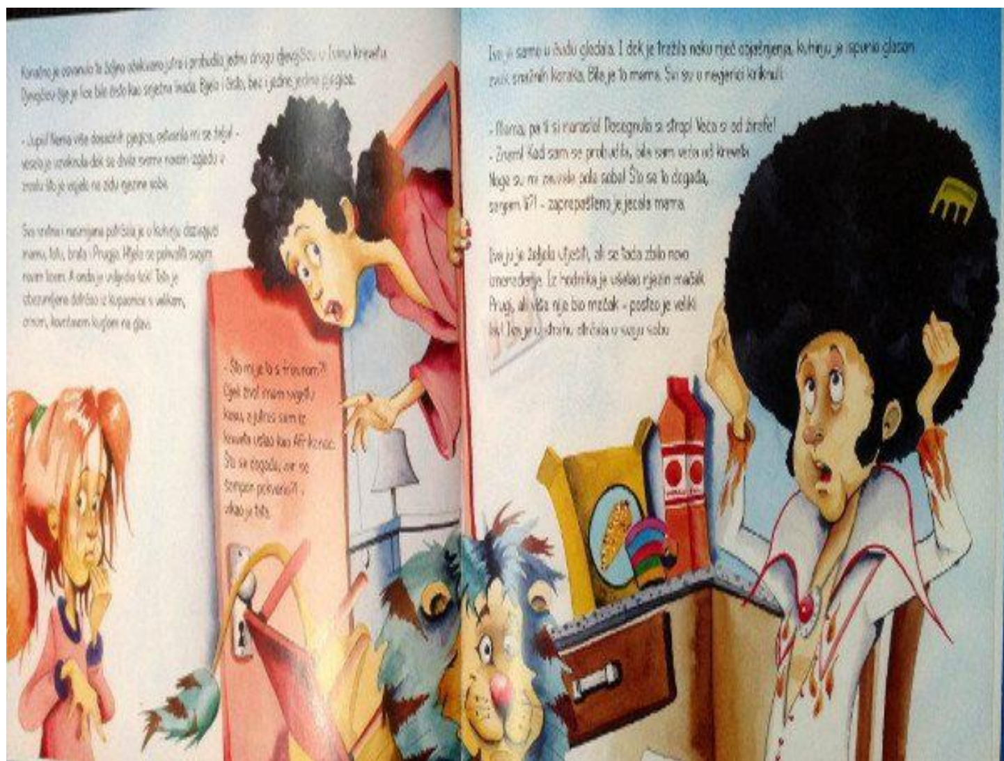
Slika 3: Ilustracije Stjepana Lukića u priči Jelene Pervan Pjegava Iva (Pervan, 2012)

Ukratko, komponente dječje priče, kao što su narativna struktura, likovi, tematika, jezični stil, ilustracije, interaktivnost, humor i vizualna privlačnost, te pristupačnost, zajedno stvaraju bogatstvo dječje književnosti (Hranjec, 2009). Autorica Jelena Pervan vješto koristi ove komponente u svojim djelima kako bi stvorila kvalitetne i privlačne priče za djecu. Njezine priče su primjereno strukturirane, sadrže zanimljive likove i teme, koriste se jezikom koji je prilagođen dječjoj dobi, sadrže estetski privlačne ilustracije i duhovite elemente što ih čini privlačnim i korisnim alatom za razvoj dječje mašte, emocionalne inteligencije i moralnog razumijevanja te poticanje razvoja potrebnih vještina, praksa i vrijednosti. Priče Jelene Pervan za djecu predstavljaju značajan doprinos dječjoj književnosti te pružaju vrijedno