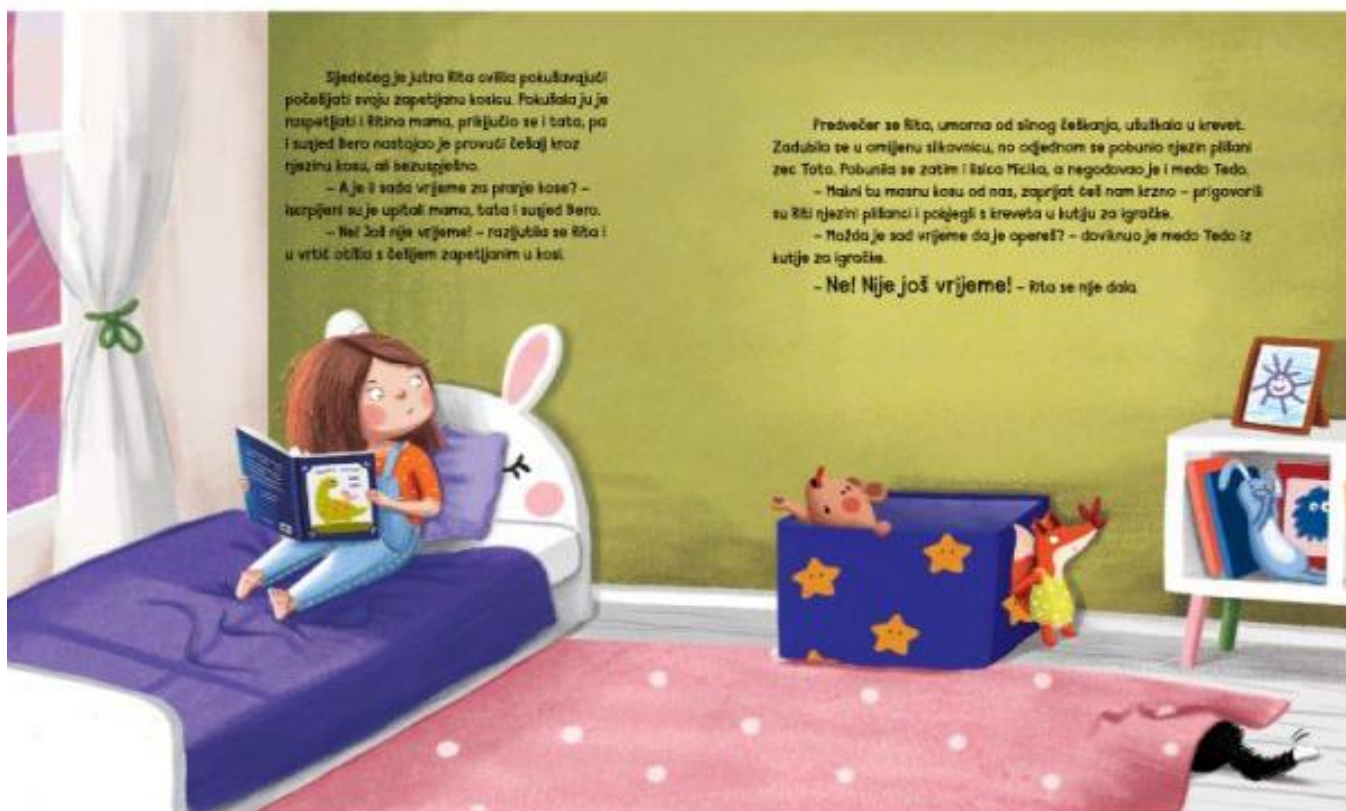
Slika 7: Ilustracije Jelene Brezovec u slikovnici Mrljek i Prljek na smrdljivom putovanju (Pervan, 2018)

Jelena Pervan u svojim slikovnicama koristi jednostavan i pristupačan jezik, riječi su razumljive i jasne, a rečenice većinom kratke i jednostavne. Ovakav jezik omogućuje djeci prilagođeno praćenje priče, razumijevanje radnje i likova te lakše povezivanje s temama koje su obrađene (Težak, 2008). Autorica također koristi igru riječima, ponavljanje i ritam kako bi priče bile zanimljive i privlačne za čitanje. Kroz slikovnicu Hrkalo (2013), Jelena Pervan koristi jednostavne opise i rečenice poput „Koga god da si u toj šumi pitao poznaje li Hrkala, najglasnijeg hrkača na svijetu, svatko bi prstom pokazao na bucmastoga, čupavog stvora koji iz pidžame nije izlazio gotovo nikada.” (Pervan, 2013: 3), „Kad bi Hrkalo hrkao, nitko nije spavao. Šuma se tresla kao da je potres.” (Pervan, 2013: 4) ili „Hm... možda je kao mali sjeo