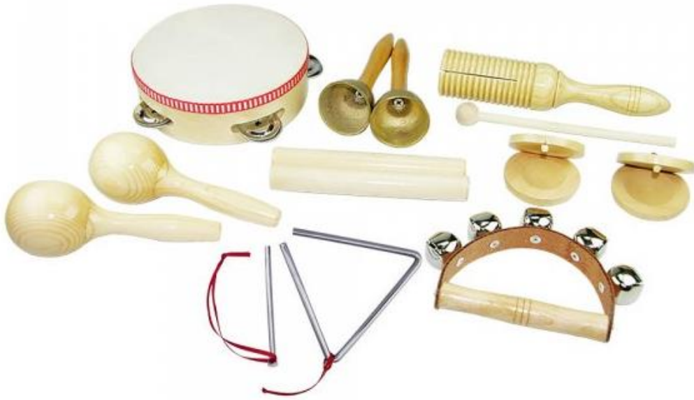
Slika 2. Orffov instrumentarij (Opašić, 2019)