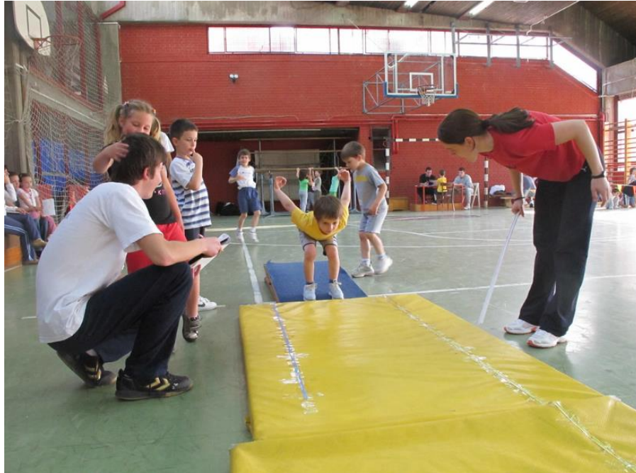
Slika 9: Izvođenje skoka u dalj s mjesta