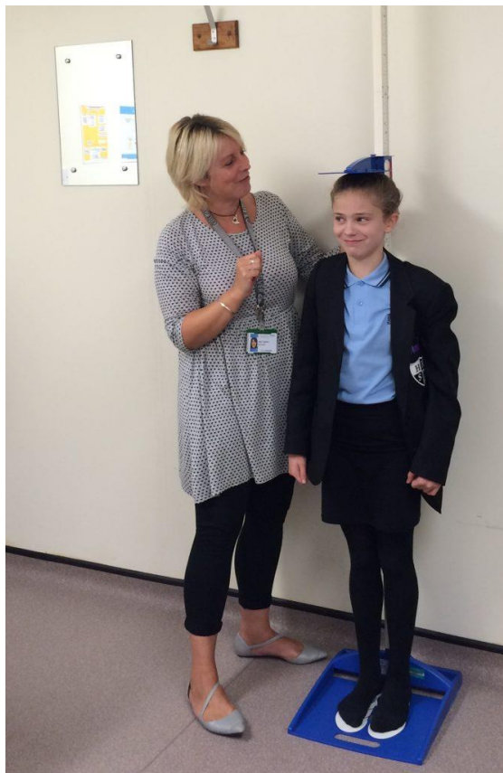
Slika 2: Mjerenje visine tijela, izvor: https://www.healthforkids.co.uk/leicestershire/the-national-child-measurement-programme/

„ Visina tijela (VISINA) mjeri se antropometrom. Ispitanik stoji na ravnoj podlozi; težina je podjednako raspoređena na obje noge. Ramena su relaksirana, pete skupljene, a glava postavljena u položaj tzv. frankfurtske horizontale, što znači da je zamišljena linija koja spaja donji rub lijeve orbite i trans helix lijevog uha u vodoravnom položaju. Antropometar se postavlja vertikalno uz ispitanikova leđa tako da ih dotiče u području sakruma i interskaptularno. Vodoravni krak antropometra spušta se do tjemena glave (točka vertex ) tako da pristanja čvrsto, ali bez pritiska.“