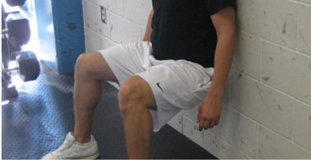
Slika 7: Izdržaj u čučnju do otkaza

održavati pravilan oblik čučnja, gubi ravnotežu ili osjeti preveliki umor u mišićima nogu. Bilježi se vrijeme koje je osoba mogla izdržati u navedenom položaju.