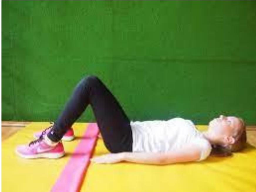
Slika 5: Priprema za test podizanja trupa, izvor: Petranović, B., (2016). FitnessGram TEST (Diplomski rad). Zagreb: Sveučilište u Zagrebu, Kineziološki fakultet