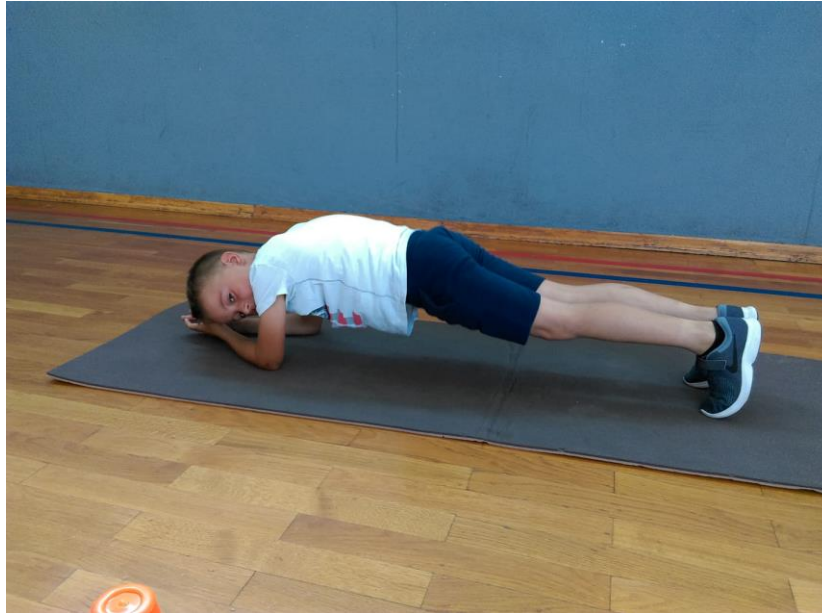
Slika 8: Izvođenje planka, izvor:

https://web.facebook.com/124326551044597/posts/1349659081844665/