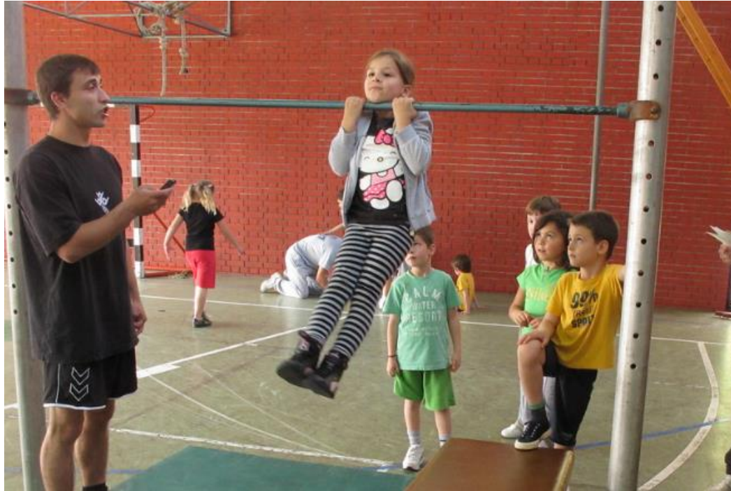
Slika 6: Izvođenje izdržaja u zgibu, izvor:

https://www.flickr.com/photos/pokretzaokret/9248949747/in/album-72157634572168656/