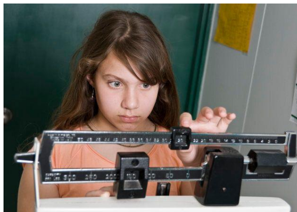
Slika 1: Mjerenje mase tijela

„ Masa tijela (MASA) mjeri se decimalnom vagom s pomičnim utegom ili digitalnom vagom. Prije početka mjerenja vaga se postavlja u nulti položaj.“