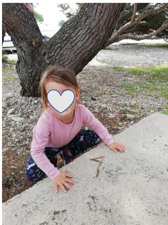
I: Autorska fotografija