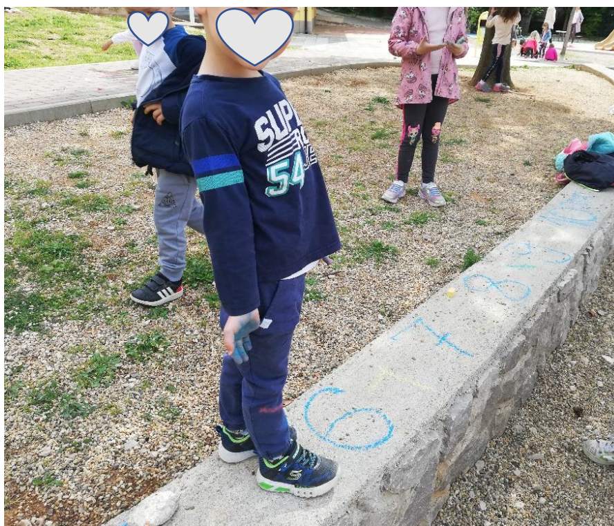
I: Autorska fotografija