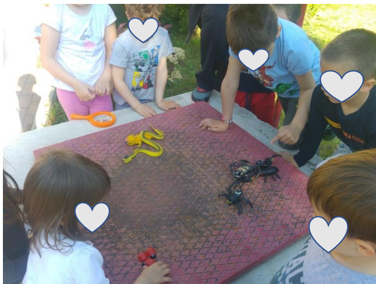
I: Autorska fotografija