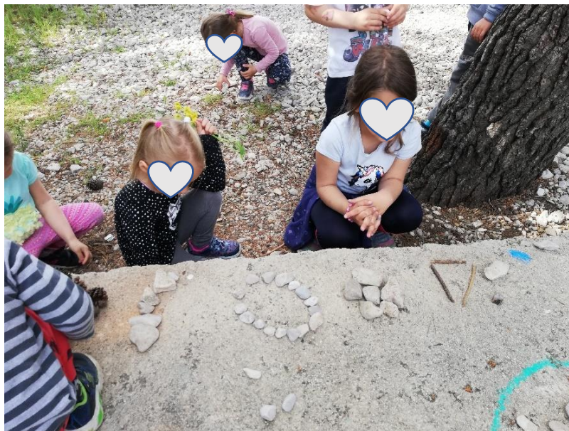
I: Autorska fotografija