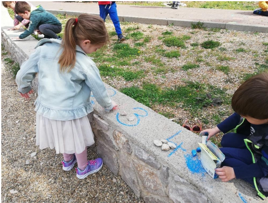
I: Autorska fotografija