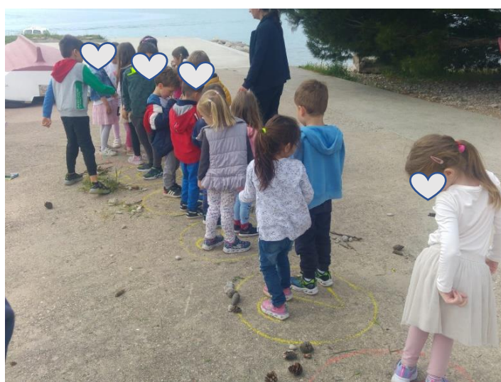
I: Autorska fotografija

Prilog 10. Jedan dječak je došao na ideju da bi mogla djeca stati u krugove (slike)