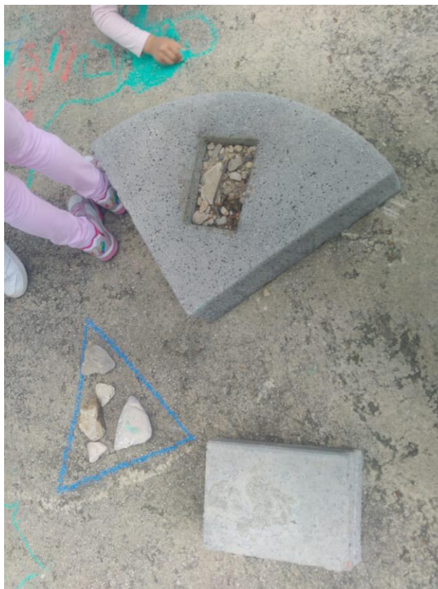
I: Autorska fotografija