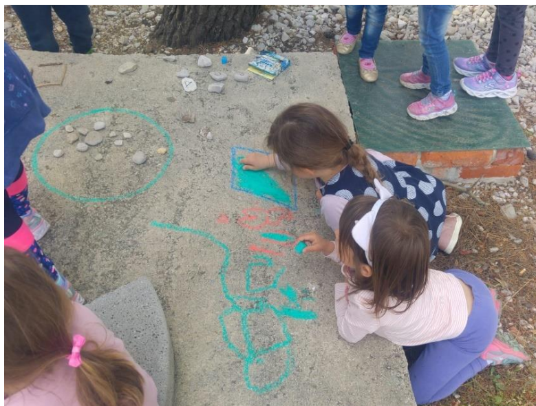
I: Autorska fotografija