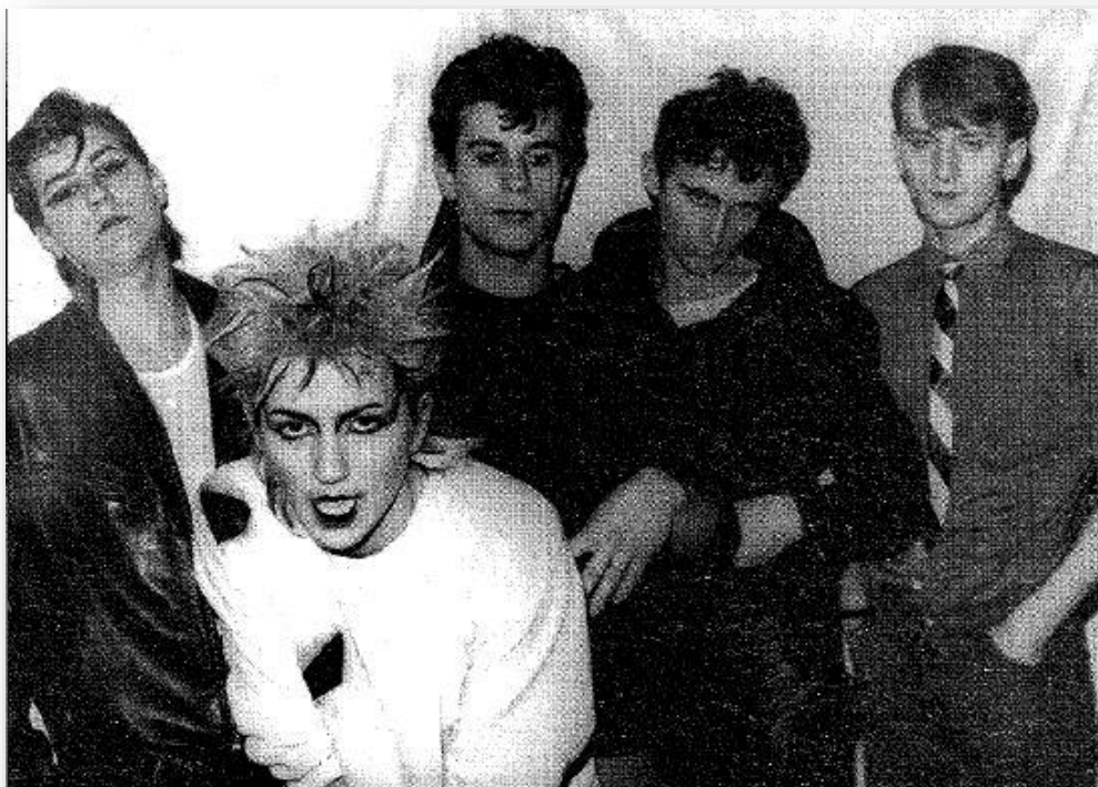
Slika 17. Grupa Paraf na prvom Ri-Rock festivalu 1979. godine ( http://www.formula1-dictionary.net/Big/rijeka_novi_val_parafi.jpg )

Prvi puta Ri-rock festival bio je održan 11. ožujka 1979 godine u dvorani Mladost na Trsatu. Duško Rapotec predstavio se kao organizator ovoga festivala koji je u to vrijeme ujedno bio i klavijaturist u bendu Rađanje. Kasnije se u svojoj karijeri bavio i aranžiranjem, pisanjem i skladanjem najviše pop glazbe. Festival je postavio temelje Riječke rock scene, a trag je vidljiv i danas. Grupe koje su se predstavile na prvom, od milja nazvanog Ri Rock festivalu bile su: Termiti, Naša Stvar, Beta Centaury, Quarter i Rađanje.