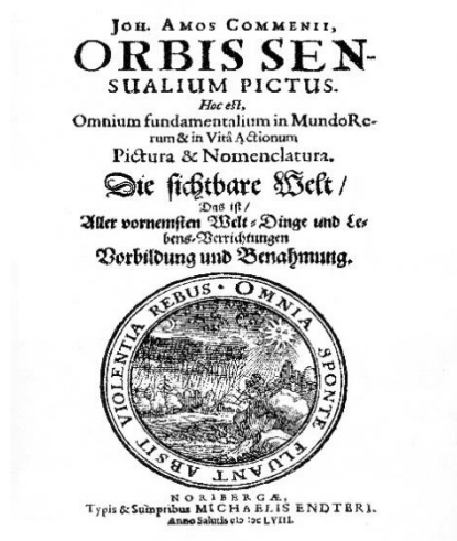
Slika 2- enciklopedijski rječnik Orbis sensualium pictus 3

Slikovnica je socijalni, povijesni i kulturni dokument koji čine tekst, ilustracije i dizajn. Ona je proizvodni i komercijalni predmet koji kao umjetnički oblik obuhvaća međuovisnost ilustracije i teksta te dramu listanja stranica na pozornici dvostranice (Hameršak i Zima, 2015).