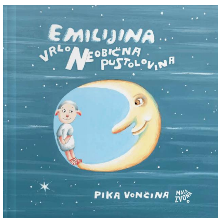
Slike 14 Emilijina vrlo neobična pustolovina 21