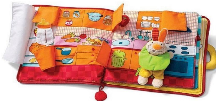
Slika 11 Slikovnica-igračka 11