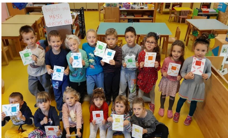
Slika 23 aktivnost u vrtiću povodom Mjeseca knjige 32

Velika je uloga odgajatelja u kreiranju poticaja i provođenju aktivnosti u svrhu poticanja razvoja govorno-jezičnih sposobnosti djece. Provođenjem aktivnosti između odgajatelja i djeteta stvara se socioemocionalna veza koja se svakodnevno razvija uspostavljanjem komunikacije. Važno je da odgajatelj organizira različite aktivnosti u svrhu uspostavljanja verbalne komunikacije s djecom. Na taj način razumije njihov govor. Aktivnosti koje su vođene interesima djece prirodno motivira dijete za korištenje govora u različitim načinima. Komunikacija odgajatelja i djeteta odvija se praktičnim aktivnostima, a jedna od važnijih aktivnosti jest zajedničko čitanje slikovnica. Komunikacija između odgajatelja i djeteta važna je jer potiče razvoj govora djeteta (Petrović-Sočo, 1997). Mnogi vrtići provode svakodnevne aktivnosti povezane sa slikovnicom i čitanjem, a u nekima su provedeni i cijeli projekti vezani za isto. U nastavku ćemo navesti neke od zanimljivih projekta provedeni u zajedničkim aktivnosti odgajatelja i djece, a u neke su uključeni i roditelji djece.