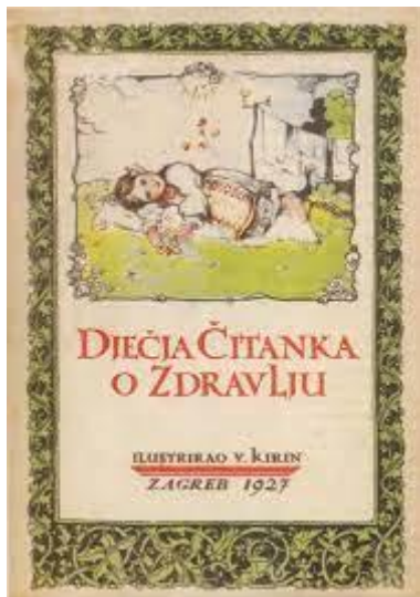
Slika 7-Basne 8