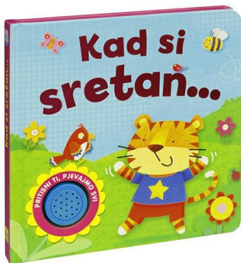
Slika 12 Multimedijalna slikovnica 12

S obzirom na strukturu izlaganja slikovnice dijelimo na tematske i narativne. Narativne slikovnice najčešće su prerade bajki, a sastoje se od više kraćih priča ili jedne koja se proteže kroz cijelu slikovnicu. Narator priče je sam pripovjedač. U tematskim slikovnicama prikazuju se situacije iz svakodnevnog života, a teme su različite: djetetova obitelj, prijatelji, kućni ljubimci i slično. Mogu biti poučne i umjetničke. Prema korištenim likovnim tehnikama slikovnice mogu biti lutkarske, fotografske, strip, razni crteži i interaktivne slikovnice. Fotografske slikovnice sastoje se od različitih fotografija, lutkarske od lutaka raznih materijala, strip-slikovnice spajaju strip i ilustracije, slikovnice crteža od raznih radova i interaktivne nastaju praćenjem djetetova interesa i motiviranosti. Prema sudjelovanju recipijentata slikovnice možemo podijeliti na one koje dijete čita samostalno i one za čije je čitanje potrebno aktivno sudjelovanje odgajatelja i roditelja. Uloga pripovjedača je posredovanje između slikovnice i djeteta, odnosno veza među tekстом i slikama (Majhut i Zalar 2008).