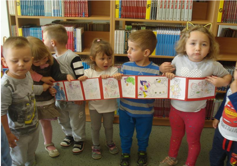
Slika 21 Aktivnost izrade slikovnice u vrtiću 15

neplanirano, vođene dječjim interesom imaju veliku vrijednost u odgojno-obrazovnom radu. U aktivnostima u kojima je uključena slikovnica važno je pripremiti prostorno materijalno okruženje u skupini, kao i pozitivno ozračje među djecom (Šišnović, 2011).