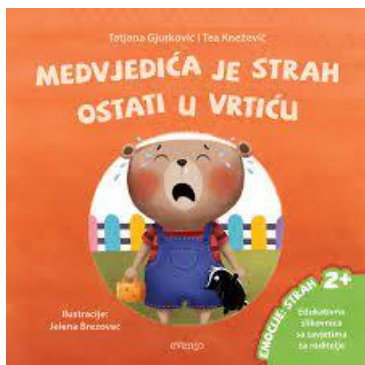
Slika 1 -Primjer problemske slikovnice 1

Slikovnica mora biti sigurno izrađena kako se dijete ne bi ozlijedilo, mora biti pedagoški ispravna, da su slike i tekst namijenjeni upravo djetetu. Ilustracije moraju biti šarene i djetetu privlačne, pobuditi dječju maštu i učiti ih pravim vrijednostima. Tekst koji prati ilustracije mora biti jasan, jednostavan, zanimljiv, ali i gramatički i pravopisno točan kako bi djeca pravilno usvojila riječi i bogatila vokabular. Poželjno je i da tekst bude pisan velikim tiskanim slovima