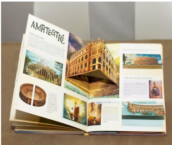
Slika 9: Pop up slikovnic