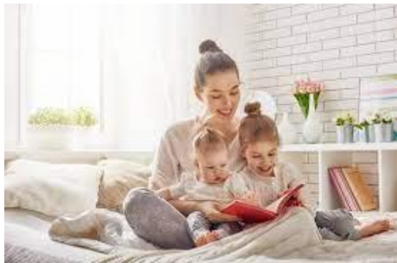
Slika 22 Roditelj čita djeci slikovnicu 16