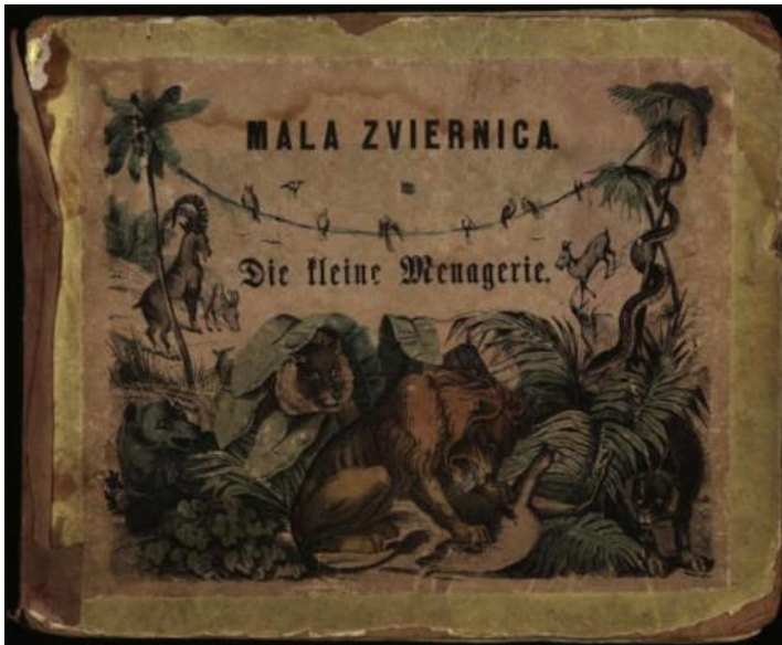
Slika 4- Mlaises Robinzon 5