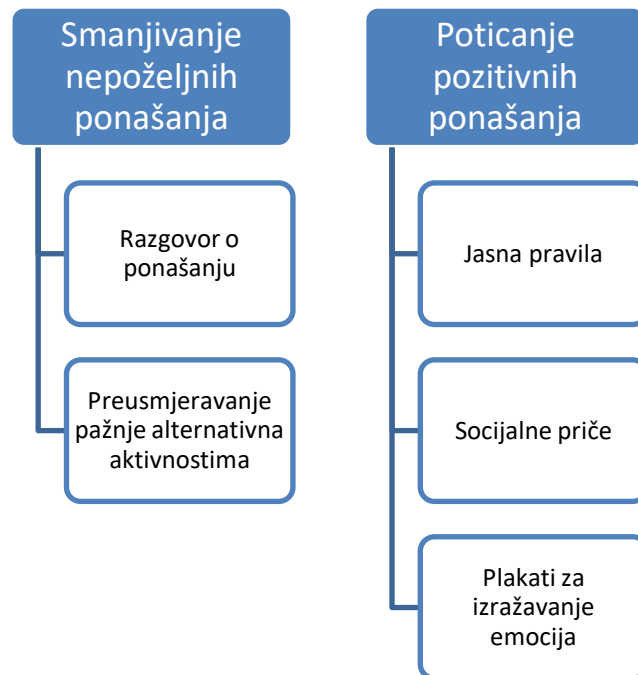
Slika 6. Aktivnosti pomoćnika u nastavi u pružanju podrške

Na slici 6 su prikazane aktivnosti pomoćnika u nastavi kod smanjivanja nepoželjnih oblika ponašanja kod učenice s poremećajem iz spektra autizma kroz metode razgovora o ponašanju kao i preusmjeravanje pažnje alternativnim aktivnostima. Na poticanje pozitivnih ponašanja kod učenice u radu je vrlo važno da budu iskazana jasna pravila. Kao dobar model u radu pokazale su se socijalne priče i plakati za izražavanje emocija. U dimenziji socijalne uključenosti i socijalnoj uključenosti sastojala se u tome da se učenicu poticalo na suradnju sa drugim učenicima.