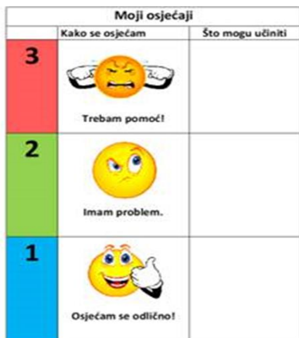
Slika 7: Prikaz plakata za razvoj socijalne komunikacije kod učenice

Na slici 7 nalazi se plakat za razvoj socijalne komunikacije na kojem se nalaze slike koje opisuju emocije (ljutnja, zabrinutost, sreća). Učenica iskazuje kako se osjeća putem izabrane slike i kroz poticanje izražavanja svojih emocija učenica se uči nositi sa njima.