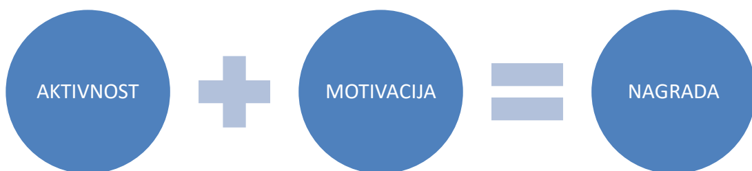
Slika 4: Prikaz situacija regulacije u ponašanju kod učenice s poremećajem iz spektra autizma

Na slici 4 je grafički prikaz regulacije u ponašanju kod učenice s poremećajem iz spektra autizma. Sa učenicom su dogovorena pravila o pozitivnom odnosu prema školskim aktivnostima. Na kraju nastavnog tjedna, a pri obavljanju svih aktivnosti i zadataka koje su bile predviđene učenica odlazi sa roditeljima u trgovinu sa dječjim igračkama gdje si izabire igračku