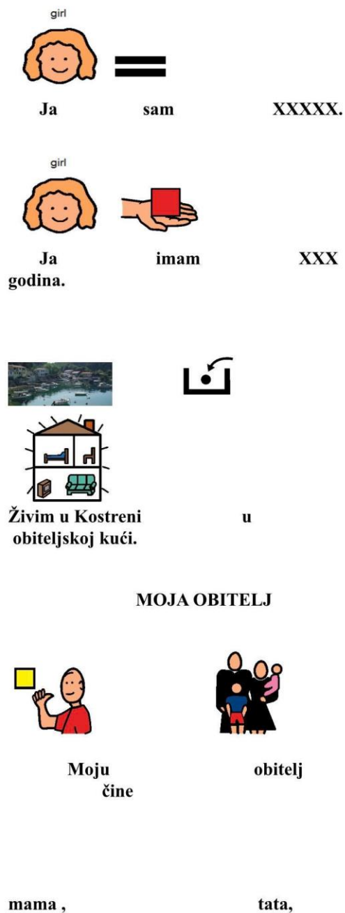
Slika 8: Prikaz stranice iz virtualne slikovnice - socijalna priča

Tijekom online nastave za učenicu je izrađena slikovnica u formi socijalne priče i oblikovana prema razvojnom statusu i potrebama učenice (Slika 8-9).