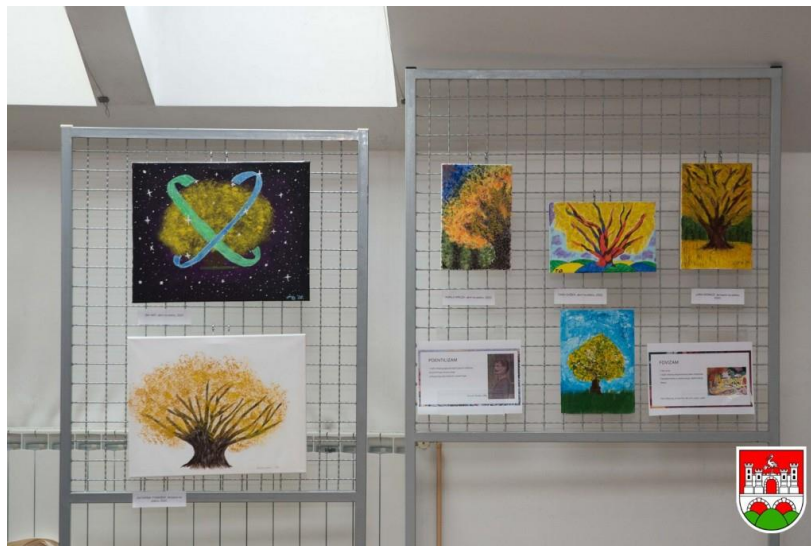
Slika1. Fotografija-Izložba dječjih radova (starija vrtićka grupa)