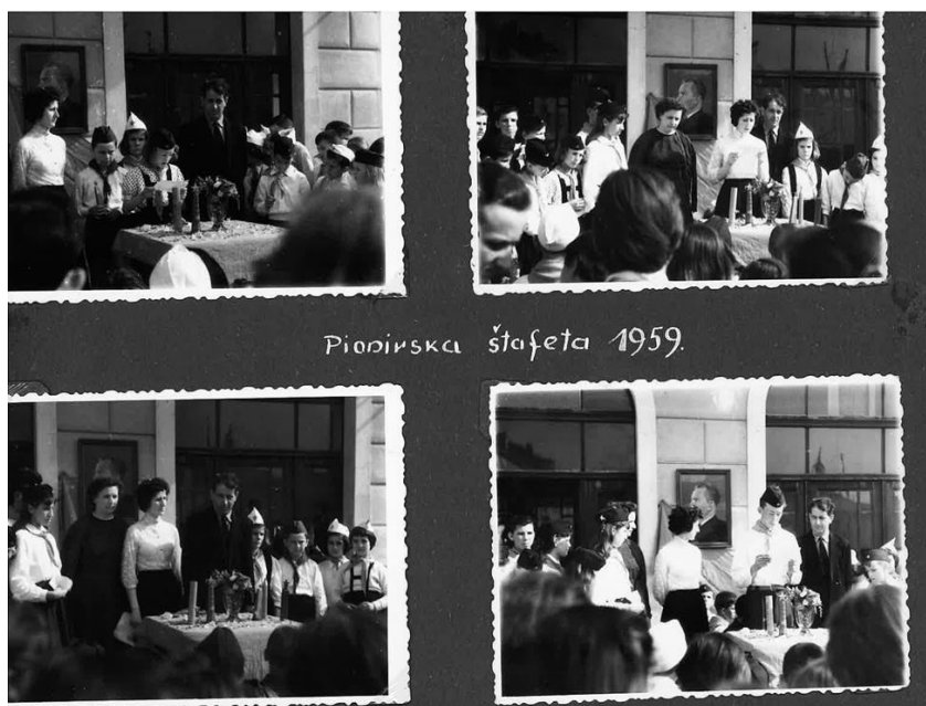
(Fotografije iz arhive Dječjeg vrtića Girice)

Kao što se vidi na Slici 1 u Cresu su se održavale manifestacije Pionirska štafeta. Manifestacija Pionirske štafete pokrenuta je 1945.godine kao oblik proslave Titovog rođendana koji je bio 25. svibnja. Štafetne palice prenosile su se iz svih krajeva Jugoslavije kako bi na poslijetku došle do predsjednika. Štafeta su predsjedniku predavali najbolji učenici, studenti i radnici koji bi mu prilikom predaje štafete pročitali pripremljenu rođendansku čestitku. Pionirska štafeta sa sobom je nosila veliki republički značaj te je služila kao sredstvo ublažavanja Tita kao kulta ličnosti te se sva pažnja usmjeravala na mlade kao nositelje budućnosti. ( Duda ,2015)