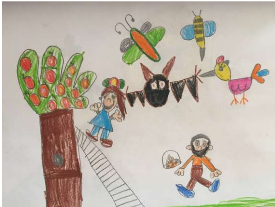
Slika 6: Dječak L. P. – 6 godina

Na ovom likovnom uradku prije svega se ističe kombiniranje likovnih tehnika (olovka i drvene boje), a zatim i fluentnost. Fluentnost je uočljiva u raznovrsnosti i bogatstvu likovnih elemenata (boje, crta, točaka...), kojima se prikazuju bića na slici, čime je predočena dinamika radnje branja jabuka. Osjetljivost za prikaz likovnog problema uočava se i u pojavnosti šišmiša među ostalim dnevnim životinjama.