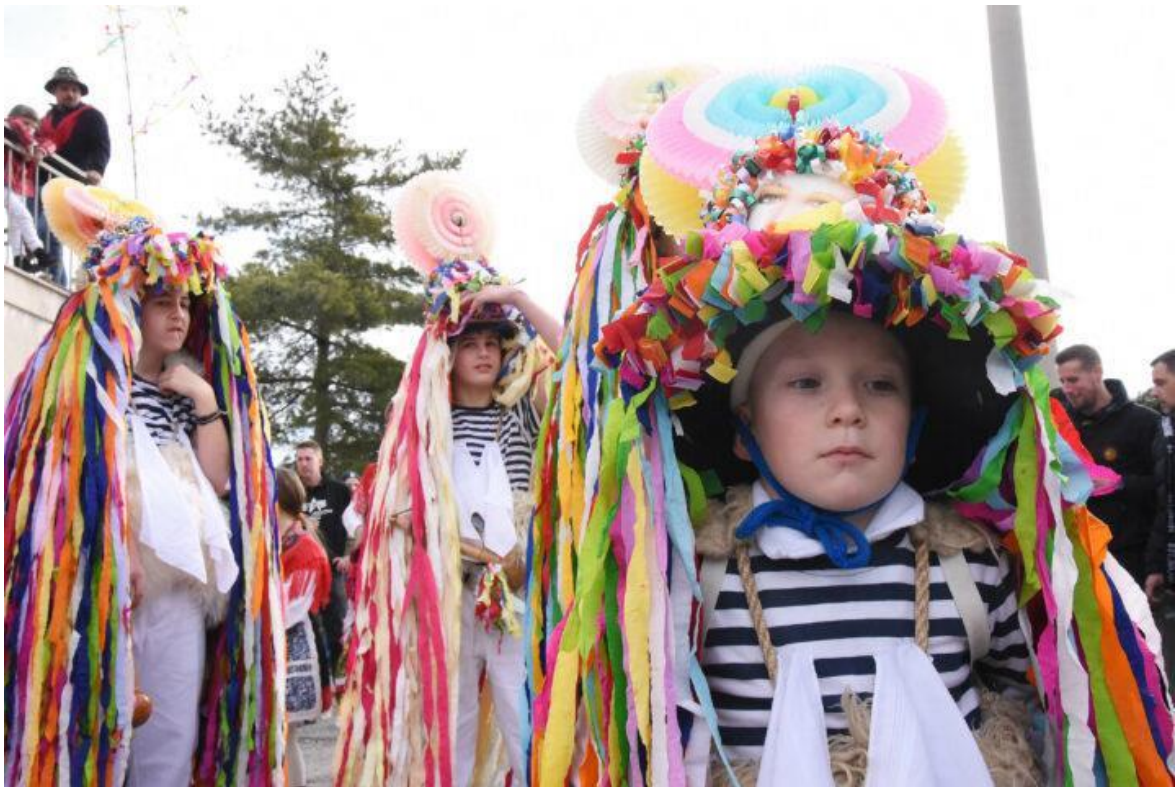
Slika 3. Matuljski zvončari