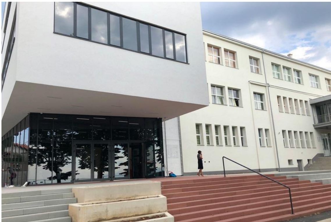
Slika 4. Osnovna škola dr. Andrije Mohorovičića, Matulji