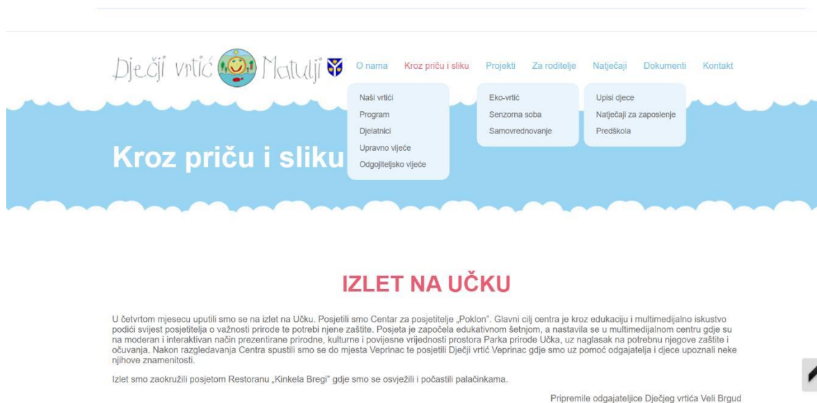
Slika 1. Stranica Dječjeg vrtića Matulji