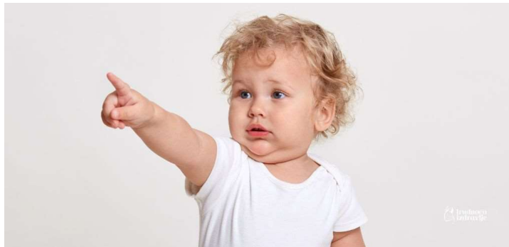
Slika 1: Pokazivanje kažiprstom