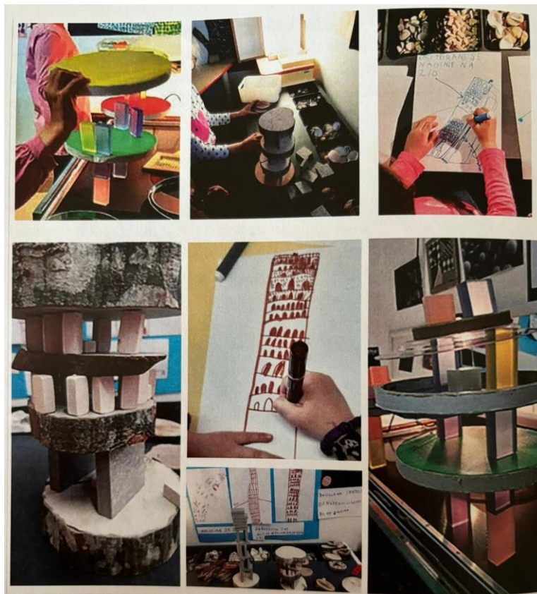
Slika 8: Izrada Kosog tornja od različitih materijala (Slunjski, 2020)

Djeca u Reggio aktivnostima dočaravaju iste predmete različitim tehnikama. Tako su sudjelovala u projektu kroz koji su proučavala različite ekspresivne medije, a što je dovelo do raznolikih pravaca u kojima su se aktivnosti odvijale. Tako je jedna zadana tema istraživana iz više kuteva i područja. Djeca su imala potpunu autonomiju da zadovolje znatiželju i vlastite interese, ali i slobodu da sami odaberu tehniku kojom će se izraziti. Tema projekta bila je Kosi toranj, a djeca su ga izrađivala od drveta, od kocaka, crtala ga flomasterima i bojicama. Iz priloženih fotografija (slika 6) vidljiva je raznolikost dječje ekspresivnosti.