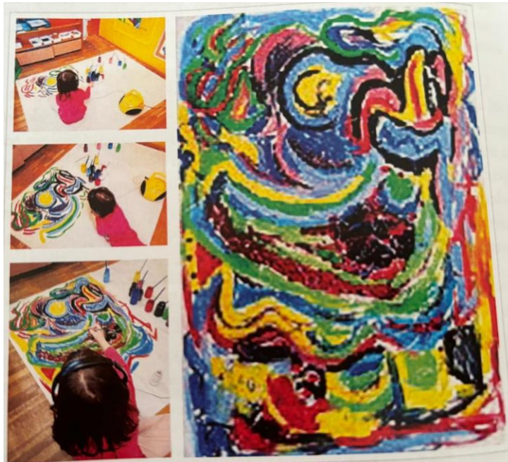
Slika 2: Doživljaj glazbe (Slunjski, 2020)

U Reggio pristupu djeca prikazuju na papiru i zvukove dok slušaju glazbu. Pri svakoj promjeni ritma djeca mijenjanju položaje i kretanja tijela što se prenosi i na njihova umjetnička djela (Slunjski, 2022). U Reggio pristupu važna je i analiza djela koja se ne odvija klasičnom evaluacijom odraslih na lijepo ili ne, već se nastoje otkriti kontekst u kojem je djelo nastalo. Tada odgojitelj razmišlja o prethodnim iskustvima djece, o komunikaciji s odgojiteljem tijekom nastanka rada, o atmosferi u prostoriji i slično (Ibid.).