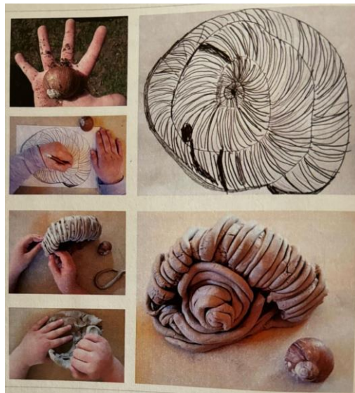
Slika 1: Doživljaj školjke (Slunjski, 2020)

U likovnim aktivnostima koja su inspirirana Reggio pristupom djeca prikazuju način na koji vide i razumiju svijet. Tako primjerice djeca raznim likovnim tehnikama dočaravaju način na koji vide svakodnevne predmete. Djeca prvo gledaju predmet koji crtaju/oblikuju kako bi prikazali predmet kako ga oni vide. U jednoj su aktivnosti djeca crtala i oblikovala školjku. Prvo su gledala njezina vizualna svojstva, a zatim su crtala školjku olovkom i oblikovala glinom. Uloga odgojitelja bila je da djeci pomogne uvidjeti vizualna svojstva školjke, to jest njezinu autonomiju, no u realizaciji djeca imaju potpunu slobodu (Slunjski, 2022).