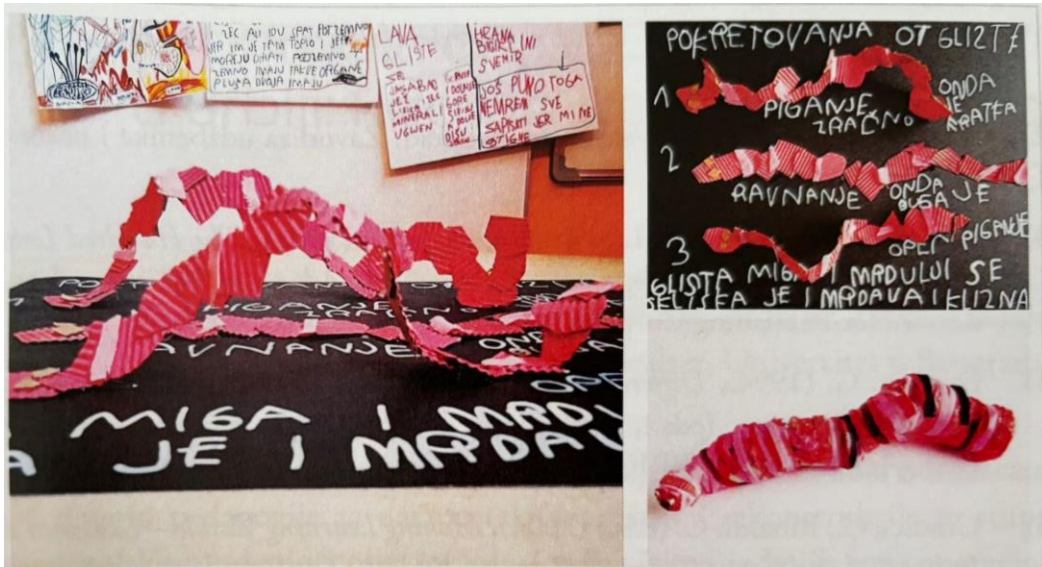
Slika 12: Prikaz kretanja gusjenice (Slunjski, 2020)

U jednoj od aktivnosti djeca dočarala su kretanje gusjenice kolažem jer je to mnogo podobnija tehnika za prikaz kretanja od primjerice olovke. U Reggio pristupu važno je da djeca istražuju različite medije jer svaki ima posebna svojstva, a prema kojima se odbire za ono što se želi dočarati. Djeca su išla i korak dalje i prema tome što je tehnika kolaža za to pogodna prikazali kretnju gliste u fazama (pomicanje, ravnjanje i pomicanje). Ovime su djeca pokazala duboko razumijevanje onoga što su proučavala (kretnju gusjenice) primjerenom tehnikom koju su sama odabrala.