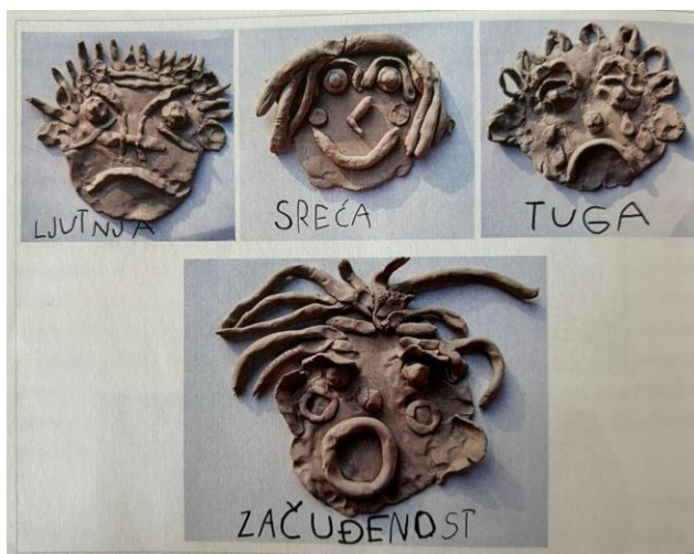
Slika 4: Prikaz emocija na licu čovjeka (Slunjski, 2020)