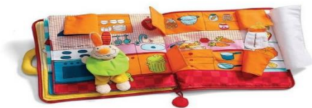
Slika 3. Interaktivna slikovnica “Zeko ide na spavanje”

Preuzeto s https://babyroom.hr/proizvod/interaktivna-slikovnica-zeko-ide-na-spavanje/ preuzeto 30.3.2023