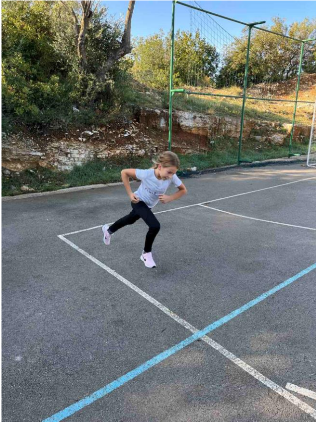
Slika 11. Test trčanje 3 minute

Na slici 11. prikazan je test trčanja 3 minute. U ovom se testu mjeri koliko će učenik metara preći unutar vremenskog ograničenja od 3 minute. „Ovim se testom provjerava funkcionalna sposobnost učenika, tj. procjena aerobne izdržljivosti. Za izvođenje ovog testa, potrebna je štoperica. Ovaj test se organizira na način da se najprije postavlja oznaka na ravnoj površini od najmanje 10-20 metara.“ (Pejčić i Trajkovski, 2018). Učeniku je zadatak da iz visokog starta krene trčati 3 minute na učiteljev znak. Učenik trči sve dok učitelj ne daje znak za kraj trčanja. Mjerenje se zaustavlja onog trenutka kada učenik krene hodati prilikom izvođenja. Rezultat bilježimo u prijeđenim metrima.