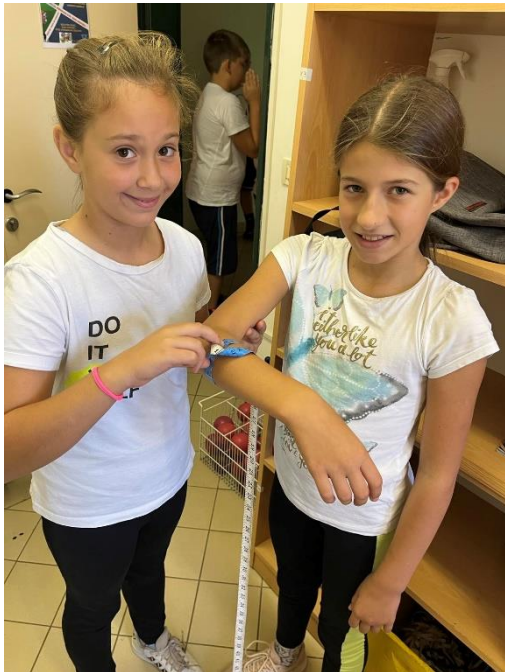
Slika 3. Mjerenje opsega podlaktice (kratica: AOP)

Na slici 3. prikazan je način na koji se mjeri opseg podlaktice. Kratica AOP, označava A- antropometrijska karakteristika, O- opseg i P- podlaktice. Ova se antropometrijska karakteristika mjeri pomoću platnene ili metalne mjerne vrpce. Mjeri se na način da učenik stoji s opuštenim rukama uz tijelo, a treba se stajati u uspravnom stavu. Proces mjerenja zahtijeva da se na cijelu osovinu oko lijeve podlaktice postavi mjerna vrpca i rezultat čitamo s mjesta najvećeg opsega. Rezultat kasnije zapisujemo u milimetara s točnosti od 0,1 cm.