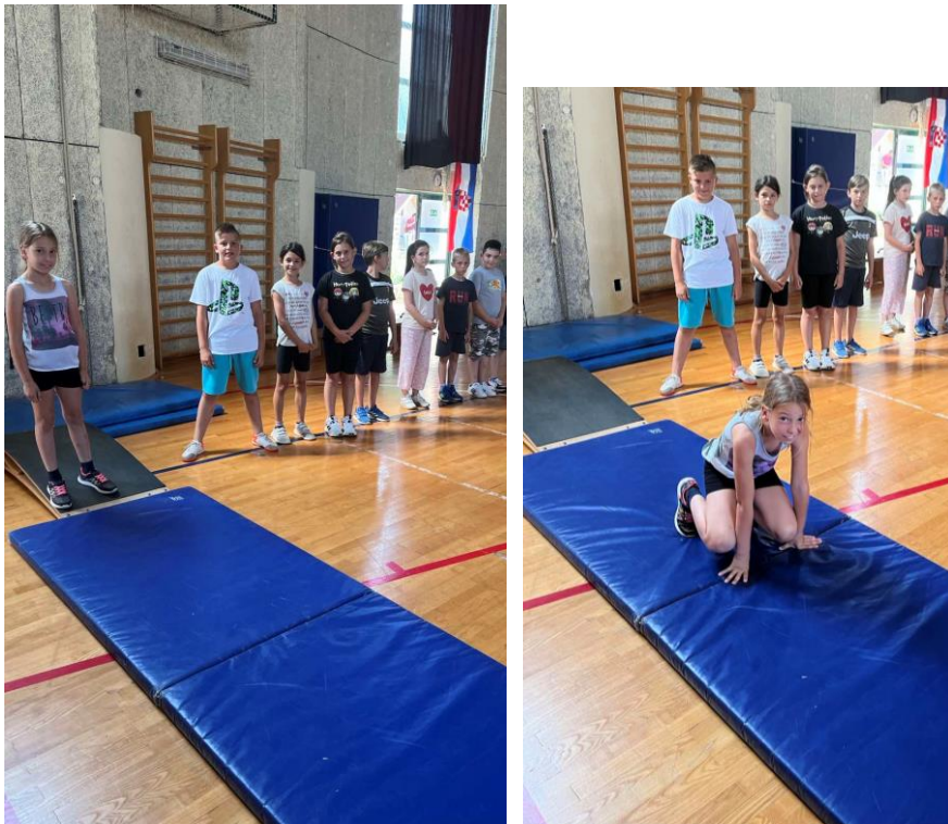
Slika 9. Skok u dalj s mjesta (kratica: MSD)

Na slici 9. prikazan je skok udalj s mjesta, a kratica mu je MSD, slova kratice označavaju M- motorička sposobnost, S- skok i D-udalj s mjesta. Jedan od testova motoričke sposobnosti kojom se procjenjuje eksplozivna snaga nogu učenika je upravo skok u dalj.