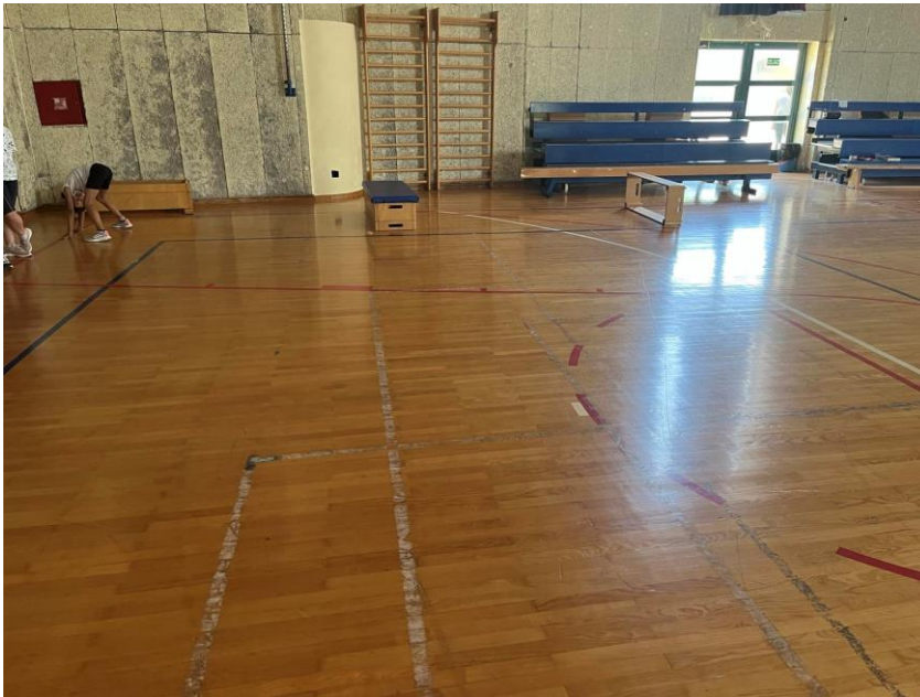
Slika 7. Poligon natraške (kratica: MPN)

Na slici 7 prikazan je poligon natraške, a kratica mu je MPN što označava M-motorička sposobnost, P- poligon i N- natraške.