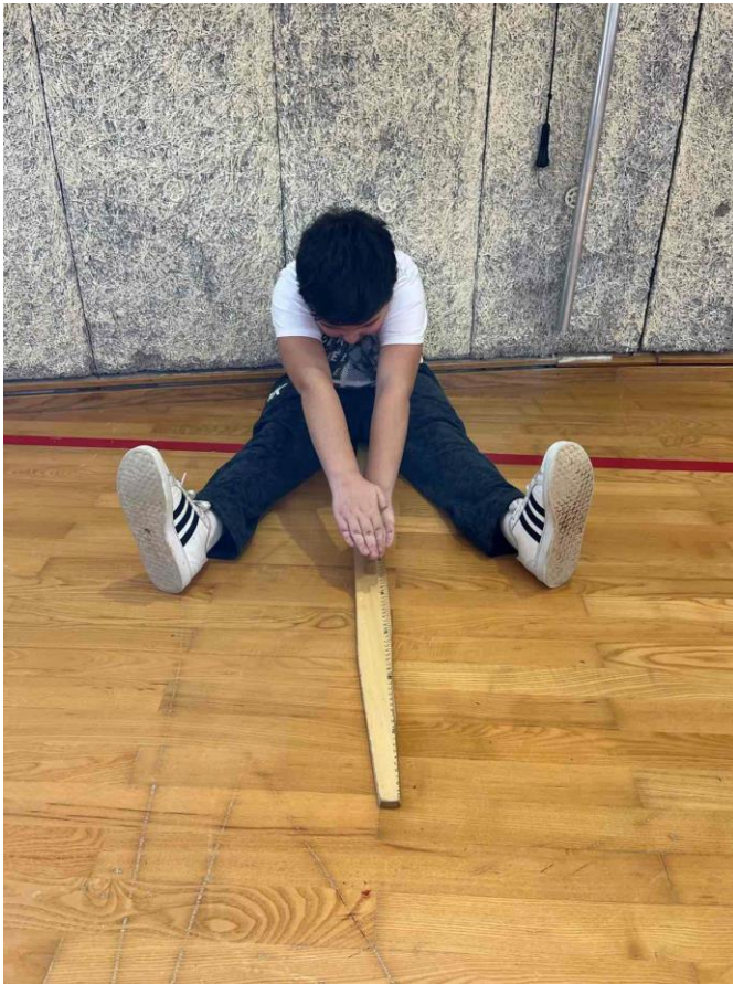
Slika 8. Pretklon raznonožno (kratica: MPR)

Na slici 8. prikazan je pretklon raznonožno, kratica mu je MPR, a slova kratice označavaju M- motorička sposobnost, P- pretklon te R-raznonožno. Pretklonom raznonožno procjenjuje se fleksibilnost učenika, a spada pod motoričke sposobnosti. Fleksibilnost definiramo kao sposobnost maksimalne amplitude pokreta. Ovaj test izvodi se uz pomoć drvenog krojačkog metra na kojemu su ucrtani centimetri. “Učenik koji izvodi vježbu nalazi se u sjedećem položaju na podu, mora biti naslonjen leđima i glavom o zid. Učitelj povlači dvije crte dužine od dva metra koje se nalaze pod kutom od 45^{\circ} . Noge učenika se postavljaju na povučene crte označene na podu. Učenik potom spušta ruke na pod, treba ih ispružiti na način da postavi desni dlan preko lijevog. Od vrha učenikovih prstiju, učitelj postavlja metar od oznake 0 na pod. Učeniku je cilj napraviti što dublji pretklon tako što bi klizio vrhovima prstiju po metru na podu. Na desnoj strani, udaljenoj 50 cm od učenika, nalazi se učitelj koji očitava test. Vježbu, učenik izvodi 3 puta, te učitelj zapisuje najbolji rezultat. Rezultat se očitava u centimetrima.“ (Pejčić i Trajkovski, 2018)