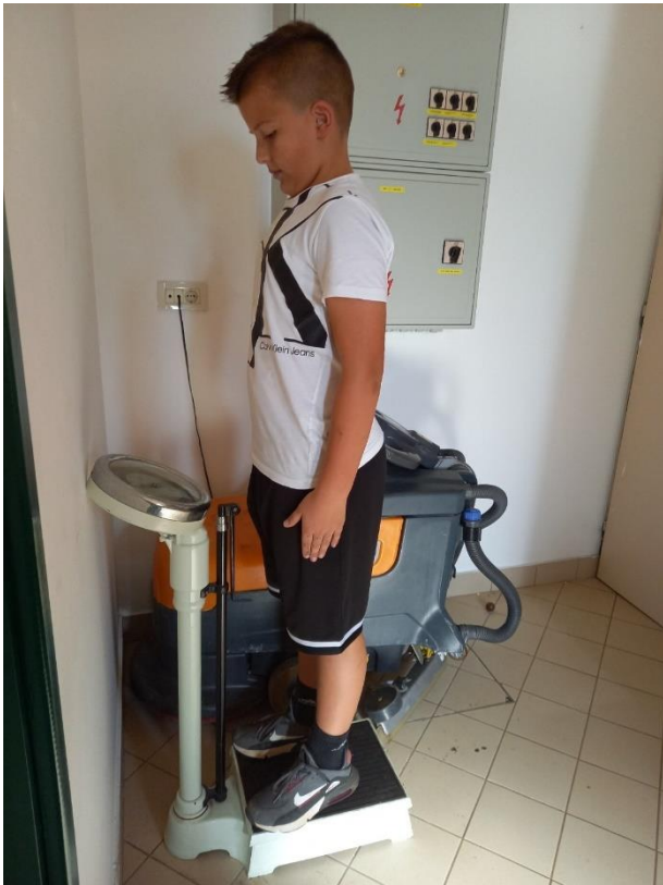
Slika 1. Mjerenje tjelesne težine (kratica: ATT)

Na slici 1 prikazan je način na koji se mjeri tjelesna težina, tj. mase tijela. Kratica ATT označava, A- antropometrijska karakteristika, T- tjelesna i T- težina. Ova antropometrijska karakteristika jedna je od karakteristika na koju možemo utjecati tijekom života. Ovisno o zadanom cilju, tjelesna se težina može povećavati ili smanjivati. Ukoliko želimo regulirati tjelesnu težinu, na nju možemo utjecati kombinacijom tjelovježbe i pravilne prehrane. Težinu je moguće mjeriti uz pomoć medicinske decimalne vage ili one koje posjedujemo u našim domovima, odnosno kućne vage. Ona se mjeri na način da pojedinac, odjeven u laganu sportsku odjeću, bez tenisica stane na vagu. Bitno je da ispitanik, odnosno učenik, stoji u ispruženom stavu i mirno. Učitelj postavlja kazaljke na nulti položaj i tek onda učenik staje na vagu. Potom se dobiveni rezultat, zaokružuje s točnošću od minimalno 0,5 kilograma.