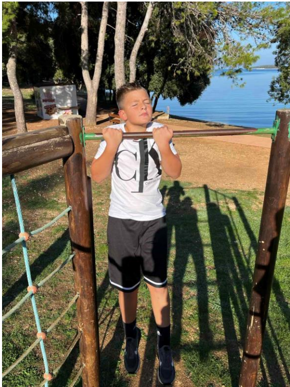
Slika 6. Izdržaj u visu zgibom (kratica: MIV)

Na slici 6. prikazano je mjerenje izdržaja u visu zgibom. Kratica je MIV i ona označava, M- motorička sposobnost, I- izdržaj i V- vis zgibom. „Ovim se testom provjerava motorička sposobnost, tj. učenikova statička snaga mišića ruku i ramenog pojasa. Definicija statičke snage bila bi da je to sposobnost dugotrajnog izometrijskog naprezanja mišića ruku i ramenog pojasa.“ (Pejčić i Trajkovski, 2018.). Ovaj test, kao i prethodni mjerimo uz pomoć štoperice. Dodatni materijali koji su potrebni za izvođenje su stolice, preče i dvije strunjače. „Za izvođenje ovog testa, bitno je pravilno pripremiti ispitno mjesto na način da se postavi preča, a ispod preče dvije strunjače i na strunjaču se postavi stolac. Učenik uz pomoć stolca se podiže kako bi dohvatio preču i postavlja ruke u širini ramena. Učenikova se brada mora nalaziti u visini preče i kada se učenik pravilno namjesti, učitelj izmiče stolac. Cilj je da učenik izdrži što duže u tom položaju, odnosno najviše 120 sekundi. Učitelj zapisuje učenikov prvi pokušaj, a vrijeme se mjeri dok god je učenik u pravilnom položaju. Također, prilikom izvođenja ove vježbe nije dozvoljeno spuštanje brade ispod preče, savijanje nogu i tijela ili dodirivanje preče bradom i trzanje.“ (Pejčić i Trajkovski, 2018.)