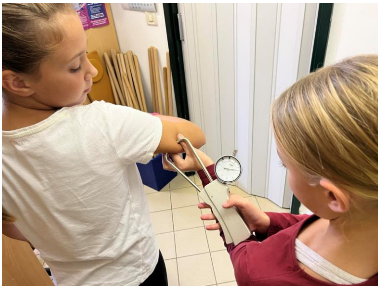
Slika 4. Mjerenje kožnog nabora nadlaktice (kratica: ANN)

Na slici 4. prikazan je način na koji se mjeri kožni nabor nadlaktice tj. kožni nabor nad tricepsom. Kratica ANN označava, A-antropometrijska karakteristika, N-nabor, N-nadlaktice. Ova se antropometrijska karakteristika mjeri uz pomoć kalipera.“ On je podešen na pritisak od 10 g/mm 2 . Rezultate iščitavamo u milimetrima. Ruke stoje uz tijelo, moraju biti opuštena, a test se provodi tako da učenik stoji u uspravnom položaju. Pomoću palca i kažiprsta, učitelj podiže kožni nabor učenika uzdužno na zadnjoj lijevoj strani nadlaktice. Ovdje je bitno da učitelj ne zahvati mišićno tkivo. Pomoću kalipera, učitelj treba zahvatiti kožni nabor uz pritisak od 10g/mm 2 , a potom očitava rezultat. Triput se bilježi mjerenje te se potom bilježi srednji rezultat koji očitavamo 2 sekunde nakon pritiska s točnošću od 1 mm.“ (Pejčić i Trajkovski, 2018.) „Brojnim istraživanjima utvrdilo se postojanje većeg broja tzv. primarnih motoričkih sposobnosti: snage (eksplozivne, statičke, repetitivne), brzine, koordinacije, ravnoteže, fleksibilnosti i preciznosti“ (Pejčić i Trajkovski, 2018:56). Kada govorimo o motoričkim sposobnostima u školstvu, tada trebamo imati na umu da se ne procjenjuju preciznost i ravnoteža. „Temeljem šest varijabli, u školi se procjenjuju motoričke sposobnosti. Šest varijabli jesu taping rukom ili MTR, skok u dalj s mjesta ili MSD, pretklon raznonožno ili MPR, poligon natraške ili MPN, izdržaj u visu zgibom ili MIV, te podizanje trupa MPT.“ (Pejčić i Trajkovski, 2018.)