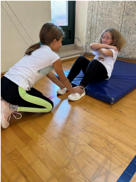
Slika 5. Podizanje trupa (kratica: MPT)

Na slici 5. prikazan je test podizanja trupa, kratica je MPT, a označava M- motorička sposobnost, P- podizanje, T-trupa. Ovaj je test motorička sposobnost učenika kojom se procjenjuje repetitivna snaga trupa. Ponavljanje određenog pokreta s minimalnim opterećenjem, definicija je repetitivne snage. Ovaj se test provodi pomoću štoperice i strunjače. Učenik se smjesti u ležeći položaj na strunjaču, učenikove noge moraju biti pogrčene ( 90^\circ ), a stopala moraju biti postavljena u širini kukova. Početna poza koju učenik zauzima je postavljanje ruka u križ te dlanovi moraju biti na ramenima. Najbolje je da učitelj najprije demonstrira položaj, a potom ga učenik sam izvodi uz pomoć suvježbača. Suvježbač ima ulogu pomoćnika, dakle, on pridržava učenikova stopala kako bi se učenik koji izvodi vježbu, mogao što brže podići u sjedeći položaj. Učenik- vježbač mora dotaknuti natkoljenice laktovima i vratiti u početnu poziciju. Ovaj se test izvodi minutu, a tijekom izvođenja testa nastavnik stoji s desne strane učenika i gleda izvodi li se ova vježba pravilno. Ovaj se test izvodi jednom, a nakon jedne minute učitelj zapisuje rezultate.