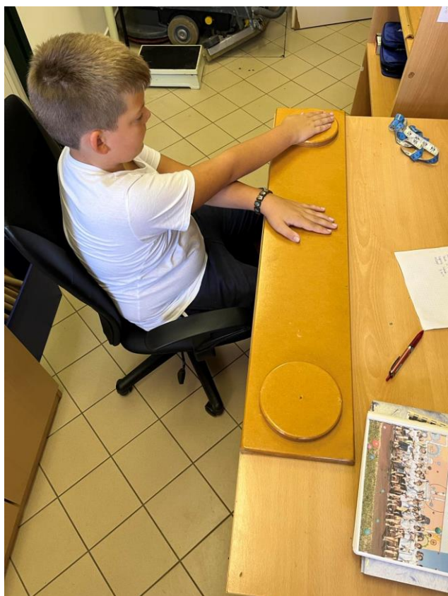
Slika 10. Taping rukom ( kratica: MTR)

Na slici 10 prikazan je test Taping rukom, a kratica mu je MTR, a slova kratice označavaju M- motorička sposobnost, T-taping i R- rukom. Taping rukom, kao što je navedeno u kratlici, spada pod motoričke sposobnosti kojim se mjeri brzina učenikova pokreta. Na postavljenoj dasci nalaze se dva kruga koji imaju promjer od 20 cm, a razmak im je od 61 cm. Postava je napravljena od kvalitetne šperploče. Klupa i stol koji se koriste prilikom izvedbe, moraju biti prilagođene dobi učenika. Ovaj se test provodi na način da učenik sjeda na stolac i povlači noge pod klupom.