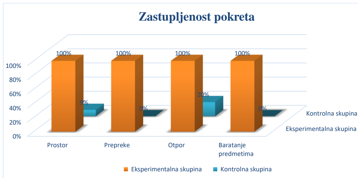
Graf 2 :Zastupljenost biotičko motoričkih znanja u eksperimentalnoj i kontrolnoj mješovitoj skupini u sobi dnevnog boravka

Rezultati jasno ukazuju na to kako je pokret u eksperimentalnoj skupini djece prisutan u potpunosti u svim domenama biotičko motoričkih znanja, dok pokret u kontrolnoj skupini neusporedivo manje prisutan.