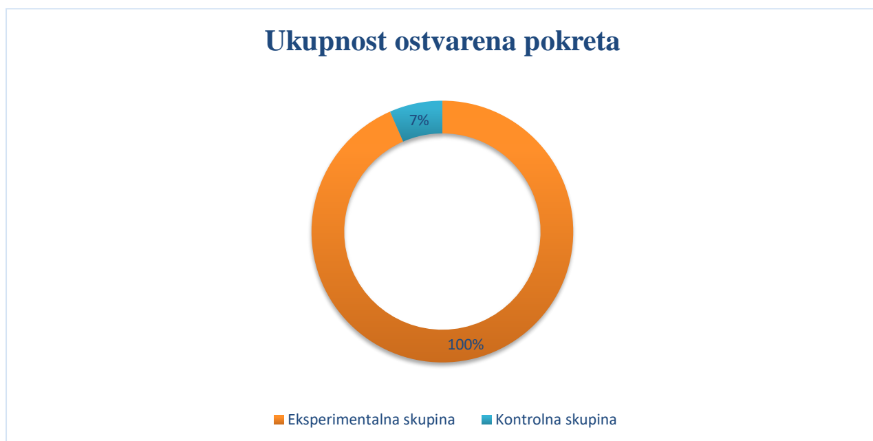
Graf 3 : Pokazatelj cjelovitog motoričkog razvoja

Međutim, istraživanje dokazuje 100% cjeloviti motorički razvoj znanja u eksperimentalnoj skupini i to u svakoj domeni, dok kontrolna skupina pokazuje sveukupni motorički razvoj u samo 7% domena pokreta.